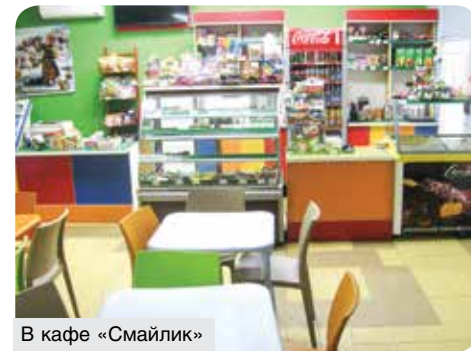
В кафе «Смайлик»

Ближе к рынку и автостанции, можно сказать, в сердце райцентра, еще несколько торговых точек кооператоров. И тоже разноликих. В хозяйственном, что непосредственно при правлении райпо, торжество франчайзингового взаимодействия с компанией ОМА. Многолюдно и в «Мясной лавке» по соседству. Реконструировали ее в минувшем году, но берет она не только свежестью интерьера – привлекает людей и широчайшее предложение всевозможных изысков по хорошим ценам, и оказываемые приветливыми продавцами сопутствующие услуги: по