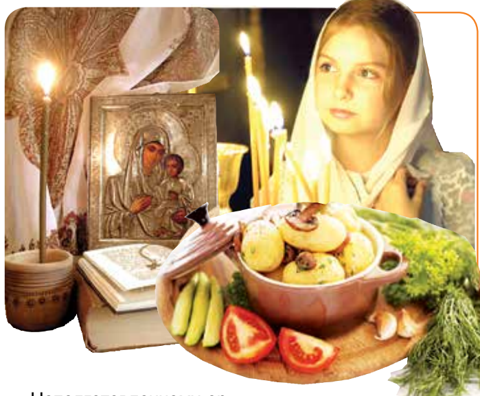
Коллаж Татьяны ГОРБАЧ

У православных христиан начался Великий пост – один из самых строгих в церковном календаре. Всем, кто решит поститься, запрещено употреблять пищу животного происхождения. Это значит, исключено любое мясо, молоко, яйца и, разумеется, прочие продукты, в составе которых они могут находиться.