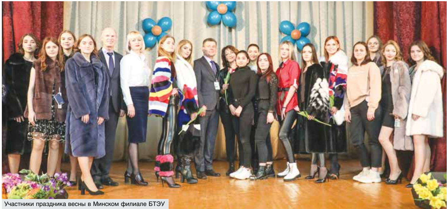
Участники праздника весны в Минском филиале БТЭУ

Традиционный праздник в Минском филиале БТЭУ в этом году проходил не совсем обычно. Здесь постарались совместить приятное с полезным, сделав акцент на развитии творческих способностей обучающихся. Им была предложена развлекательно-познавательная программа, участие в которой мог принять любой желающий. Тема – пушное звероводство и производство одежды из меха в системе потребительской кооперации. Изюминкой программы стало дефиле меховых изделий УП «Белкоопмех». В качестве моделей выступили обучающиеся. Красивых девушек в потрясающих нарядах приветствовали аплодисментами. Дизайн-центр GNL со своей коллекцией и профессиональными моделями продолжил яркое шоу.