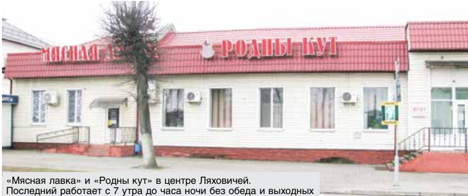
«Мясная лавка» и «Родны кут» в центре Ляховичей. Последний работает с 7 утра до часа ночи без обеда и выходных