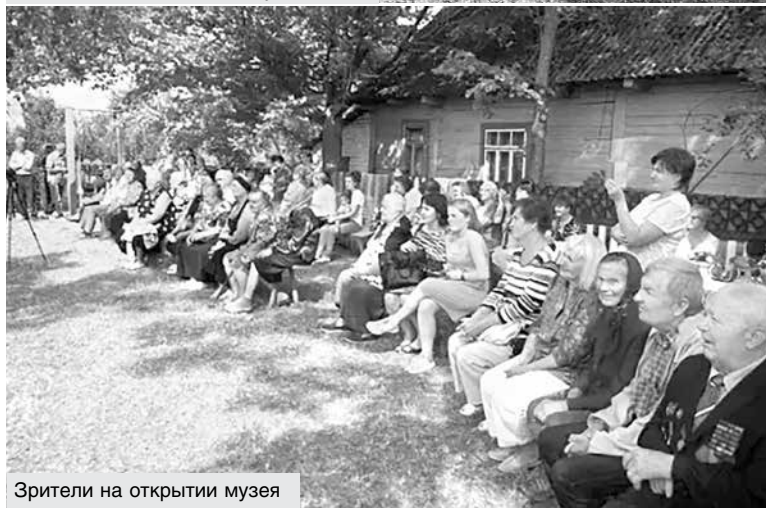
Зрители на открытии музея