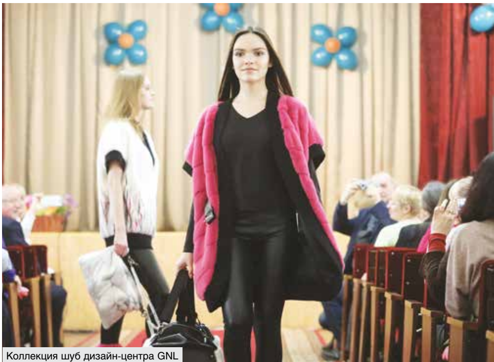
Коллекция шуб дизайн-центра GNL