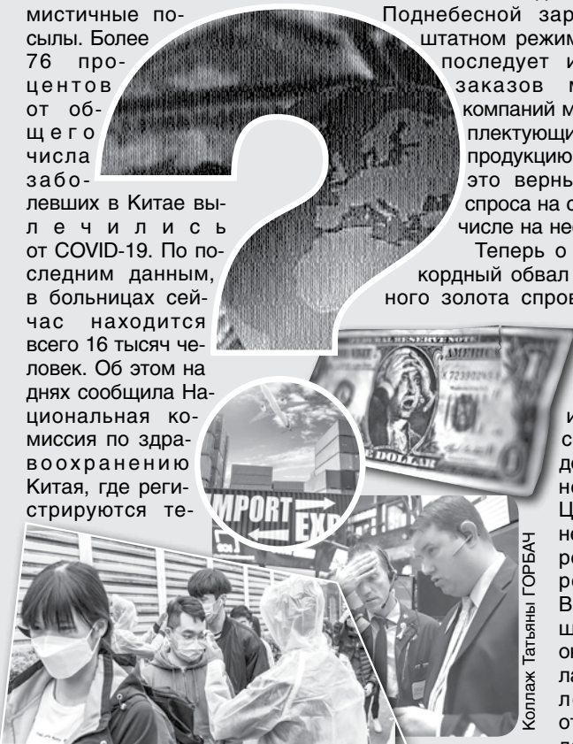
Коллаж Татьяна ГОРБАЧ