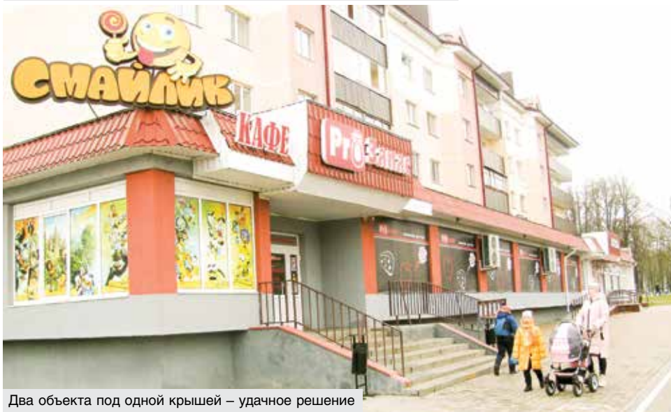
Два объекта под одной крышей – удачное решение

ноцветная, со стен улыбаются мультяшные герои, много игрушек и книг. Есть даже миниатюрные качели и бассейн с шариками – этот уголок устлан ковриками-матами, можно разуться и пошалить всласть.