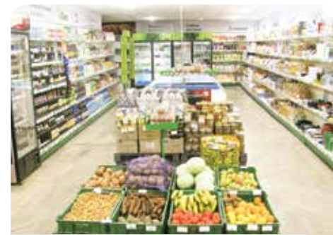
Бывшая «Щара», а нынче «Родны кут»