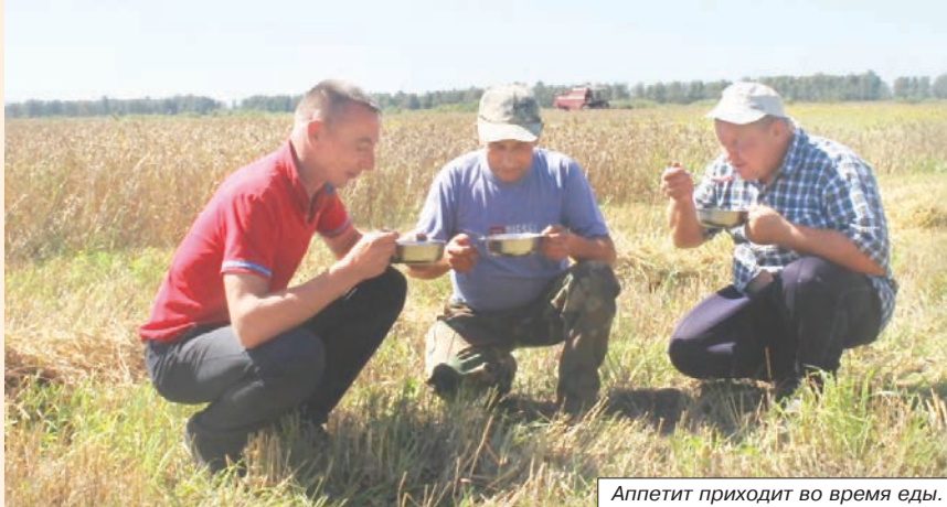
Аппетит приходит во время еды.

та. Одни хозяйства оплачивают наши услуги деньгами, другие — встречными поставками. В качестве оплаты бе-