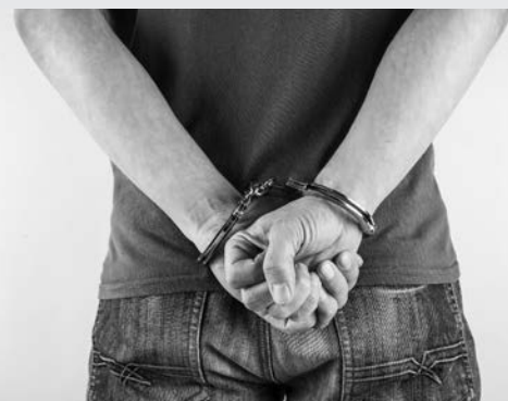
Схема совершения преступления была следующей: 30-летний мужчина заходил в помещение аптеки и под предлогом приобретения продукции отвлекал продавца. Главная цель его действий — добиться того, чтобы кассовый аппарат остался без присмотра. В случае успеха он по мобильному сообщал 33-летнему поделщику, что к аппарату имеется свободный доступ. Тот незаметно входил в помещение аптеки через главный вход, проникал к кассовому оборудованию, похищал выручку и покидал здание. Через некоторое время из аптеки выходил и «покупатель».

Первое хищение было совершено в аптеке на ул. Руссиянова в Минске. В тот же день мужчины направились в аптеку на ул. Селицкого. Там действия одного из преступников заметила заведующая, которая рукой перекрыла выход из помещения. Мужчины, понимая, что их разоблачили, начали действовать открыто, напали на женщину и скрылись с похищенным. Следствием данный факт был квалифицирован по ч. 2 ст. 206 (грабеж) УК Беларуси.