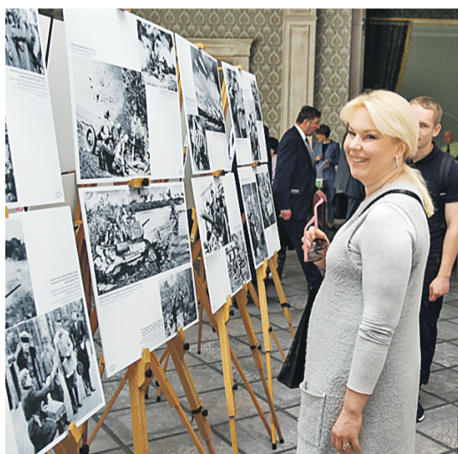
В дни форума работала фотовыставка БЕЛТА «Беларусь помнит. 75 мгновений войны».

Главный редактор радио «Эхо Москвы» Алексей Венедиктов дал свое народное определение существующим на одном инфополе официальным СМИ и подпольным, в том числе тиражирующим фейковые новости: