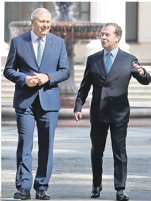
О конкретном размере компенсации урона, нанесенного экономике Беларуси в результате ЧП на трубопроводе, Сергей Румас и Дмитрий Медведев пока не говорили, но российский премьер выразил готовность к диалогу.

«Белнефтехим» также назвал примерный ущерб отрасли, когда из-за загрязненной хлороорганикой нефти 19 апреля пришлось приостановить транзит российских углеводородов в Европу по нефтепроводу «Дружба». Речь идет о сумме около 100 миллионов долларов.