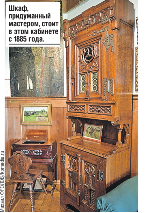
Шкаф, придуманный мастером, стоит в этом кабинете с 1885 года.

Конечно, Поленов тщательно продумал освещение и сделал окно выходящим на север так, чтобы был рассеянный свет. На большое полотно мог смотреть сверху, из мансарды, через специально вырезанный в потолке люк. При желании мастерская легко превращалась в зрительный зал. Там появлялась даже сцена. По бокам ее украшали две каменные колонны из тарусского известняка, который Поленов называл «тарусским мрамором».