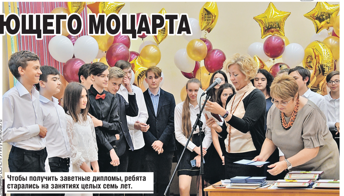
Чтобы получить заветные дипломы, ребята старались на занятиях целых семь лет.

– Вас учили не только как держать инструмент, но и терпению, трудолюбию