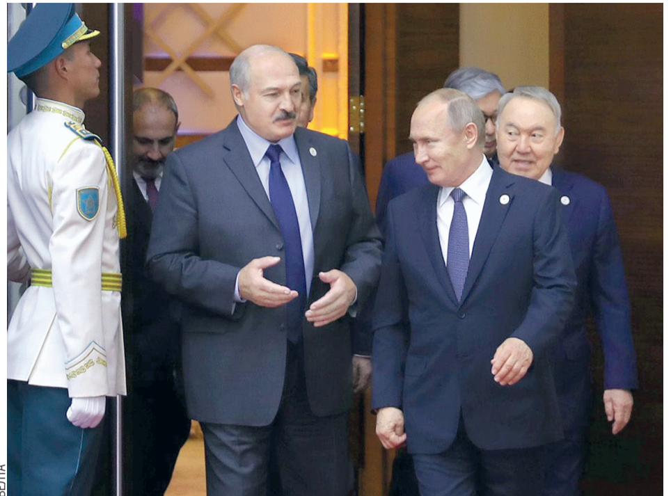
Александр Лукашенко и Владимир Путин успели переговорить с глазу на глаз еще до начала заседания ВЕЭС.

– Надо отказаться от протекционистских решений на национальных уровнях, введения всевозможных запретительных и ограничительных мер. В этом залог формирования прочного фундамента нашего союза, успешного развития экономик стран, участвующих