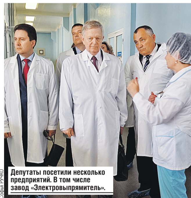
Депутаты посетили несколько предприятий. В том числе завод «Электровыпрямитель».

Продукция на 3,5 миллиарда рос. рублей отправилась в прошлом году в Беларусь