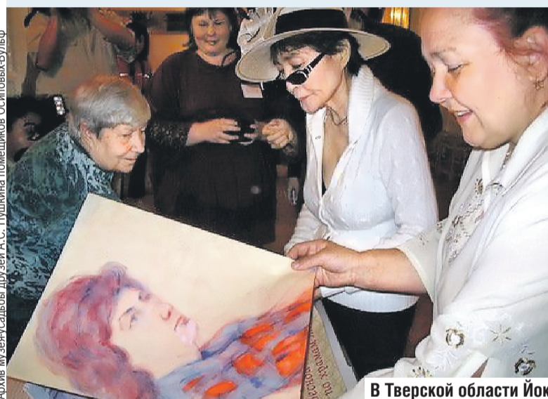
В Тверской области Йоко Оно почувствовала себя как дома.