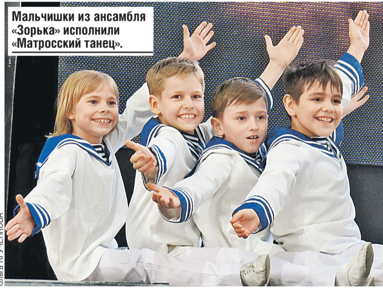
Мальчишки из ансамбля «Зорька» исполнили «Матросский танец».

сыном, чтобы он подышал этим воздухом. Очень порадовал исполнительский уровень – процентов девяносто пели очень достойно, жюри было невероятно трудно определить лауреатов.