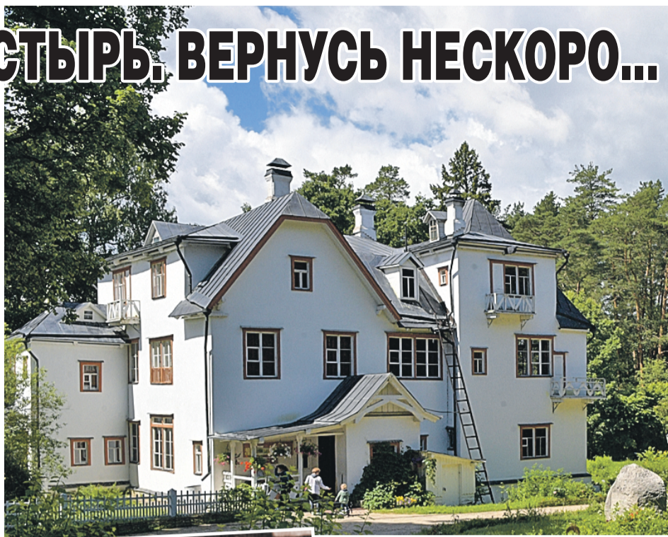
Пейзажист сам создал эскизы особняка, в котором ему было комфортно жить и работать.