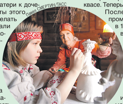
Секреты ремесла четыре века передавали по женской линии.