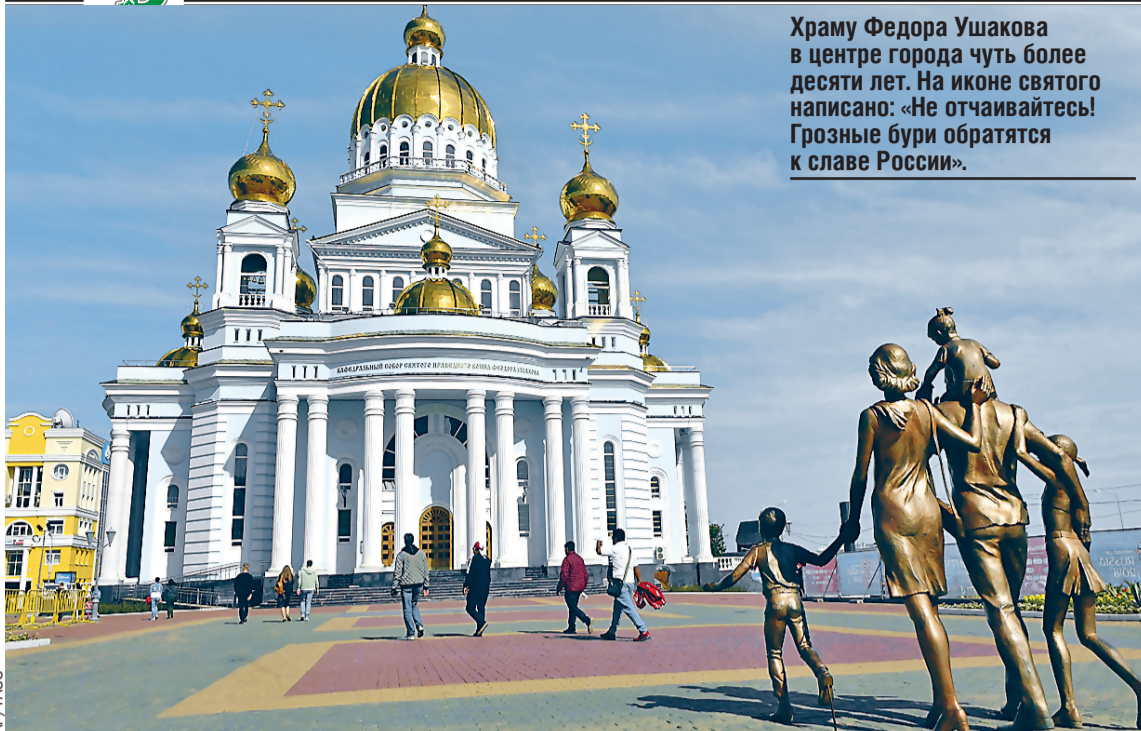
Храму Федора Ушакова в центре города чуть более десяти лет. На иконе святого написано: «Не отчаивайтесь! Грозные бури обратятся к славе России».