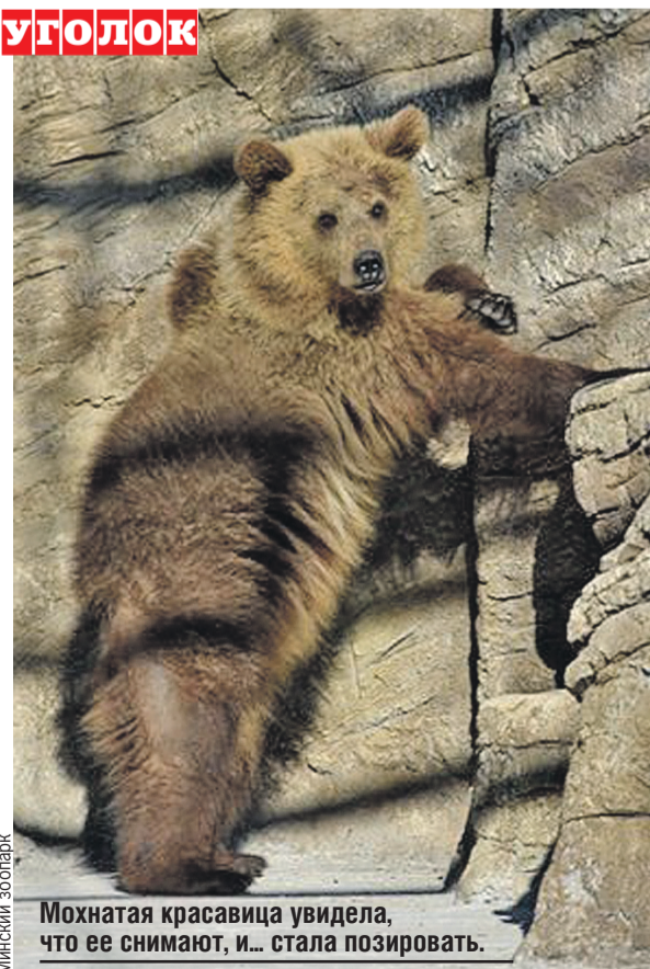
Мохнатая красавица увидела, что ее снимают, и... стала позировать.