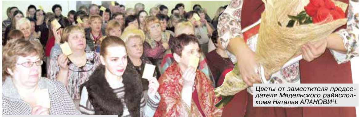
Участники собрания признали удовлетворительную работу правления райпо в отчетном периоде.

Против такой постановки вопроса, согласитесь, трудно что-либо возразить. Действительно, дело человеком ставится и славится.