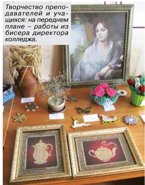
Творчество преподавателей и учащихся: на переднем плане – работы из бисера директора колледжа.