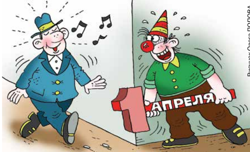
Рисунок Олега ПОПОВА

Ряд историков называют точную дату, когда был отпразднован первый день дурака. По их мнению, это произошло в 1564 году, после того как Карл IX, будучи королем Франции, приказал вести летоисчисление по григорианскому календарю, который заменил прежний – юлианский, сместив при этом Новый год на первое число января. Однако люди по старинке дарили подарки именно на первое апреля. При попытке властей как-то это запретить люди парировали эти старания шутками. Вот так наследие юлианского календаря превратило 1 апреля во всемирный День смеха.