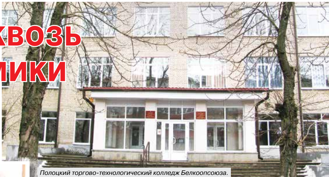
Полоцкий торгово-технологический колледж Белкоопсоюза.