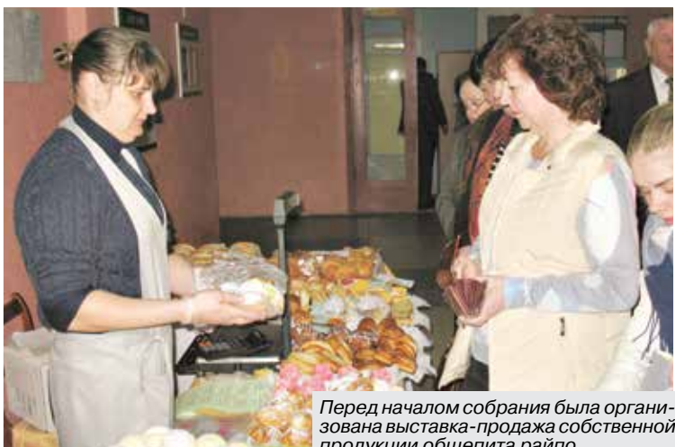
Перед началом собрания была организована выставка-продажа собственной продукции общепита райпо.