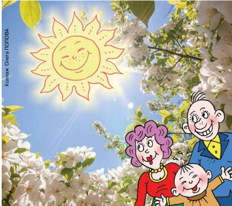
Коллаж Олега ПОПОВА