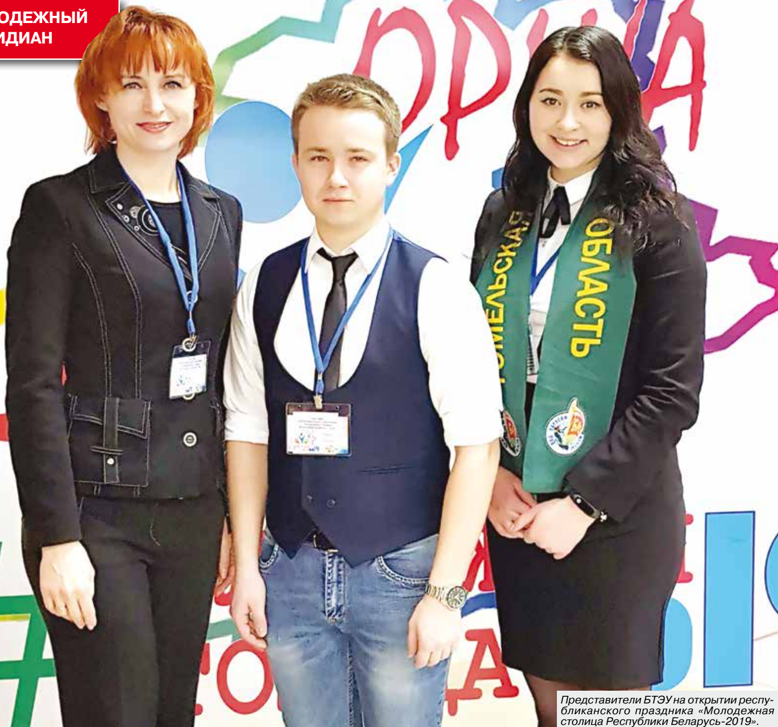
Представители БТЭУ на открытии республиканского праздника «Молодежная столица Республики Беларусь-2019».