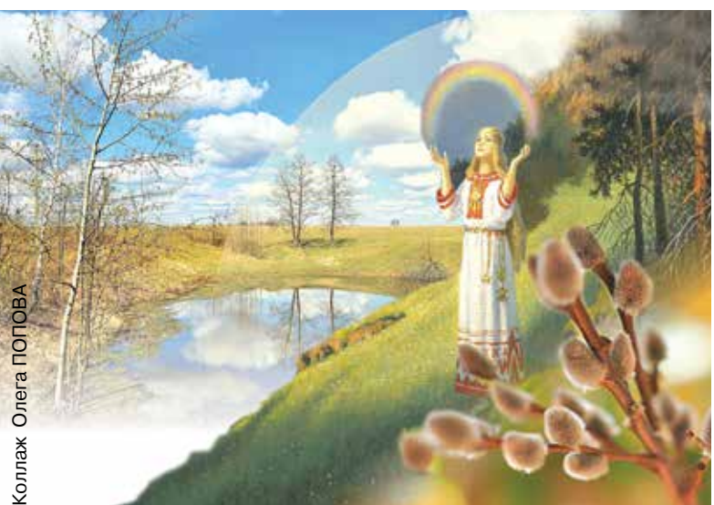
Коллаж Олега ПОПОВА

Для этого гадания надо собрать как минимум трех девушек, найти место, где грязь глубокая и жирная. Каждая девушка наступала сапожком в грязь, чтобы остался глубокий след. Потом в след (каждая в свой) девушка выливала стакан воды. В чей след вода впитается быстрее, та раньше других и выйдет замуж. А вот если вода вообще не впитается, останется стоять в следе, то девушке выйти замуж не суждено.