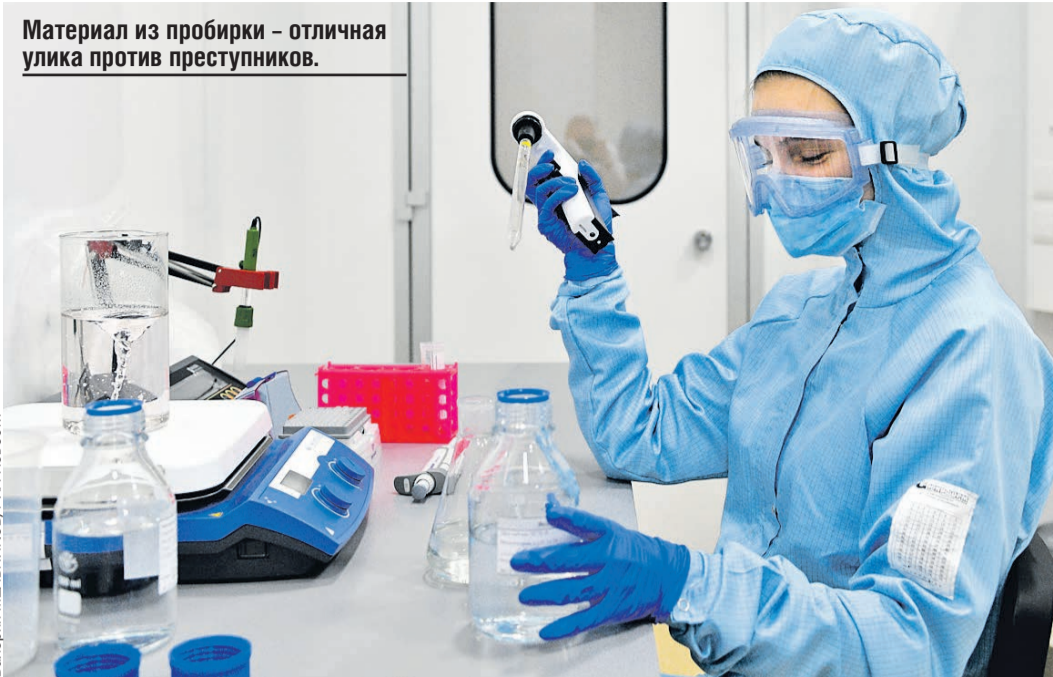
Материал из пробирки – отличная улика против преступников.

– Этнические группы отличаются друг от друга, есть генетические особенности.