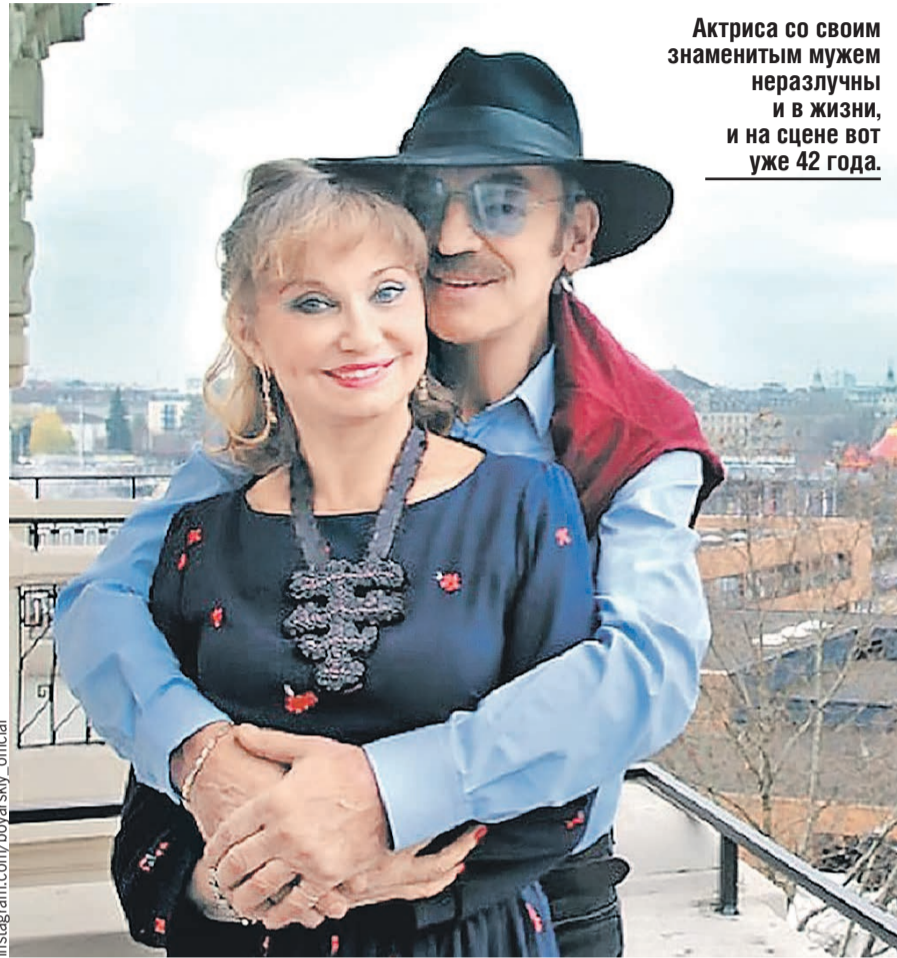
Актриса со своим знаменитым мужем неразлучны и в жизни, и на сцене вот уже 42 года.

– Все случайно получилось. Я окончила школу, не знала, куда идти. Ма-