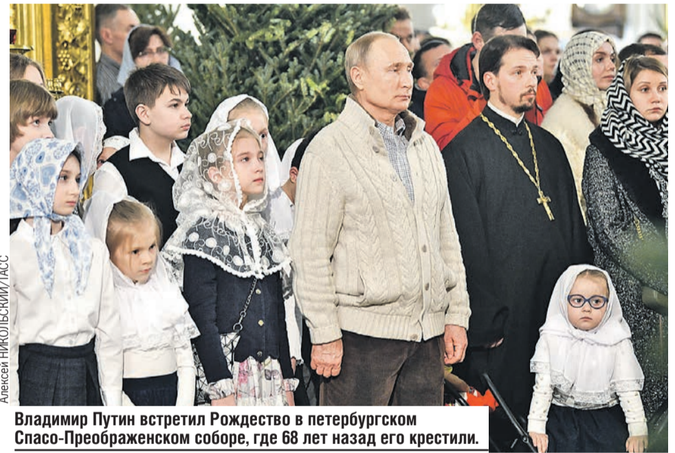
Владимир Путин встретил Рождество в петербургском Спасо-Преображенском соборе, где 68 лет назад его крестили.

– Наше единство – основа достижения любых самых высоких целей. Пожелаем друг другу и нашей Родине мира, благополучия и процветания.