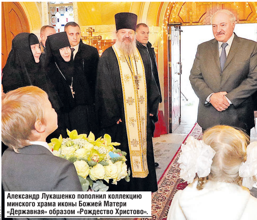
Александр Лукашенко пополнил коллекцию минского храма иконы Божией Матери «Державная» образом «Рождество Христово».