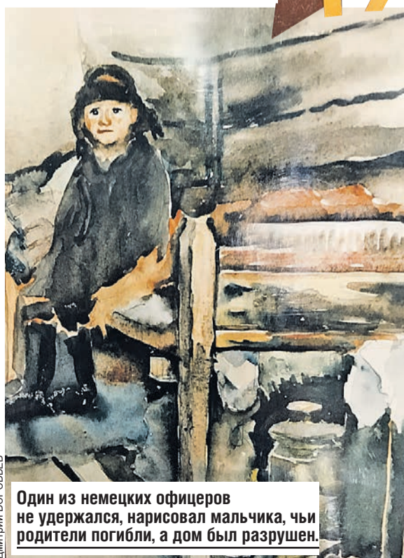
Один из немецких офицеров не удержался, нарисовал мальчика, чьи родители погибли, а дом был разрушен.

Плиты из картеповской стали со временем покроются патиной, дающей эффект бархата.