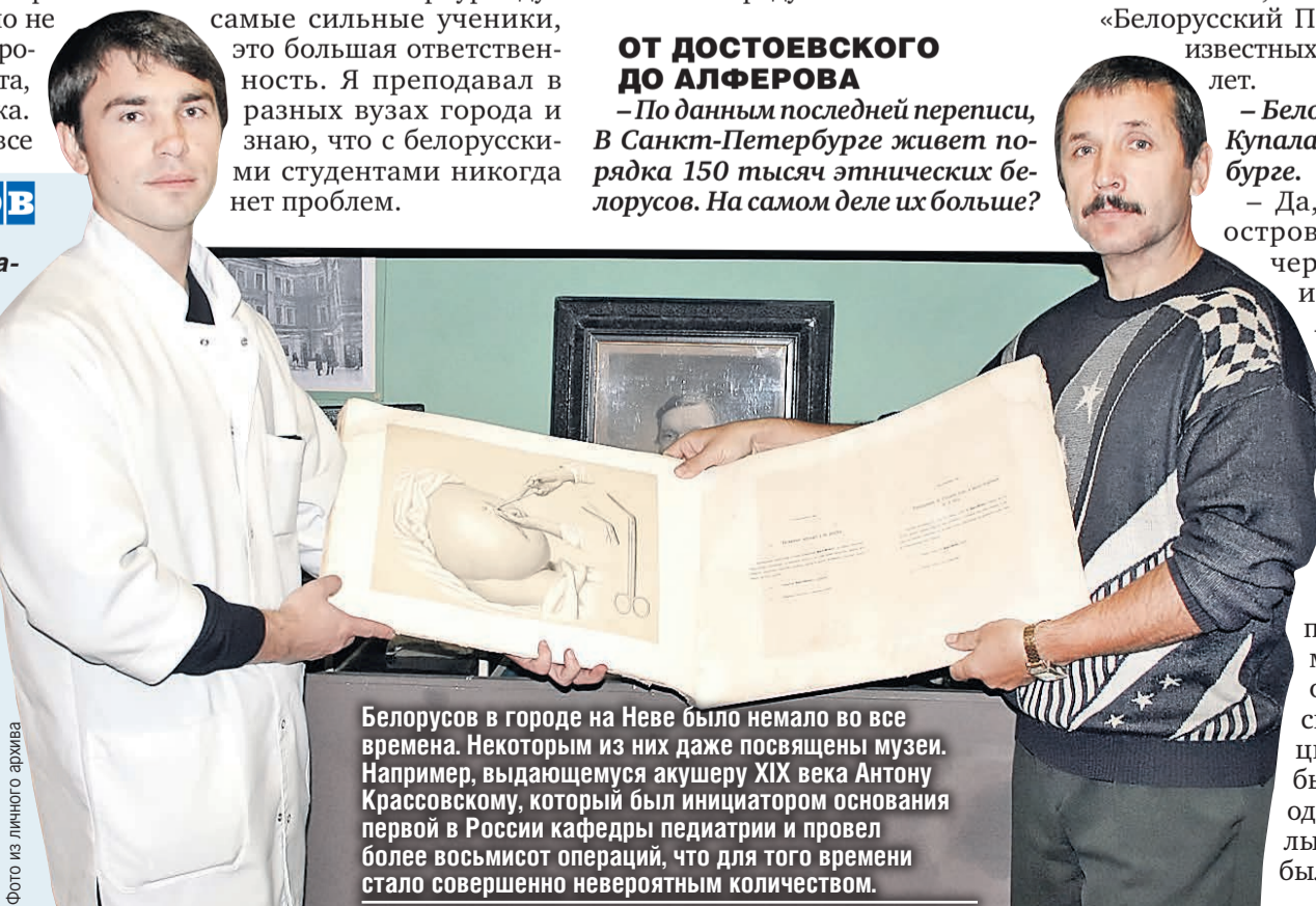
Белорусов в городе на Неве было немало во все времена. Некоторым из них даже посвящены музеи. Например, выдающемуся акушеру XIX века Антону Крассовскому, который был инициатором основания первой в России кафедры педиатрии и провел более восьмисот операций, что для того времени стало совершенно невероятным количеством.

– Драник – от слова «драть», то есть тереть на терке. Никаких мясорубок или овощерезок. У нас жена картошку чистит, я натираю. Но есть секрет! Драники вкуснее не из ранней картошки, а из более поздних сортов. Из нового урожая можно делать в октябре, иначе вкус не тот. Когда натерли, пусть постоит минут 15–20, выделится жидкость, появится белый осадок – это крахмал, его надо удалить. Добавляете яйца, масло, немного муки, некоторые добавляют зелень, например, лучок, или специи. И получается очень вкусно.