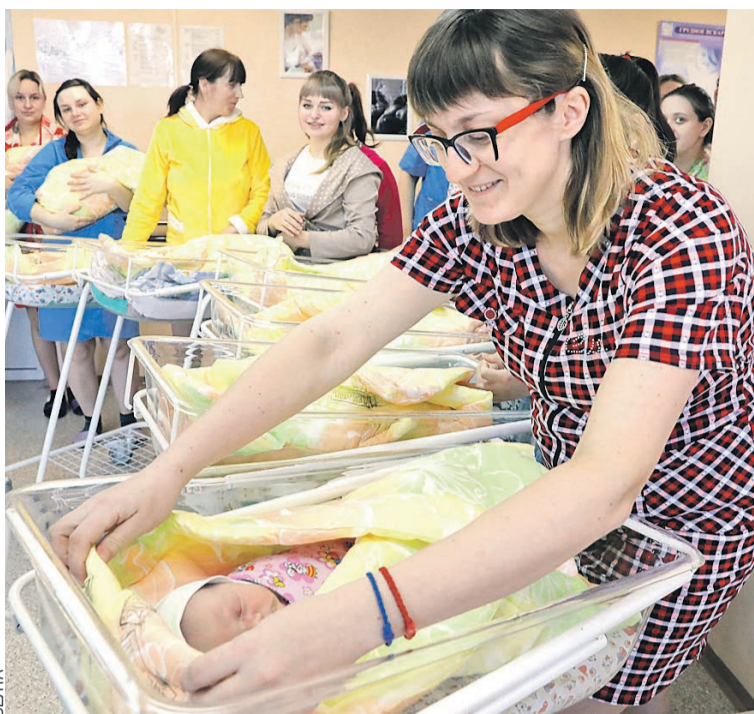
Молодые мамы нынче в дефиците. Сказывается демографический спад, который был в 1990-е.

МРОТ. Главное, чтобы он не был ниже федерального. Так, в Москве его подняли с 19 351 до 20 195 российских рублей.