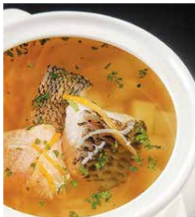
● Уха по-царски – 2,49 рубля