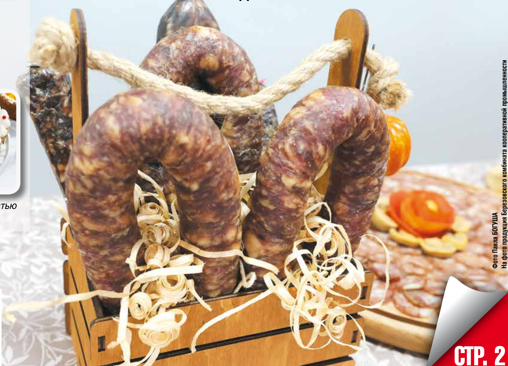
На фото продукция Березовского комбината кооперативной промышленности

КОЛЛЕГ ИЗ СМОЛЕНСКОЙ ОБЛАСТИ ВПЕЧАТЛИЛ УРОВЕНЬ ПРОМЫШЛЕННОГО ПРОИЗВОДСТВА БРЕСТСКОГО ОБЛПОТРЕБСОЮЗА