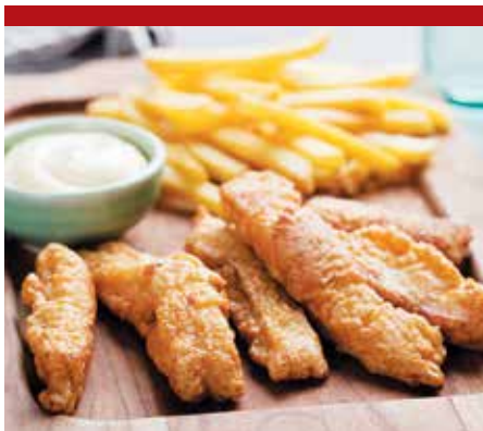
● Язык говяжий в тесте (жареный) с картофелем фри и огурцом маринованным – 4,99 рубля