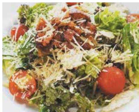
● Салат «Смакота» – 2,89 рубля

В магазинах, кулинариях, универсамах, кафетериях, буфетах предлагают: