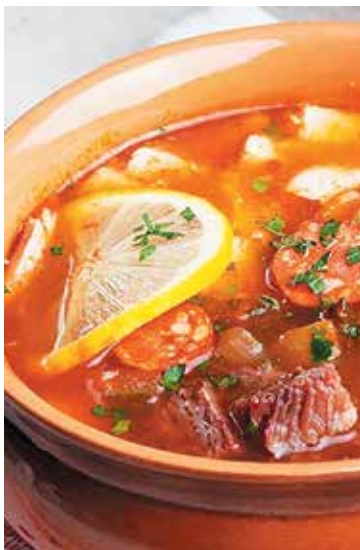
● Солянка сборная мясная – 1,99 рубля