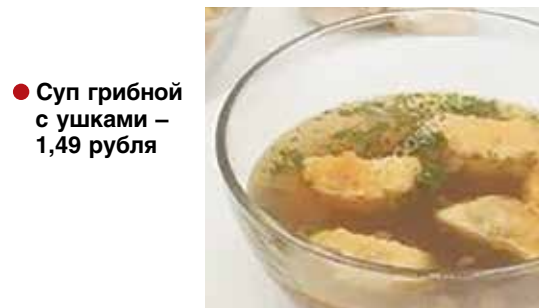
● Суп грибной с ушками – 1,49 рубля