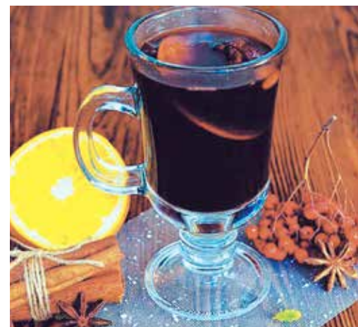
● Напиток «Пряный» (глинтвейн) – 1,49 рубля