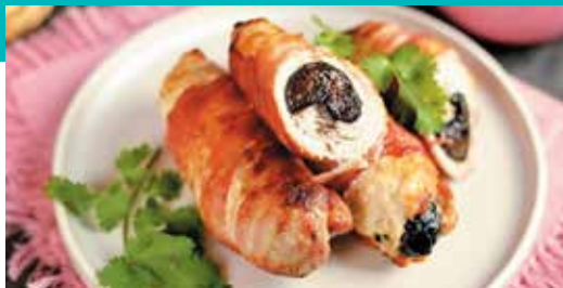
● Рулетки из свинины, фаршированные яблоками и черносливом с жареной капустой – 4,59 рубля