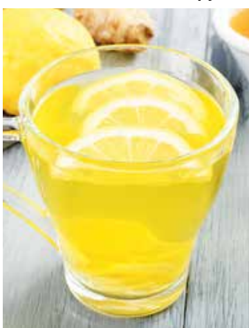
● Напиток с имбирем и лимоном – 1 рубль