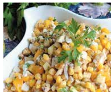
● Салат «Ивушка» – 2,99 рубля