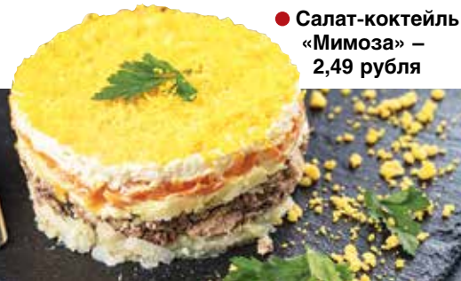
● Салат-коктейль «Мимоза» – 2,49 рубля