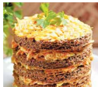
● Торт печеночный – 2,99 рубля