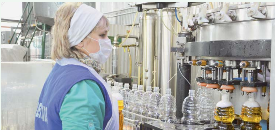
Любая газировка содержит много сахара. Для наглядности: в литре напитков «Игуменских криници» 64 грамма сахара — у других же производителей этот показатель около 100 граммов.

тические добавки, натуральный краситель — сахарный колер собственного производства, лимонная кислота и консервант. Без него куда — торговые сети диктуют свои условия по срокам хранения. Напитки «Игуменских криници» могут храниться полгода. Вода для напитков и просто для бутылирования берется из стометровой артезианской скважины прямо на территории предприятия. Ее очищают от механических примесей, соединений железа, умягчают и обеззараживают бактерицидной установкой. По своим качествам она не уступает родниковой, поэтому свое название «Игуменские криници» оправдывают на все сто.