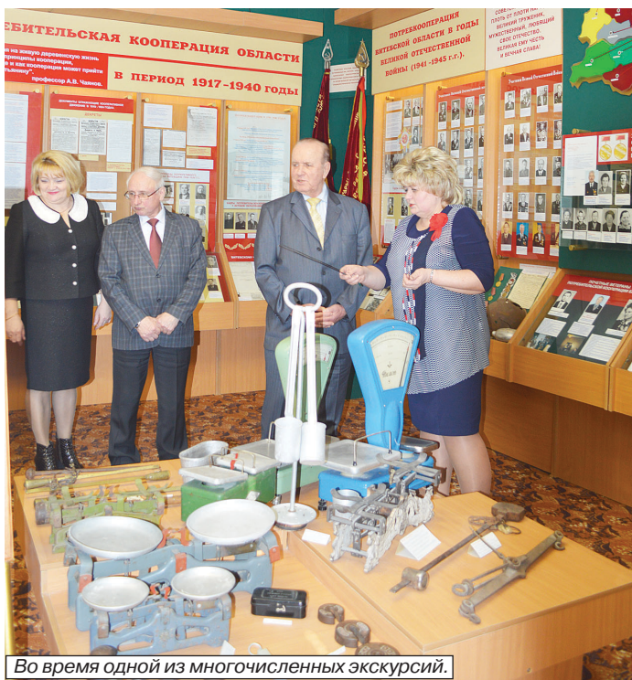
Во время одной из многочисленных экскурсий.

ющиеся в музее продукты: разверстки красноармейцев. Время шло, кооперация развивалась. Дух перемен не обошел стороной ее работу в сферах торговли, общественного питания, строительства, заготовок. Возникла и необходимость в подготовке профессиональных кадров. В 1924 году в городе над Двиной образовали первый кооперативный техникум. Фото его выпускников тоже бережно хранят в музее.