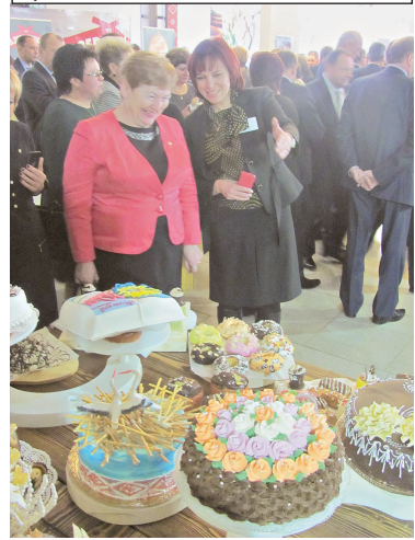
Сапраўдная смаката. Ну як тут прайсці міма...