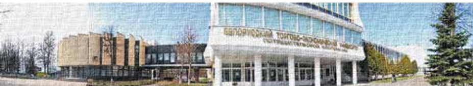
Современный вид Белорусского торгово-экономического университета потребительской кооперации (г. Гомель)

ПРИГЛАШАЕМ ПРИНЯТЬ УЧАСТИЕ В НАШЕМ МАРАФОНЕ. ПРИСЫЛАЙТЕ СВОИ ФОТОСНИМКИ В РЕДАКЦИЮ!