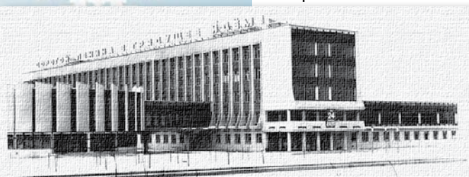
Так первоначально, в апреле 1980 года, выглядел новый корпус Гомельского кооперативного института по проспекту Октября, 48. На здании красовался лозунг советской эпохи «Дорогой Ленина в грядущее идем!». В темное время суток лозунг подсвечивался

Присылайте свои фотостории на электронный адрес kuzmich@sb.by или почтовый адрес редакции с пометкой «ВП». Фото из альбома». Лучшие фотостории будут опубликованы на страницах вашей любимой газеты.