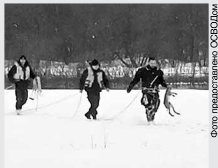
Фото предоставлено ОСВОДОм

В Ветковском районе сотрудники ОСВОДа спасли тонувшего зайца.