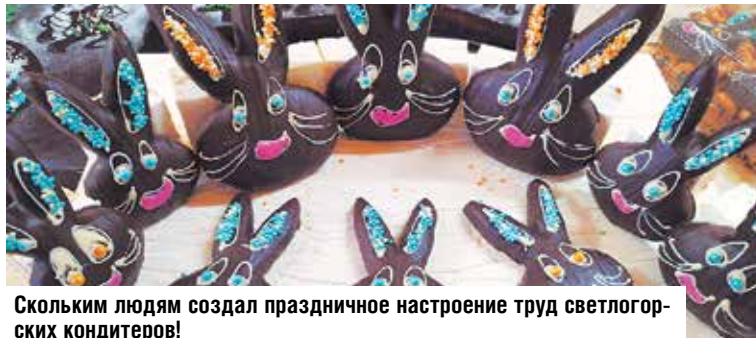
Скольким людям создал праздничное настроение труд светлогорских кондитеров!

В период зимних праздников кондитеры изготовили тысячи фигурных расписных пряников в виде сапожек, рукавичек, снеговиков, рождественских сувенирных пряников «Троицкий». Вкуснейшие торты и другая кондитерская продукция, в том числе и собственной рецептуры, никого из светлогорчан и гостей района не оставили равнодушным.