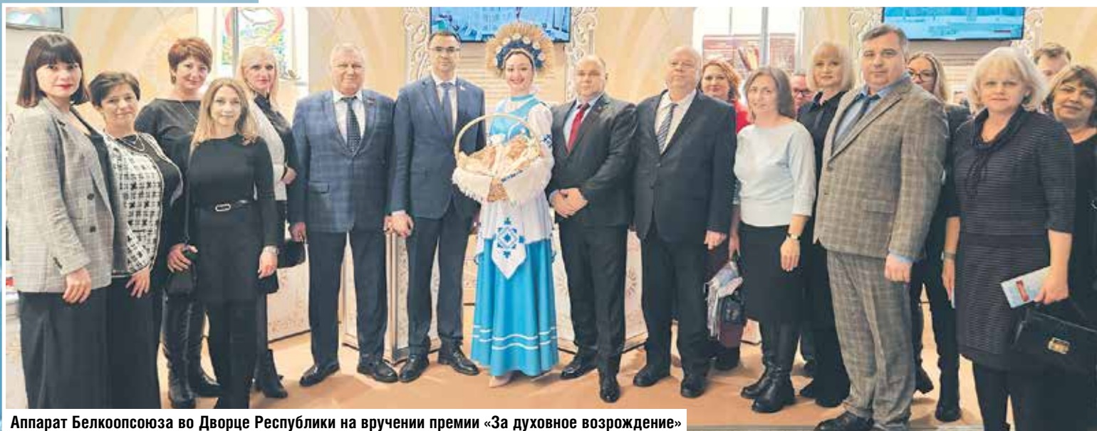
Аппарат Белкоопсоюза во Дворце Республики на вручении премии «За духовное возрождение»