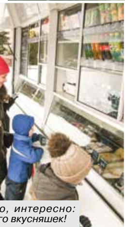
Конечно, интересно: так много вкусняшек!