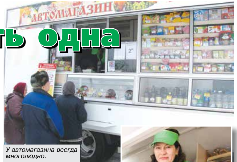
У автомагазина всегда многолюдно.

В настоящее время обслуживает этот маршрут новый автомагазин, приобрели его в минувшем году. Между тем определение «новый» свидетельствует в данном случае не только о возрасте. Новизна еще и в том, что кооператоры подошли к вопросу обновления парка творчески, выйдя за рамки стандартных подходов к комплектации: специалисты Могилевского райпо спроектировали этот автомагазин, можно сказать, самостоятельно. Проанализировали имеющиеся потребности, просчитали возможности повышения эффективности, сформировали технико-экономическое задание, объявили