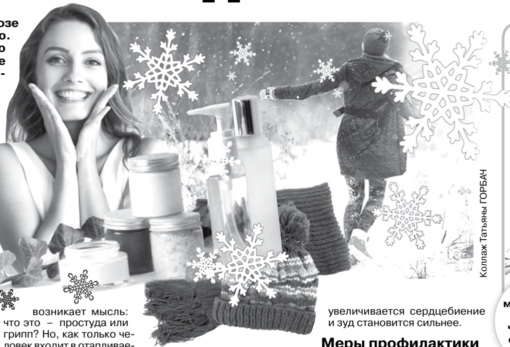
Коллаж Татьяна ГОРБАЧ

Холодовый ринит (насморк) Этот симптом проявляется закладыванием носа во время вдыхания холодного воздуха, появлением обильных выделений из носа и постоянным желанием чихнуть. У человека