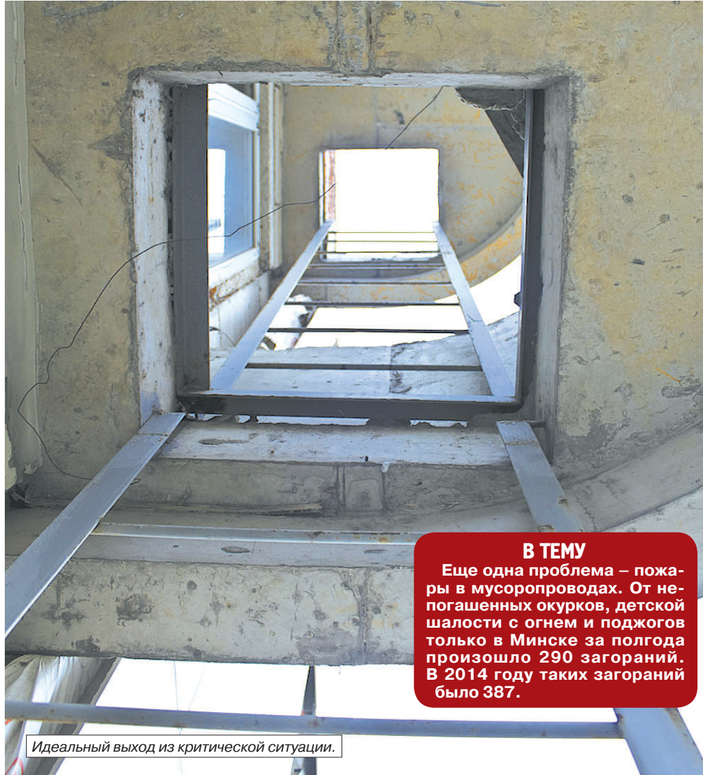
Идеальный выход из критической ситуации.

Обходим весь подъезд. Попутно осматриваем лестничные пролеты и тамбуры. В один пытаемся попасть. Нам не открывают, хотя движение по ту сторону двери слышно. Здесь проблема другая — захламленность мест общего пользования. В этом тамбуре, по словам мастера участка, есть все. Старый диван, матрас плюс куча мелкой утвари. В квартиру жильцы и их гости протискиваются бочком. И уговаривают их, и чуть ли не силой заставляют навести порядок в тамбуре. Тщетно. Не помогли ни письменное предупреждение на уборку громоздкогохлама, ни штраф. Впрочем, не все жильцы такие непробиваемые. Многим достаточно только замечания. Поэтому и до составления протокола об административ-