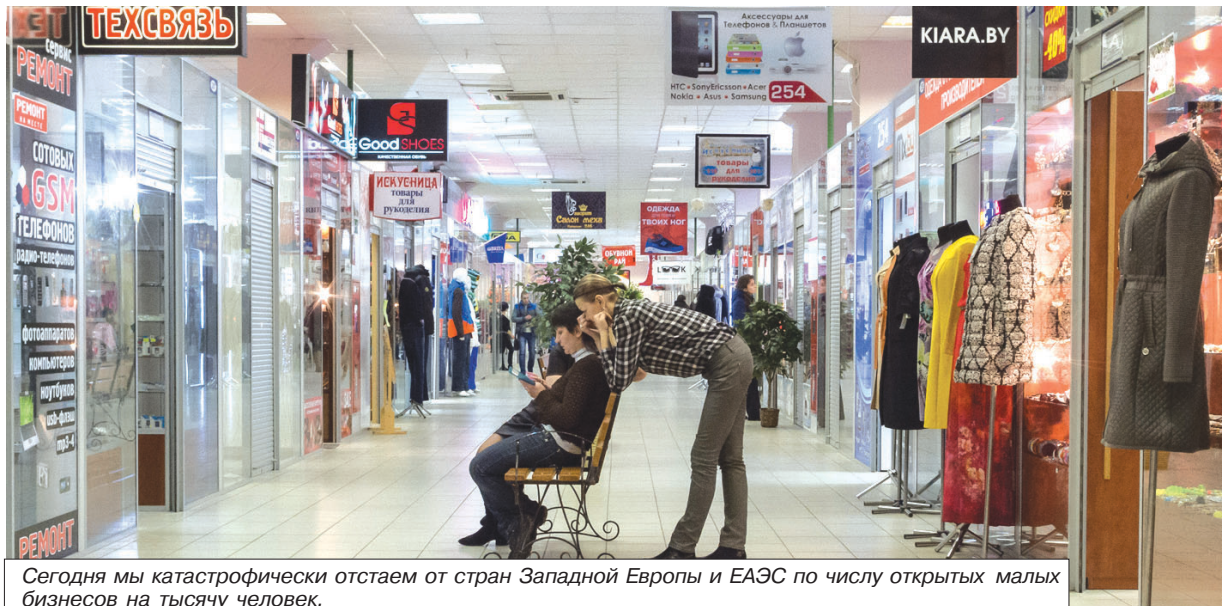
Сегодня мы катастрофически отстаем от стран Западной Европы и ЕАЭС по числу открытых малых бизнесов на тысячу человек.

Александр БЕНЬКО benko@sb.by, Полина КОНОГА konoga@sb.by