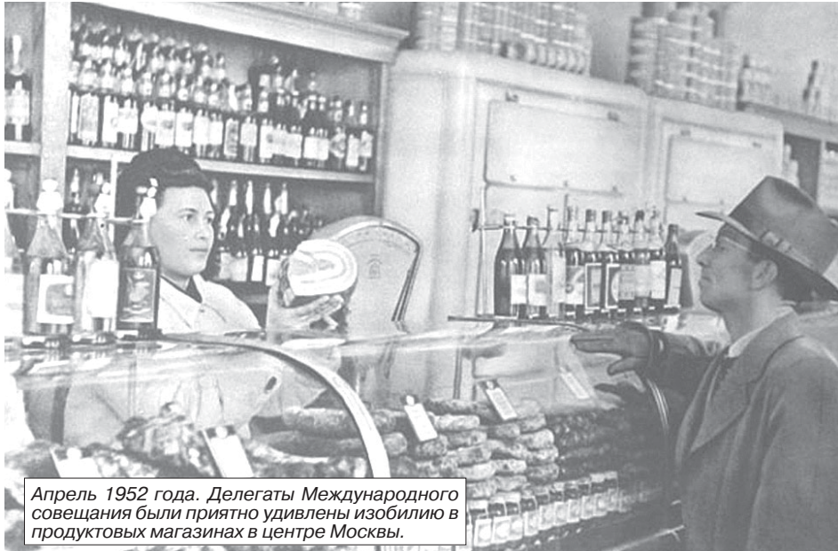
Апрель 1952 года. Делегаты Международного совещания были приятно удивлены изобилию в продуктовых магазинах в центре Москвы.