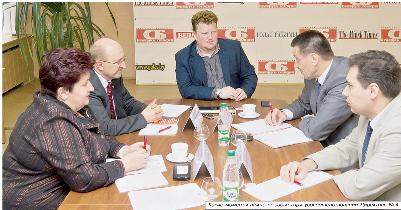
Какие моменты важно не забыть при усовершенствовании Директивы № 4.

разовании, и регистрации, и административные процедуры, и использование тарифной сетки оплаты труда, и лицензирование. Но сейчас мы вплотную подошли к новому этапу. Директива № 4 работает уже четыре с половиной года, в ней есть нормы, которое выполнили свое предназначение и теперь требуют нового толчка. К примеру, темы вовлечения неиспользуемого госимущества в хозяйственный оборот, а также выкупа арендаторами имущества, которое они арендуют. Это важнейшая проблема, причем она влечет за собой и целый пласт других социальных и экономических вопросов. Если бы эти предложения были реализованы, у нас усилился бы средний класс собственников. Конечно, у нас закреплен и действует порядок первоочередного права арендатора выкупа арендуемого имущества в случае, если собственник это имущество продает, но это явно мало, и пришел черед следующего шага. Теперь мы говорим о том, чтобы в обязательном порядке государство продало имущество, если арендатор соответствует всем необходимым критериям: добросовестно выполняет свои обязанности, готов выкупить объект по рыночной стоимости.