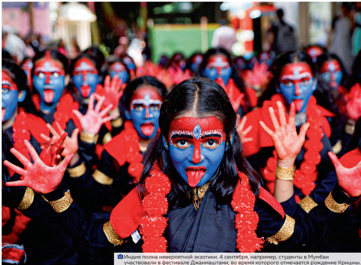
Индия полна невероятной экзотики. 4 сентября, например, студенты в Мумбаи участвовали в фестивале Джанмаштами, во время которого отмечается рождение Кришны.

И ндийское правительство намерено вернуть Индии название Бхарат. Как пишут тамошние СМИ, соответствующую резолюцию могут внести на специальной сессии парламента, которая пройдет с 18 по 22 сентября. «Теперь статья 1 Конституции может гласить: Бхарат, то есть Индия, должен быть Союзом государств», — написал глава Индийского национального конгресса Джайрам Рамеш в соцсети. Кроме того, он сообщил, что официальные приглашения на ужин G20 были отправлены от имени президента Бхарата, а не президента Индии, как раньше. «Британцы переименовали Бхарат в Индию. Наша страна известна под именем Бхарат уже тысячи лет. Это название страны, которое встречается в древних санскритских текстах. Название Индия было колониальным и, таким образом, символом рабства. Название Индия должно быть вычеркнуто из Конституции», — заявил один из депутатов верхней палаты индийского парламента. По Конституции в Индии два официальных языка: английский и хинди. На английском страна называется India, а на хинди — Бхарат. Для принятия резолюции о переименовании требуется, чтобы ее поддержало простое большинство в обеих палатах парламента. Затем власти должны будут внести в Конституцию поправки как минимум в десяти местах, где в английской версии упоминается «правительство Индии».