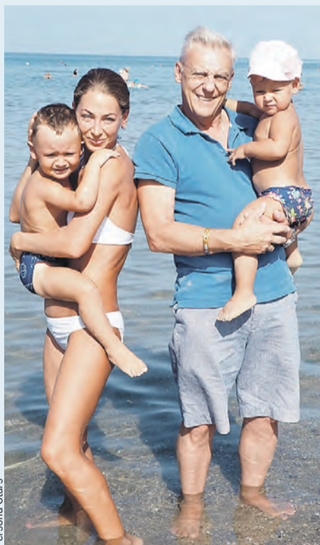
Вместо фитнеса у актера — присмотр за детьми.

я загадываю себе, чтобы Боженька дал мне здоровья и сил поднять детей, так что мне еще шагать и шагать.