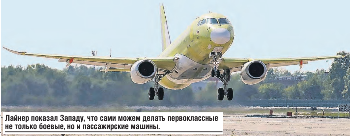
Лайнер показал Западу, что сами можем делать первоклассные не только боевые, но и пассажирские машины.

– Полет прошел успешно. Все системы и двигатель работали нормально, – доложили пилоты после мягкого приземления.