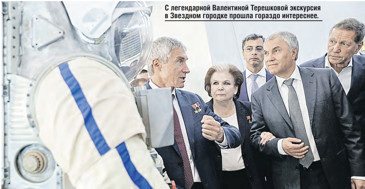
С легендарной Валентиной Терешковой экскурсия в Звездном городке прошла гораздо интереснее.