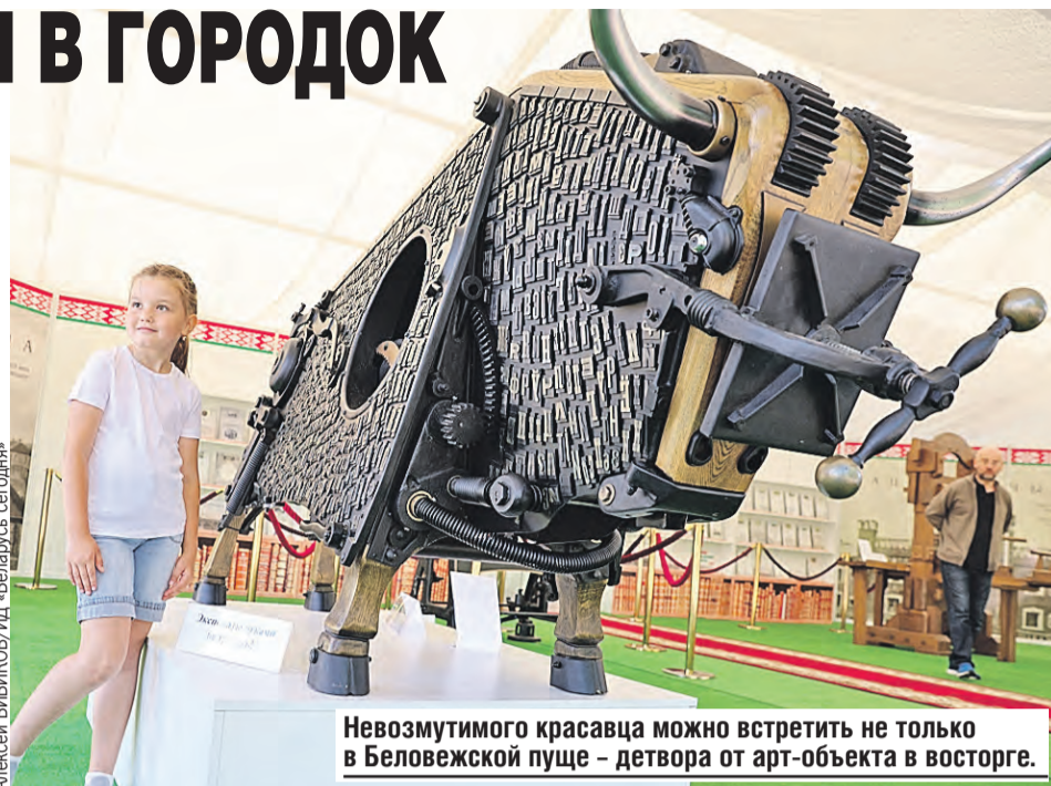
Невозмутимого красавца можно встретить не только в Беловежской пушче – детвора от арт-объекта в восторге.

Неподалеку – импровизированный творческий олимп, где умельцы провели мастер-классы по ткачеству, показали, как обращаться