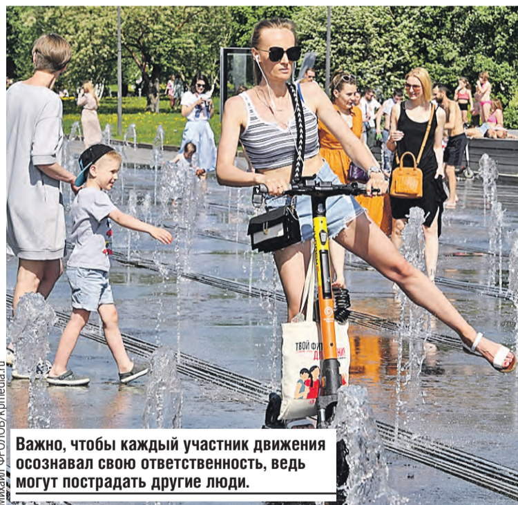
Важно, чтобы каждый участник движения осознавал свою ответственность, ведь могут пострадать другие люди.

– Предлагаются разные пути: как радикальный – полностью запретить прокат электросамокатов, так и более умеренные – например, ограничить их скорость или места пользования. Что касается нашей страны, Правила дорожного движения для электросамокатов, моноколес, электроскейтов, гироскутеров и других средств