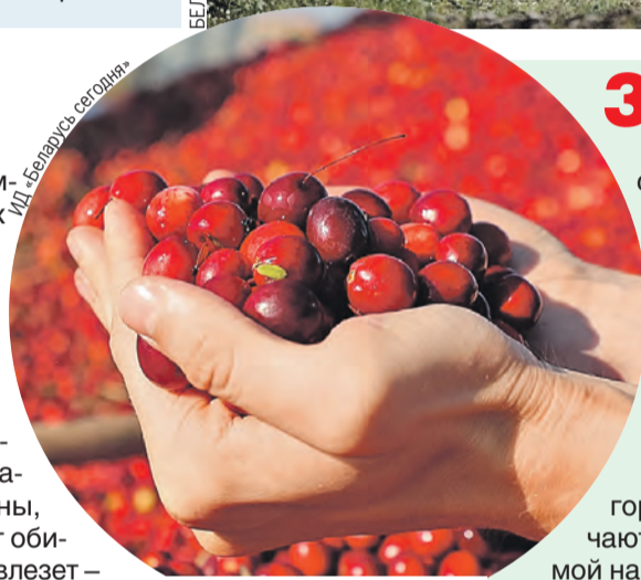
ИД «Беларусь сегодня»

Крупнейший в Европе комплекс верховых, переходных и низинных болот, который удалось сохранить в естественном состоянии. В одиночку лучше не соваться – маршруты пролегают через максимально дикие территории. Песчаные дюны, поросшие лесами, пойменные дубравы и, конечно, мягкие поляны, которые буквально «горят» от обилия клюквы! Собирай сколько влезет – никаких запретов нет.