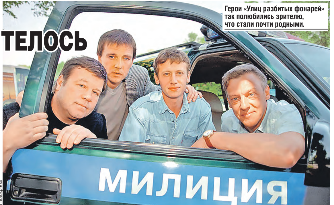
Герои «Улиц разбитых фонарей» так полюбили зрителя, что стали почти родными.

«Улицы разбитых фонарей» дали толчок актерской карьере?