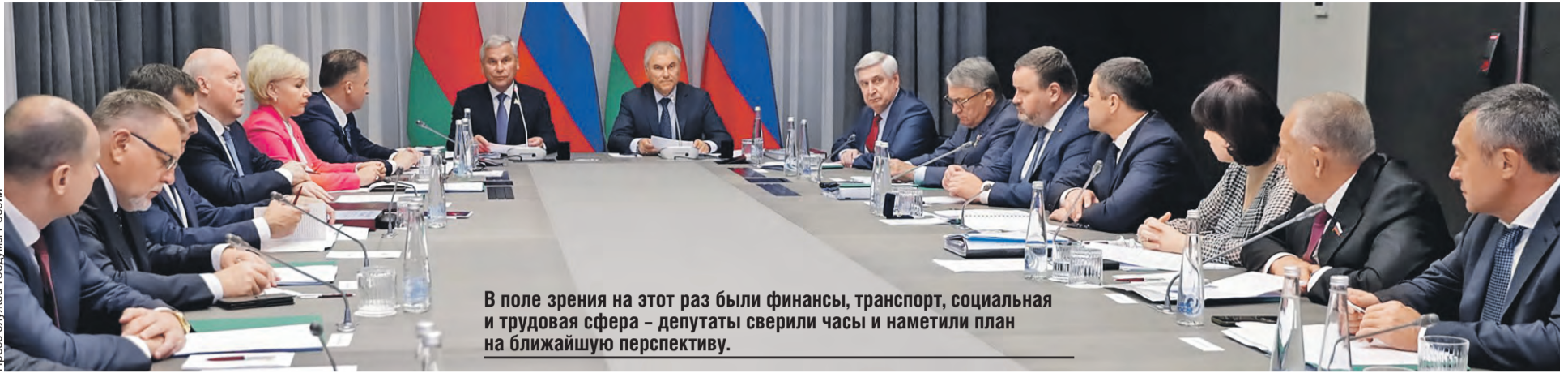
В поле зрения на этот раз были финансы, транспорт, социальная и трудовая сфера – депутаты сверили часы и наметили план на ближайшую перспективу.