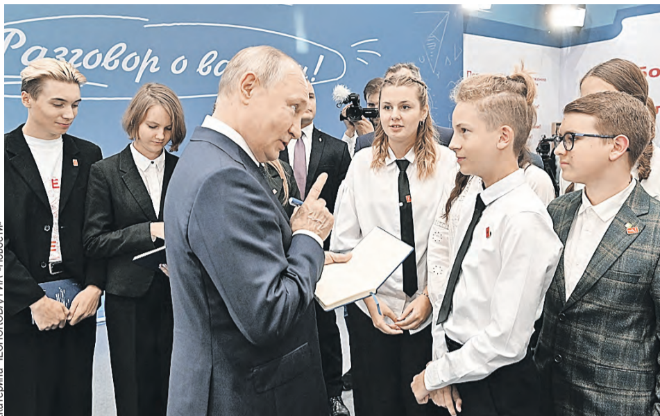
На память о президентском уроке каждый из его участников получил автограф Главы государства.