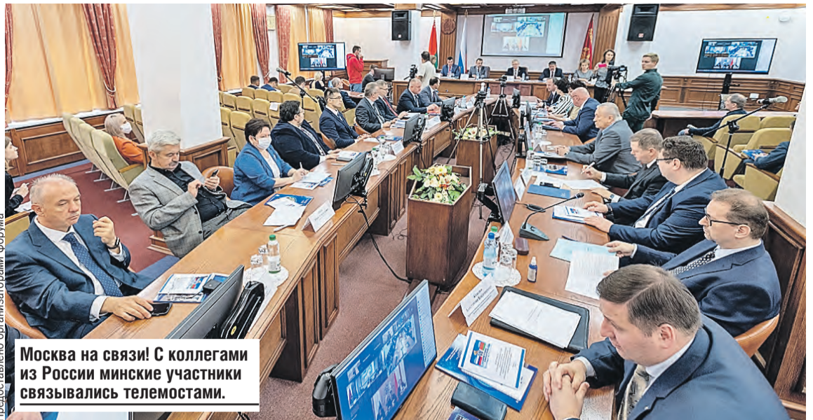
Москва на связи! С коллегами из России минские участники связывались телемостами.

Шла речь и о рекордных контрактах (говорилось о семидесяти соглашениях), которые планировалось подписать на полях форума: сумма колебалась от 700 до 750 миллионов долларов. Самый крупный – на тридцать миллионов – между комплексом «Могилевхимволокно» и российским предприятием «Авангард».