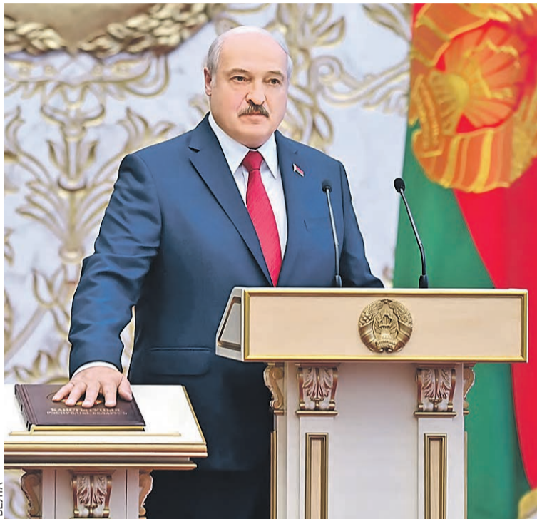
Александр Лукашенко дает Присягу, положив правую руку на Конституцию.

– Беспрецедентное внешнее давление только закалило