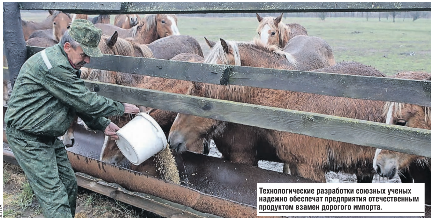
Технологические разработки союзных ученых надежно обеспечат предприятия отечественным продуктом взамен дорогого импорта.

Наша техника при хорошем качестве должна превалировать на российско-белорусском рынке повсеместно. И сервис, и запчасти, и страхование, и лизинг – все возможности для этого у нас есть.