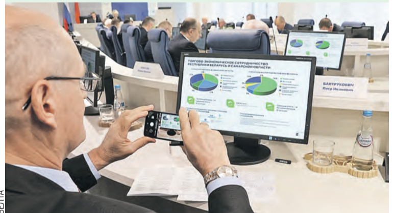
Расстояния и ковидные ограничения не смогли отменить конференцию, на стороне интеграции успешно сыграли технологии.

Свежий пример кооперации – создание в Беларуси предприятия по производству технического углерода в Могилеве. Российские инвестиции – 150 миллионов евро. Из-за пандемии сроки сдвинулись на октябрь – ноябрь.