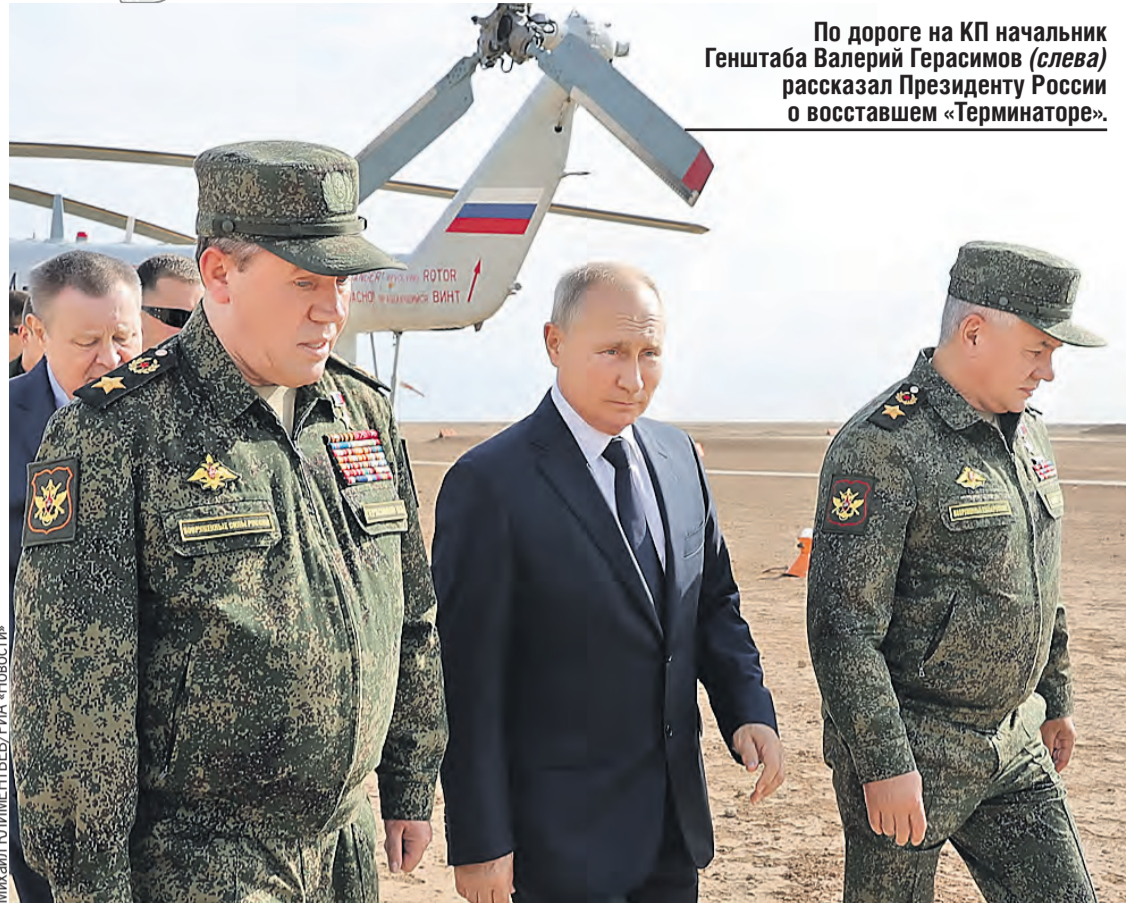
По дороге на КП начальник Генштаба Валерий Герасимов (слева) рассказал Президенту России о восставшем «Терминаторе».