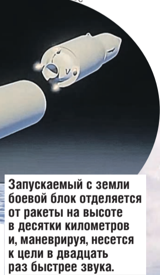
Запускаемый с земли боевой блок отделяется от ракеты на высоте в десятки километров и, маневрируя, несется к цели в двадцать раз быстрее звука.

Что мы у них могли украсть, если красть было нечего в принципе? Американцев просто задело. Создав «Авангард», чья ракета летит в тридцать раз быстрее звука да еще меняет траекторию, Россия сделала гигантский шаг вперед в области военных технологий, оставив всем остальным малоприятную роль догоняющих.