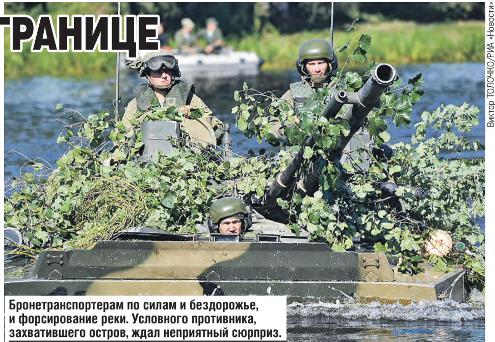
Бронетранспортерам по силам и бездорожье, и форсирование реки. Условного противника, захватившего остров, ждал неприятный сюрприз.

Во втором этапе на сцену военного театра вышли уже военнослужащие Западного оперативного командования, сил специальных операций Вооруженных сил, ВВС и войск ПВО, ракетных войск и артиллерии. Солировали и подразделения двух соединений воздушно-десантных войск ВС