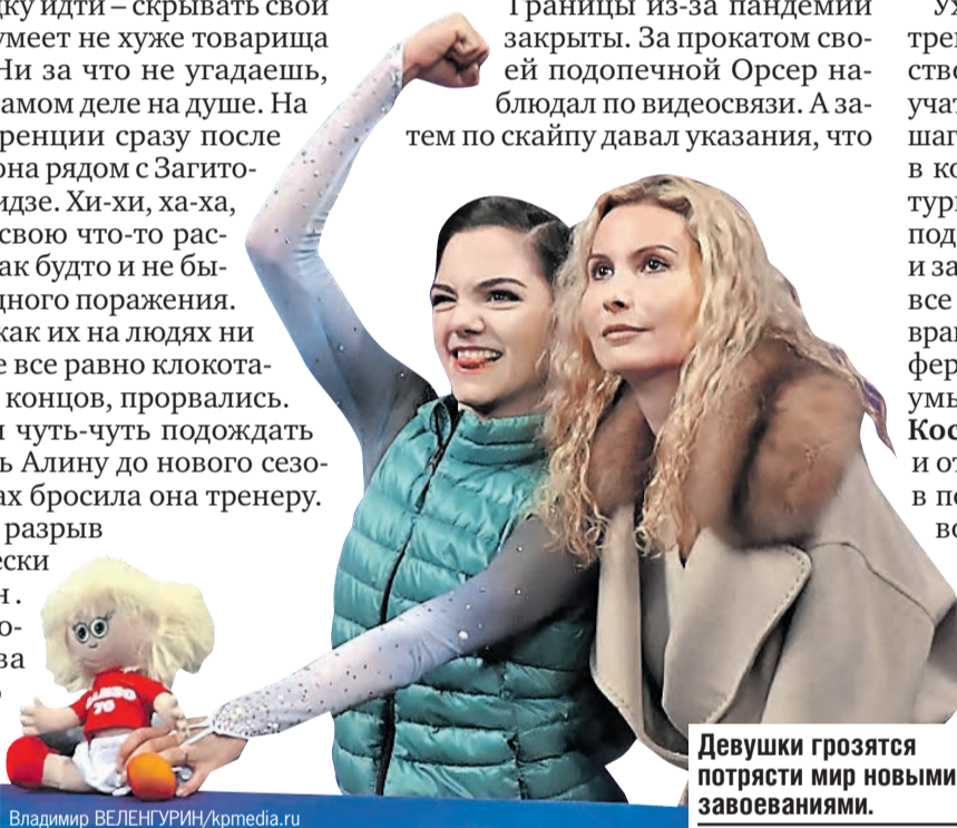
Девушки грозятся потрясти мир новыми завоеваниями.

– Возвращение к Этери Георгиевне – это логичный и верный поступок. Потому что все главные результаты в своей жизни Евгения показала и, надеюсь, покажет еще под руководством именно этого специалиста.