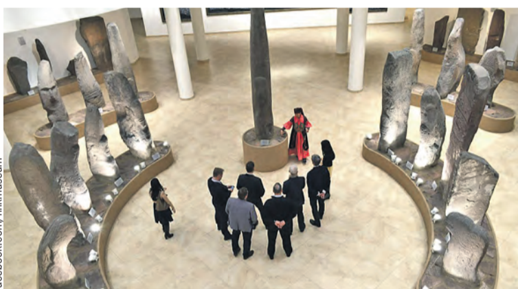
В Хакасском музее о местном Стоунхендже расскажут экскурсоводы в национальных костюмах.

Здесь собрали гигантскую коллекцию артефактов: петроглифы на каменных плитах, трехтысячелетние каменные статуи, ритуальные маски, костяные украшения и орудия с места древнейшей в Сибири стоянки человека Малая Сяя, возраст которой 34 тысячи лет. Более двадцати тысяч археологических находок доказывают, что территория Хакасии – одна из колыбелей человечества.