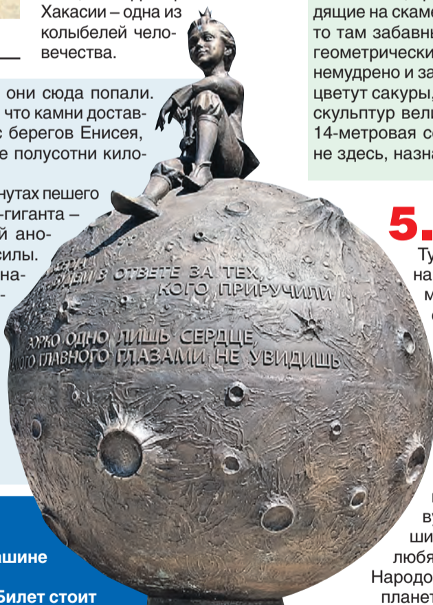
Герой Экзюпери с беспечной улыбкой напомнит о том, что главного глазами не увидишь.

В двадцати минутах пешего хода от кургана-гиганта – зона магнитной аномалии и место силы. Оно тоже обозначено двумя мегалитами. Это Салбыкские ворота, прикоснуться к которым приезжают шаманы и путешественники со всего мира.