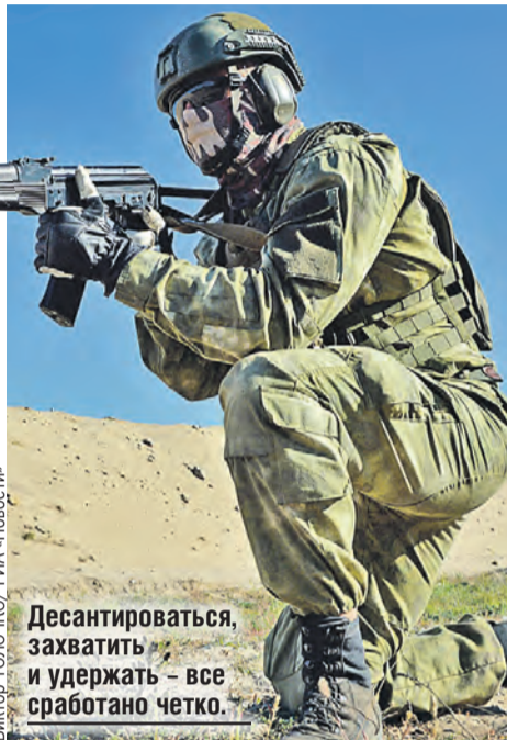
Десантироваться, захватить и удержать – все сработано четко.

Белорусские бойцы десантировались на воду с парашютами системы «крыло», а россияне с вертолетов – посадочным способом и по-штурмовому,