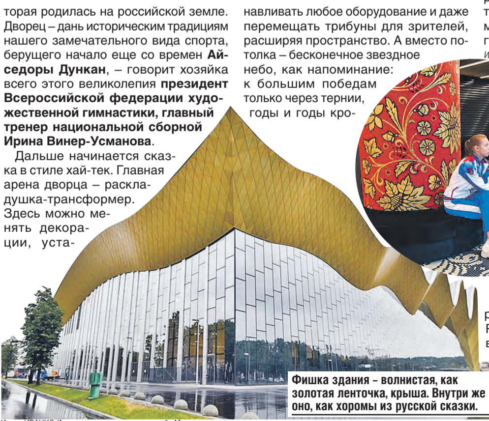
Фишка здания – волнистая, как золотая ленточка, крыша. Внутри же оно, как хоромы из русской сказки.

Дворец уже стал счастливым для россиянок. Под его сводами сборная России готовилась к чемпионату мира в Баку, где выступила блестяще, завоевав восемь золотых медалей из девяти. Нет сомнения, что победная традиция получит свое продолжение и на Олимпийских играх в Токио будущим летом.