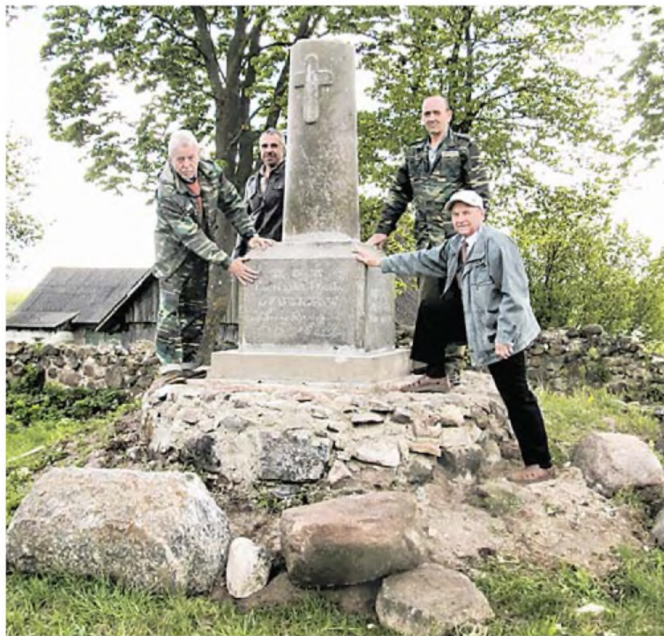
■ Узноўлены помнік у Аборку.