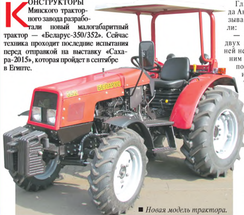
■ Новая модель трактора.

КОНСТРУКТОРЫ Минского тракторного завода разработали новый малогабаритный трактор — «Беларус-350/352». Сейчас техника проходит последние испытания перед отправкой на выставку «Сахара-2015», которая пройдет в сентябре в Египте.