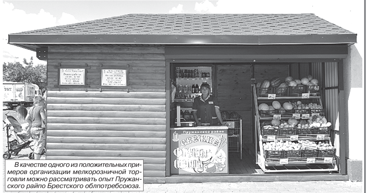
В качестве одного из положительных примеров организации мелкорозничной торговли можно рассматривать опыт Пружанского райпо Брестского облпотребсоюза.