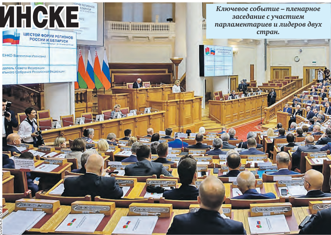
Ключевое событие – пленарное заседание с участием парламентариев и лидеров двух стран.

Пока организация форума – в начале пути, но кое-что уже известно. Оргкомитеты, которые формируют Совет Республики Национального собрания и Совет Федерации, пригласят на очередной съезд регионов более 500 участников. В рамках деловой программы белорусские и российские предприниматели обменяются мнениями о разных направлениях совместной деятельности, обсудят новые проекты. Важный момент – подписание соглашений о сотрудниче-