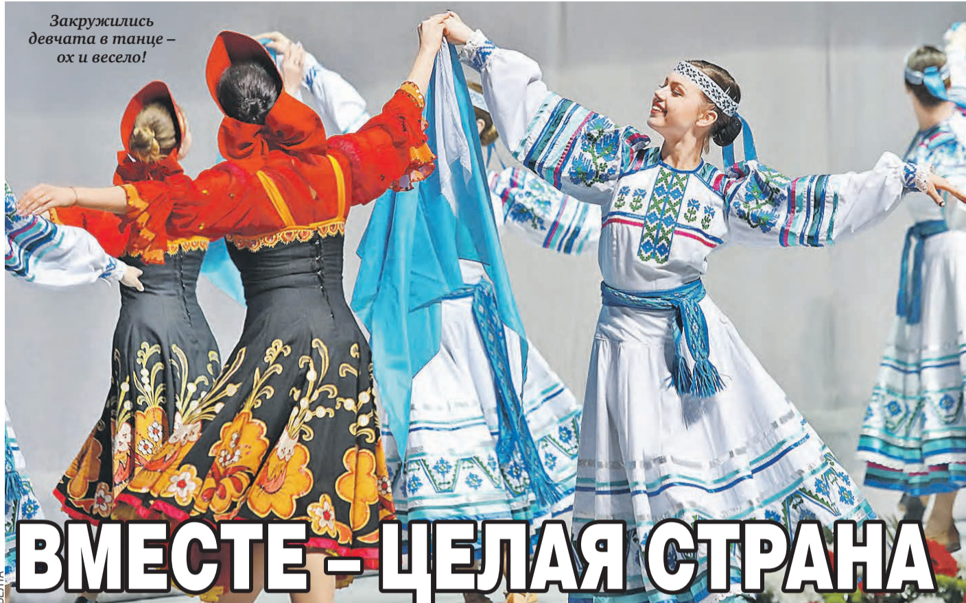
Закружились девчата в танце – ох и весело!

– В российской столице концерты проходили в Малом театре, Театре эстрады, Театре Российской армии, в «Новой опере»! Ведущие – их всегда двое – представляют обе страны. Да и программа составляется таким образом, чтобы на сцене выступали и российские, и белорусские коллективы. Публика всегда с восторгом встречает совместные номера: когда с белорусским коллективом поет российский исполнитель или наоборот, получается соединение талантов двух наших государств.