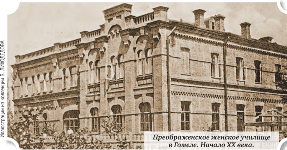
Преображенское женское училище в Гомеле. Начало XX века.

Как указывали авторы статьи, в наших краях существовало тогда главным образом «два рода школ начального народного образования»: одни находились в ведении дирекций