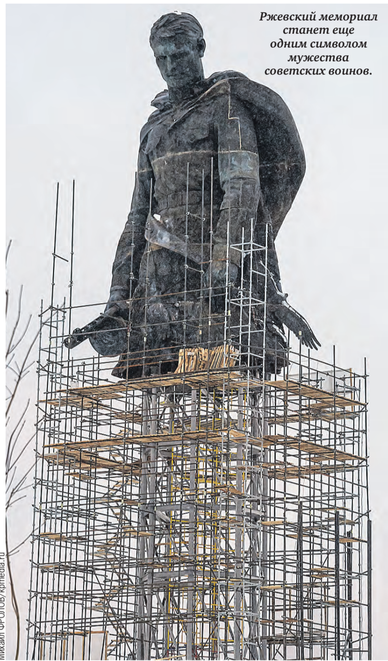
Ржевский мемориал станет еще одним символом мужества советских воинов.

Многие города-побратимы России и Беларуси укрепляли связи не только из экономических соображений, но и чтобы сохранить общее героическое прошлое. Ря-