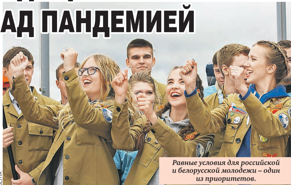
Равные условия для российской и белорусской молодежи – один из приоритетов.