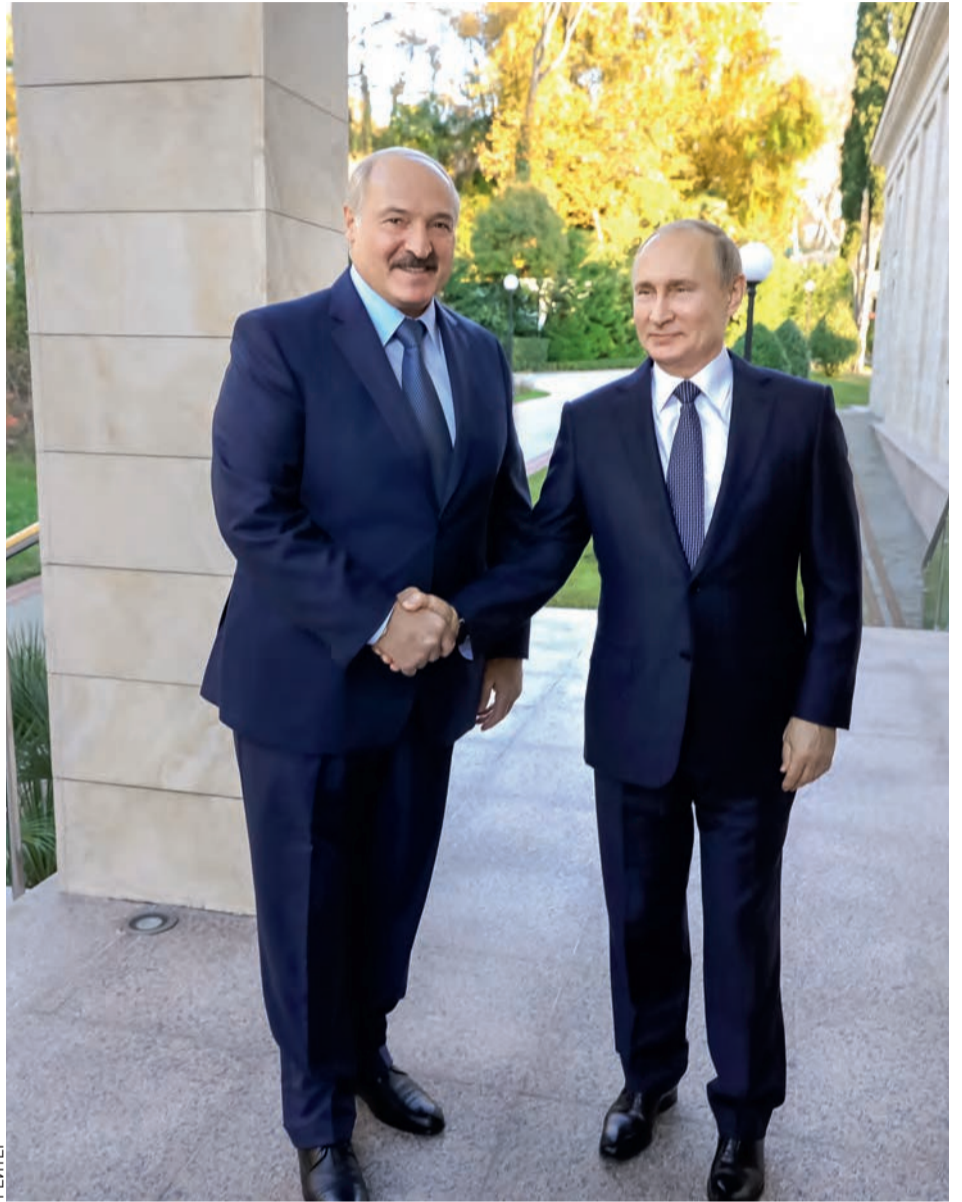
К единому мнению лидеры наших стран приходят по большинству вопросов.

● В рамках Союзного государства осуществляется несколько десятков отраслевых программ. Особый упор делается на создание передовой наукоемкой продукции, стимулирование российского и белорусского бизнеса к более энергичному внедрению инноваций в реальный сектор экономики.