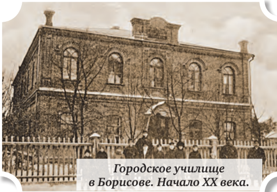
Городское училище в Борисове. Начало XX века.