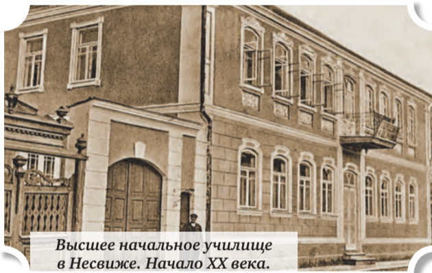
Высшее начальное училище в Несвиже. Начало XX века.