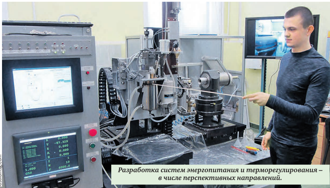
Разработка систем энергопитания и терморегулирования – в числе перспективных направлений.