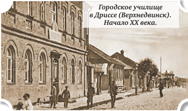
Городское училище в Дриссе (Верхнедвинск). Начало XX века.