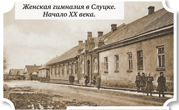
Женская гимназия в Слуцке. Начало XX века.