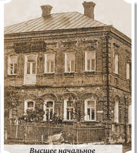
Высшее начальное четырёхклассное училище в Яновичах. Начало XX века.

В 1899 году неграмотных новобранцев ко всему числу принятых в армейские ряды в Витебской губернии было 57,44 процента; в Минской – 59,21 процента; в Могилевской – 54,81 процента. На первый взгляд, все весьма печально. Но если взглянуть на соответствующие цифры за 1874–1887 годы, а это, соответственно, 82,81 процента, 81,03 процента и 85,87 процента, картина сразу меняется и уже не выглядит столь удручающей, так как прогресс налицо.