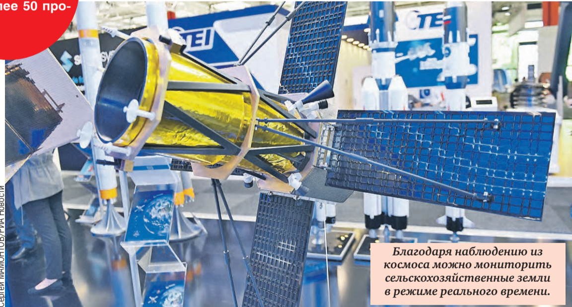
Благодаря наблюдению из космоса можно мониторить сельскохозяйственные земли в режиме реального времени.

ТОЛЬКО ЦИФРЫ За 20 лет реализовано более 50 программ.