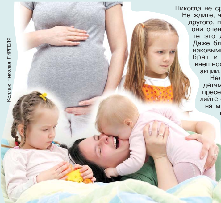
Коллаж: Николай ГИРГЕЛЯ

– Ребенок о появлении нового члена семьи должен узнавать не по факту, а задолго до этого, ему так легче привыкнуть. Ему можно давать поглаживать живот (но не заставлять, если не хочет), вместе рассмат-