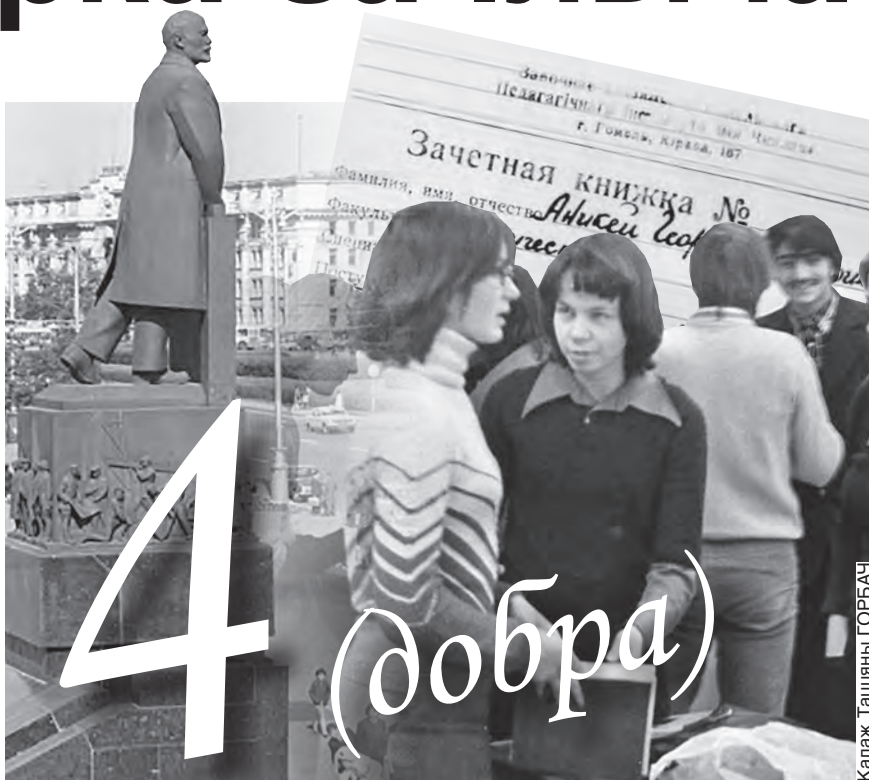
Коллаж Тат'яны ГОРБАЧ

Вывялася, што, выдатна справіўшыся з усімі пытаннямі білета, дзяўчына не змагла адказаць экзаменатару, у якой позе стаіць таварыш Ленін на плошчы Леніна ў Мінску. Я таксама не ведаў, у якой позе стаіць Ленін на той злашчаснай плошчы, што носіць яго імя, бо