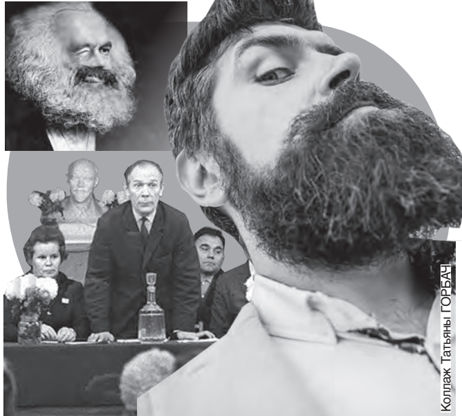
Коллаж Тат'яны ГОРБАЧ

Але ўсё ж такі вырашыў рызыкнуць: надта ж прыспычыла, барада расла ў мяне прыгожая, густая і вельмі пасавала. І чаму не? Вунь колькі камуністычных лідараў фарсілі бародамі, чаму б і мне не паспрабаваць, угаворваў я сябе. Тым больш што тады я ўжо бесперашкодна насіў вузенькія кароценькія вусікі, якія таксама былі ідэалагічна варожыя сацыялістычнаму грамадству, бо мода на іх пайшла не адкуль-небудзь, а, на жаль, ад замежных артыстаў, фільмы з удзелам якіх калі-нікалі паказвалі ў кінатэатрах, каб савецкі грамадзянін меў магчымасць параўноўваць сваё бязмернае шчасце з вялікім горам прыгнечанага людю на жорсткім капіталістычным Захадзе. Але пераймаць тагачасную заходнюю моду –