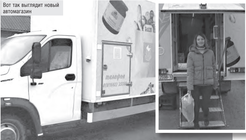
Вот так выглядит новый автомагазин

В 40 деревень Кобринского района, где по разным причинам нет стационарных магазинов, заезжают по графику и с богатым ассортиментом продуктов пять автолавок. С января в их числе появился принципиально новый современный автомагазин.