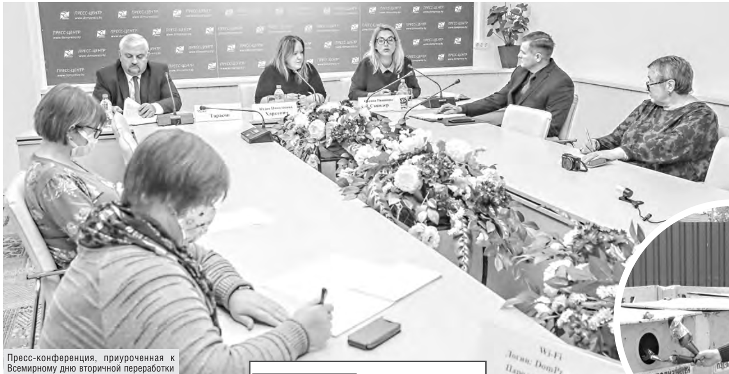
Пресс-конференция, приуроченная к Всемирному дню вторичной переработки

Кооператоры увеличивают заготовку сырья, пригодного для переработки