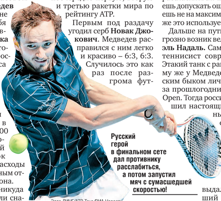
Русский герой в финальном сете дал противнику расслабиться, а потом запустил мяч с сумасшедшей скоростью!

В первые минуты победитель был немного растерян. Обычно триумфатору аплодируют переполненные трибуны, перед которыми он совершает круг почета. А тут – глухая тишина. Пустой зал: только судья на вышке, пара тренеров на трибуне да стайка ребятшек бол-боев. Вот и вся аудитория. Коронавирус, будь он не ладен. Но вкус победы даже так сладок!