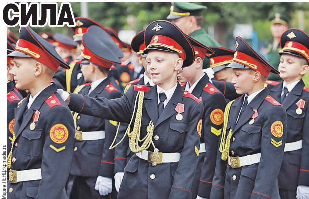
Обучаться вместе со школьной скамьи сперва предстоит кадетам. Для них уже готовят единую программу.

В середине декабря пройдет совместное заседание коллегий мини-