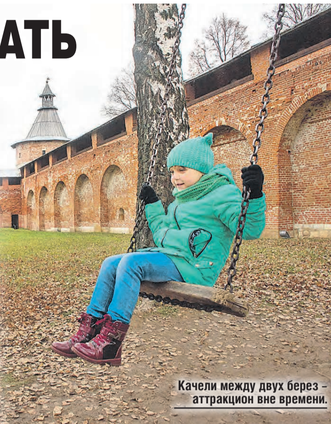
Качели между двух берез – аттракцион вне времени.

В хорошую погоду вам могут позволить забраться на стены. Отсюда открывается красивый вид на реку Осетр и окрестности. Летом в Зарайском кремле частенько собираются реконструкторы.