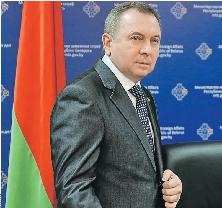
Дипломат надеется, что выстраивать новые берлинские стены в отношениях Евросоюз не будет.

И на совещании у Президента было сказано о том, что принцип многовекторности сохраняется. Хочу это подтвердить. Но это не означает, что мы будем со всеми дружить в равной мере. Просто идет расстановка сил, и мы должны