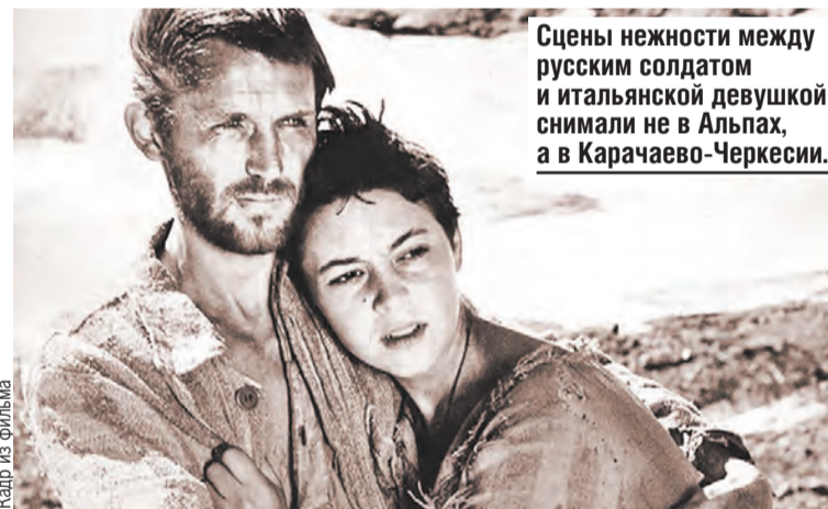
Сцены нежности между русским солдатом и итальянской девушкой снимали не в Альпах, а в Карачаево-Черкесии.

– Только по молодости можно настолько недооценивать