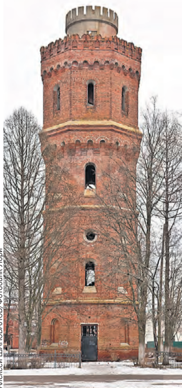
Со смотровой площадки на старой водонапорной башне – лучший вид.

Зарайск, особенно в центре, малозатянутый. А самое высокое здание в городе – столетняя водонапорная башня. Во многих городах они, отслужившие свой век, стоят и разрушаются. А тут башню отреставрировали, облагородили территорию вокруг и получили туристический объект. Самый заметный, надо признать, – 29 метров высотой, как современная девятиэтажка. Напоминает чем-то Каменецкую башню в Брестской области. Четыре яруса, на каждом из которых можно проводить выставки. По пути на самый верх установлен старый резервуар для воды, как напоминание о прошлой жизни. Можно подняться и на крышу. Там устроена смотровая площадка – идеальная точка притяжения для любителей селфи. А ночью башня подсвечивается, словно маяк.