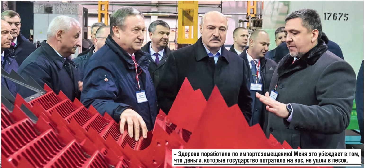
– Здорово поработали по импортозамещению! Меня это убеждает в том, что деньги, которые государство потратило на вас, не ушли в песок.

рились недавно с россиянами, что миллиард долларов мы им в этом году не платим (они отложили наши долги). Пятьсот миллионов долларов мы у них заимствовали через Евразийский банк. Я думал, поддержим машиностроение и прочее. А ничего подобного. Все пятьсот миллионов я пока держу и финансирую лечение людей от ковида. Здоровье людей – главное, и никуда от этого не денешься. Поэтому где-то надо потерпеть, сжав зубы, – уж очень непростой будет следующий год.