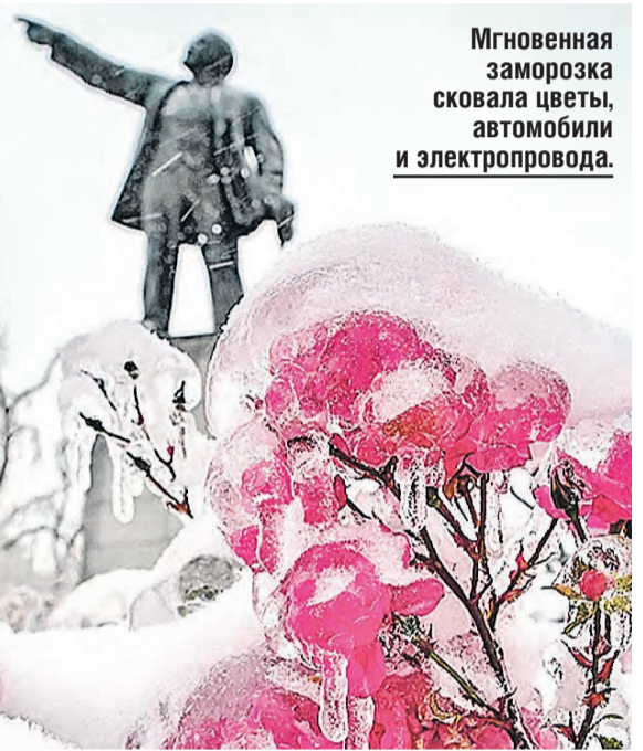
Мгновенная заморозка сковала цветы, автомобили и электропровода.