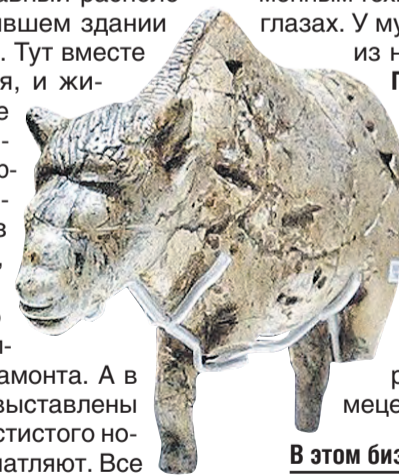
В этом бизоне есть частичка... мамонта. twitter.com/museyzarkrem

В городе на 20 тысяч населения музеев больше, чем в некоторых областных центрах. Главный расположен в кремле – в бывшем здании присутственных мест. Тут вместе собрались и история, и живопись, и прикладное искусство. Самые ценные экспонаты – фигурки бизона и двух женщин. Привет нам из ледникового периода, только не киношного, а настоящего. Им по 22 тысячи лет, и выполнены они из бивня мамонта. А в отдельных витринах выставлены кости мамонта и шерстистого носорога. Размеры впечатляют. Все