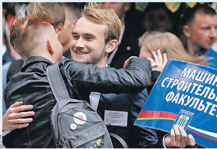
Благодаря новейшей технике студенты станут высококлассными специалистами.

– Ситуация, при которой на 400 мест, финансируемых из бюджета Союзного государства для россиян, приходится всего 70 студентов, нас удовлетворить не может, – считает российский сенатор.