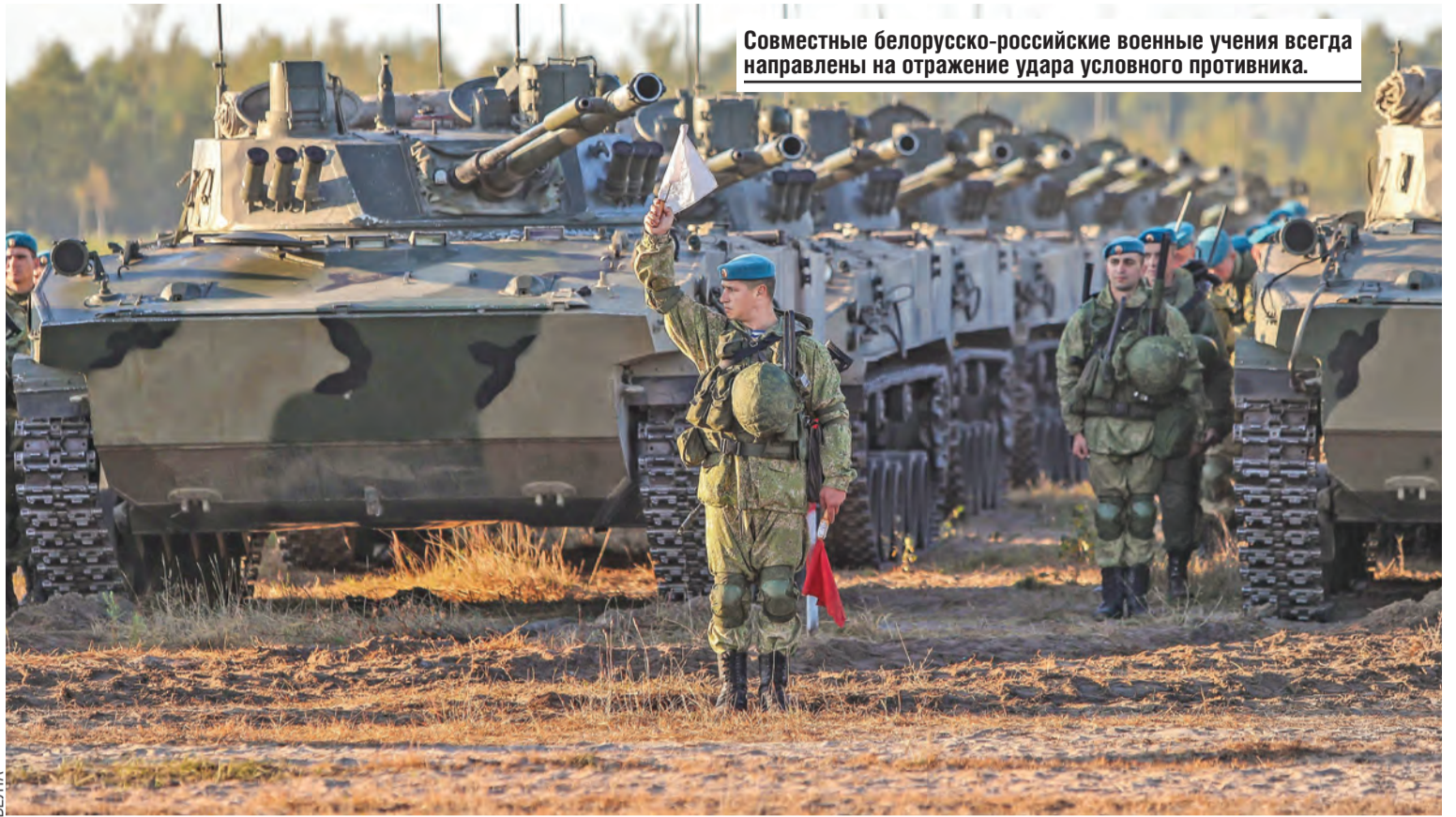
Совместные белорусско-российские военные учения всегда направлены на отражение удара условного противника.

Мы звали на сегодняшнюю встречу нескольких человек, которые, скажем так, помахивают им приветственно из окна по меньшей мере. Приходите, поговорим, вы-