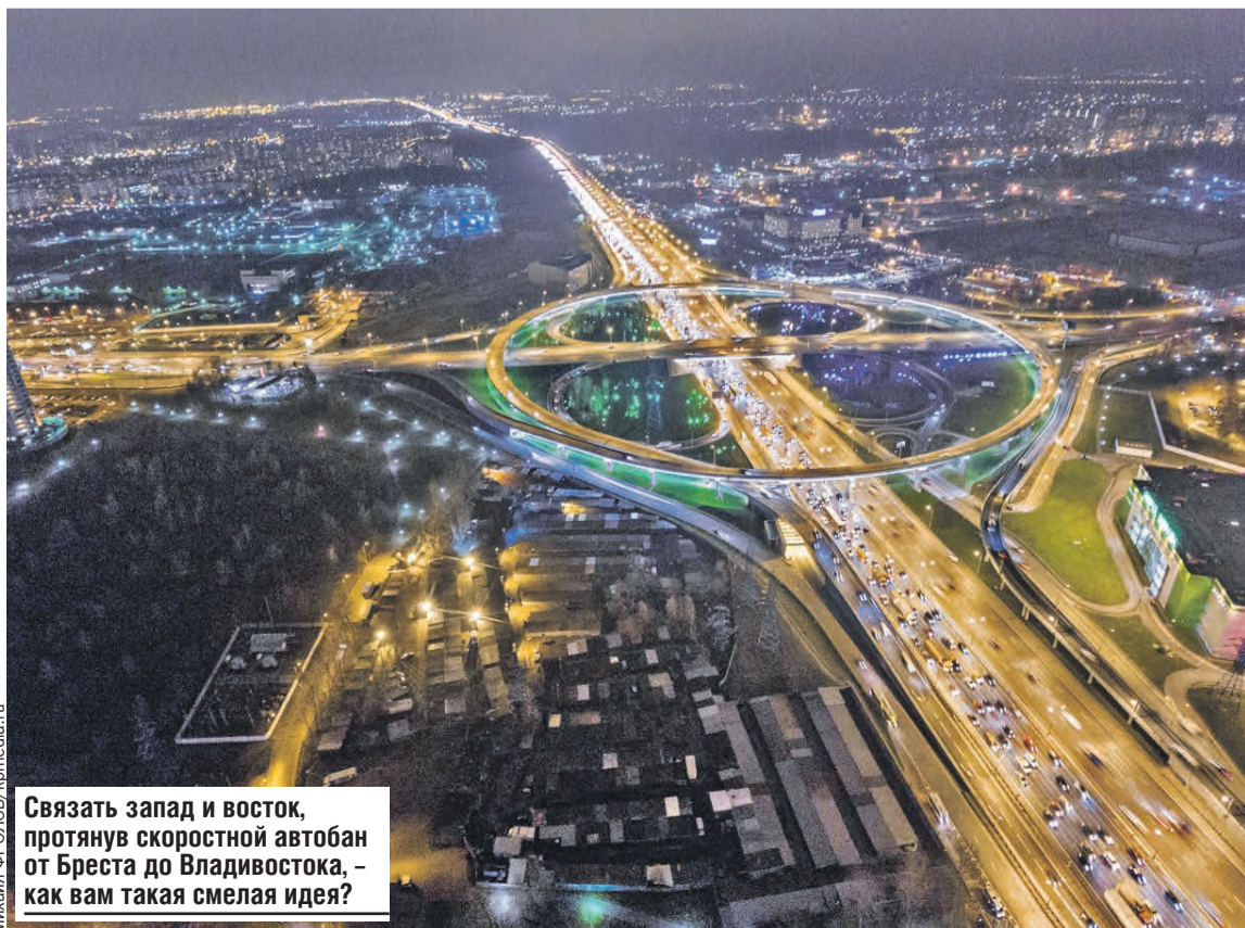
Связать запад и восток, протянув скоростной автобан от Бреста до Владивостока, – как вам такая смелая идея?