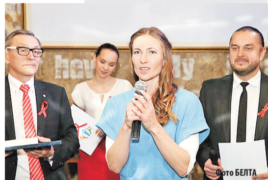
Дарья ДОМРАЧЕВА участвует в национальной акции, приуроченной к Международному дню памяти умерших от СПИДа.

Экспертный совет Информационной стратегии по ВИЧ/СПИДу в Беларуси впервые вручал благодарности тем,