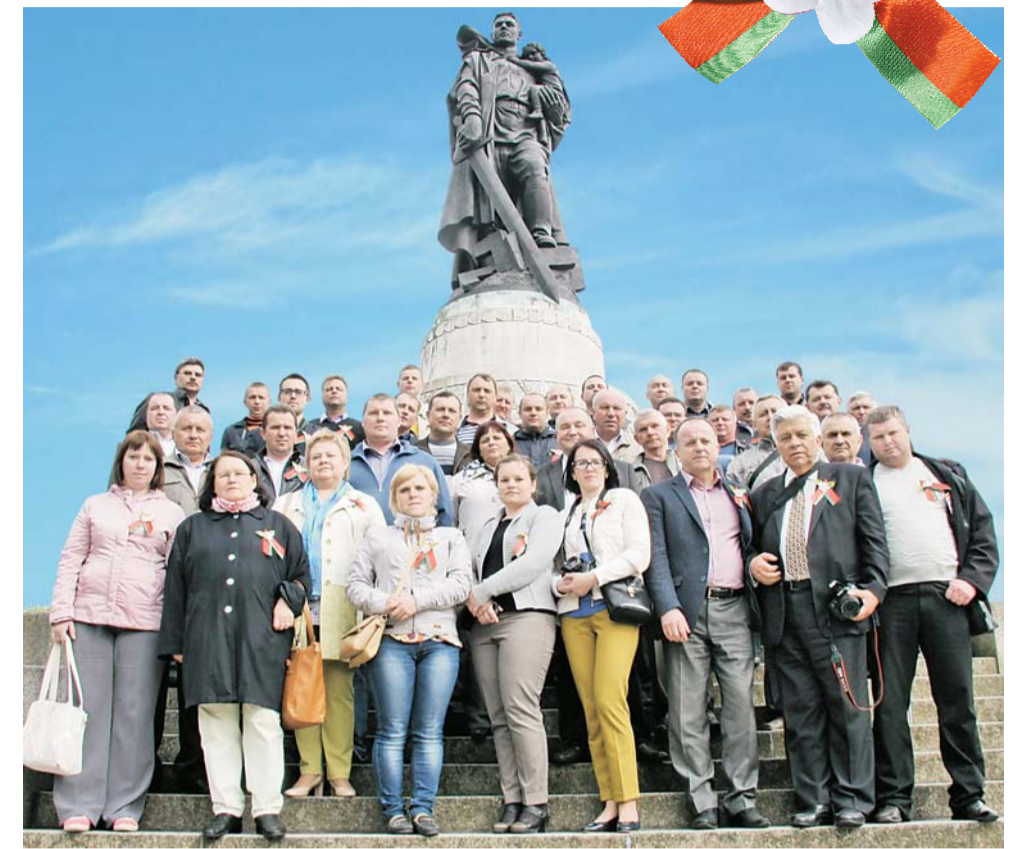
После возложения цветов в Трептов-парке.