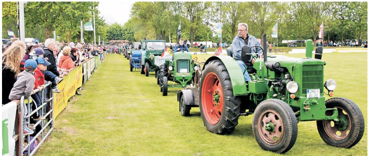
Парад ретро-тракторов на выставке.