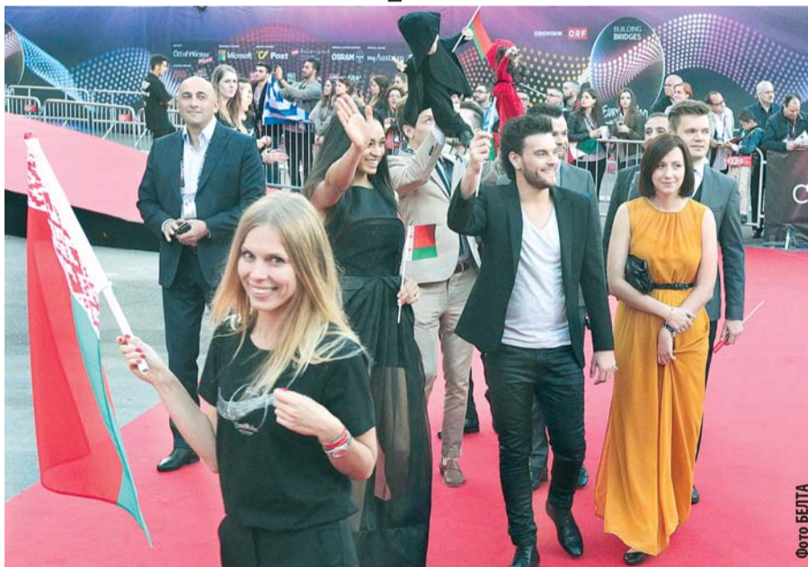
Белорусская делегация во время открытия «Евровидения-2015»