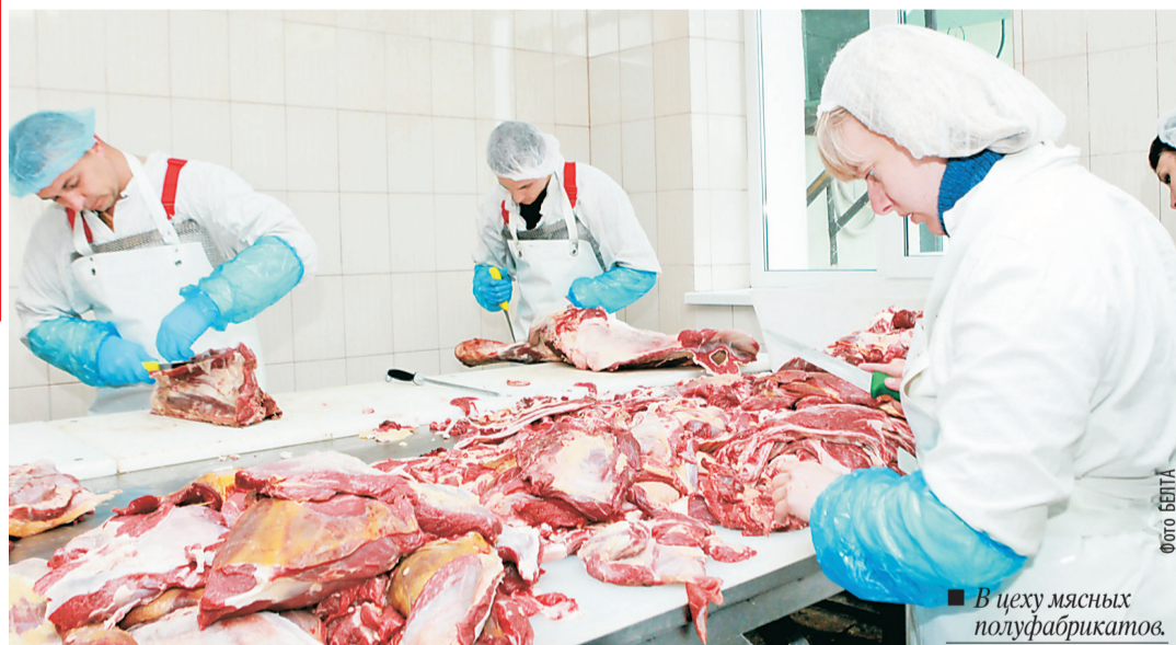
В цеху мясных полуфабрикатов

Ф ИЛИАЛ Пружанского районного потребительского общества — комбинат кооперативной промышленности — произвел первые экспортные поставки продукции на российский рынок. В апреле предприятие вошло в реестр Таможенного союза, что открыло перед ним новый рынок. На днях первые тонны мясных полуфабрикатов отправлены потребителям Москвы и Тюмени. Предварительно на предприятии обновили ма-