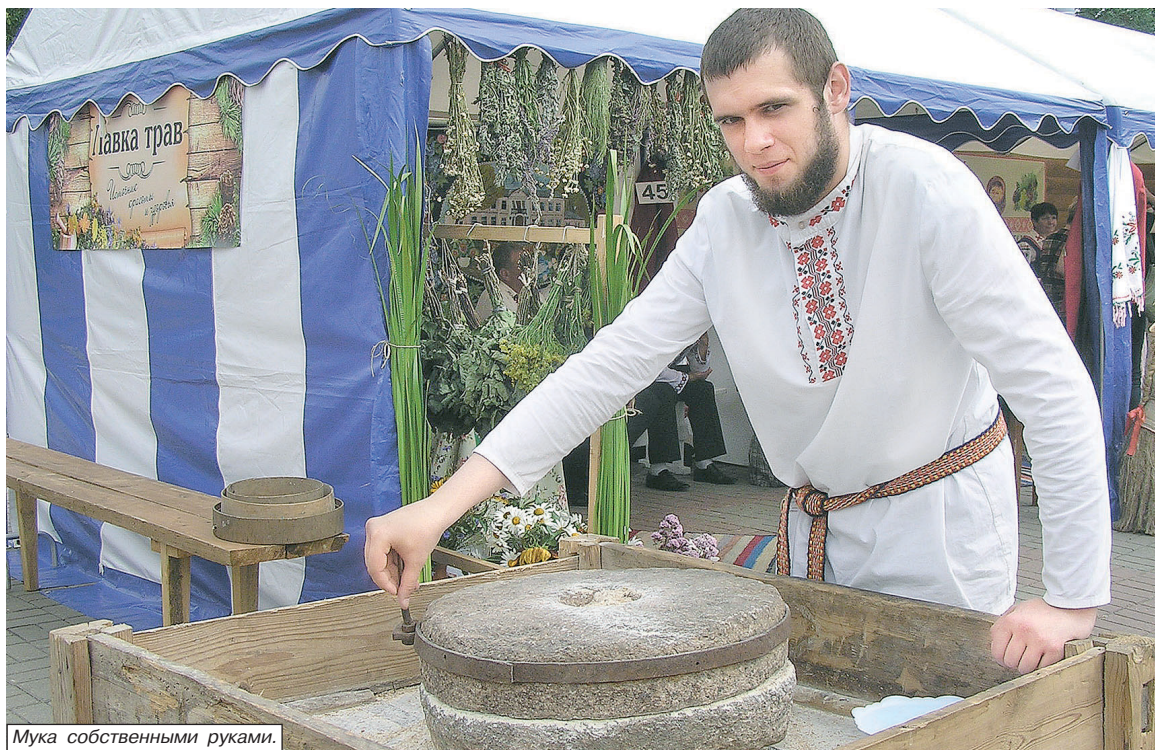
Мука собственными руками.

ВОЗМОЖНОСТИ ЕСТЬ! О ЧЕМ ГОВОРИЛИ КООПЕРАТОРЫ НА БОЛЬШОМ СОВЕЩАНИИ?