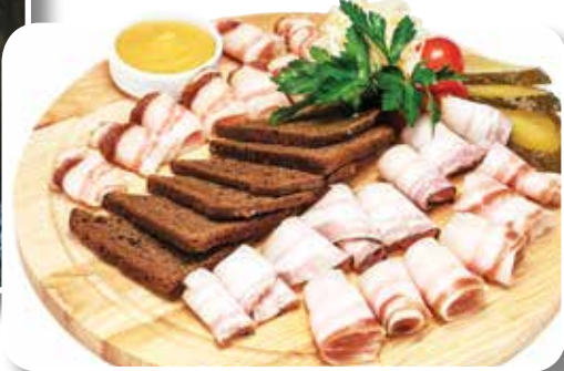
● закуска «Селянская» – 3,39 рубля