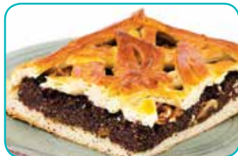
● пирог с маком (1 кг) – 9,99 рубля