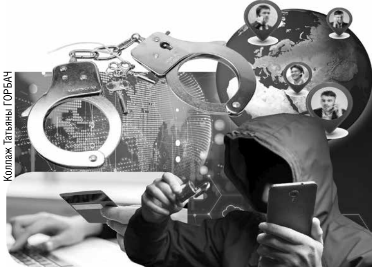
Коллаж Татьяны ГОРБАЧ

Хотя сначала товарищ создавал иллюзию надежного заемщика. Брал деньги под высокие проценты на короткий срок и возвращал вовремя. Репутация вскоре позволила получать крупные суммы без расписки. Но гасить долги