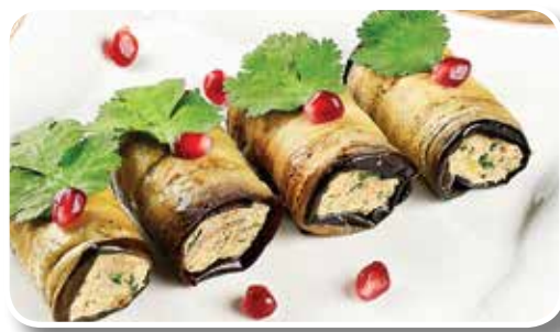
● баклажаны, фаршированные орехами – 2,99 рубля