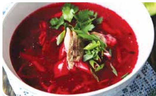
● борщ холодный мясной – 1,99 рубля