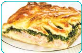
● пирог с лососем и шпинатом (1 кг) – 14,99 рубля