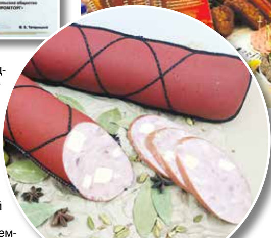
Лауреат конкурса «Лучшие товары Республики Беларусь» – варено-копченая колбаса «Пармская с сыром»

Активно пополняем линейку «Здоровое питание»: в 2019 году освоили выпуск вареных колбас с пониженным содержанием соли («Прима эконом» сорта экстра), а также копченостей в вакуумной упаковке.