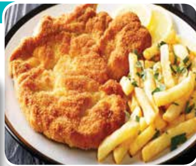
● котлета «Крыничная» с картофелем жареным – 3,79 рубля