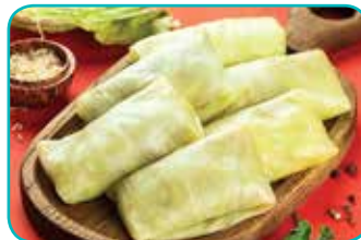
● голубцы «Любительские» (п/ф, 1 кг) – 6,59 рубля

В кафе, ресторанах, объектах придорожного сервиса потребительской кооперации по акции будут продаваться