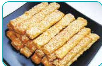
● печенье «Желточная палочка» (1 кг) – 6,99 рубля

В июне в магазинах, кулинариях, универсамах, кафетериях, буфетах пройдет акция по реализации кондитерских изделий и полуфабрикатов: