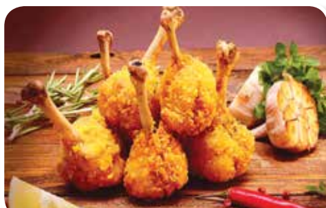
● «Лapки дракона» – 2,79 рубля