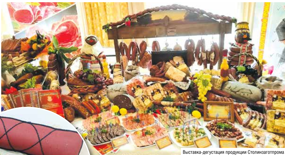
Выставка-дегустиация продукции Столинзаготпрома

Еще в 2017 году филиал получил сертификат соответствия требованиям СТБ 1470–2012: система управления безопасностью обеспечивает контроль на всех этапах и в любой точке процессов производства, хранения, транспортировки и реализации продукции.