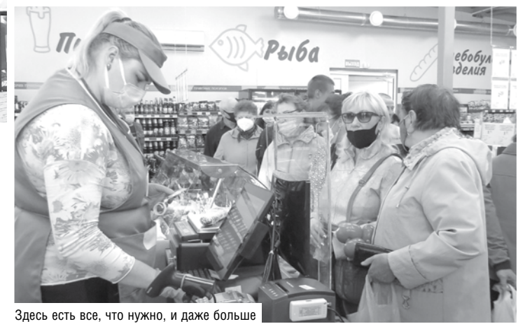
Здесь есть все, что нужно, и даже больше