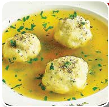
● бульон с колдунами – 1,29 рубля