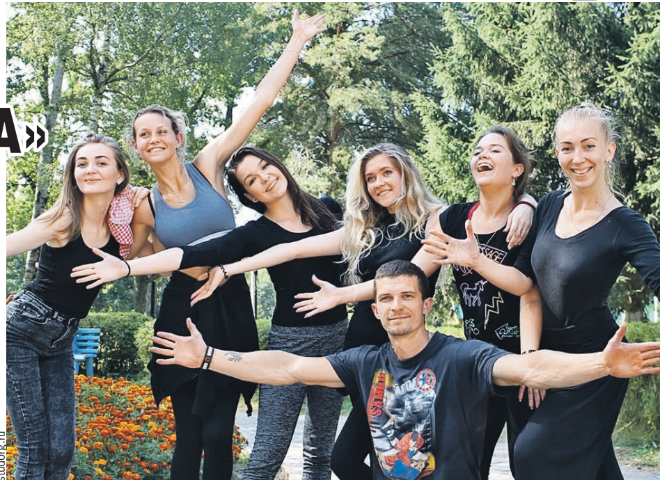
Юные, красивые и задорные! Парни и девушки наших стран открыты для свежих идей.

В прошлом году в Смоленске отметили десятилетие международного волонтерского лагеря «Надежда» на базе детского реабилитационного центра для инвалидов «Вишенки». Сюда приезжают волонтеры со всего мира, были даже трое англичан в возрасте за шестьдесят, которые помогают во всем: от игры на гитаре