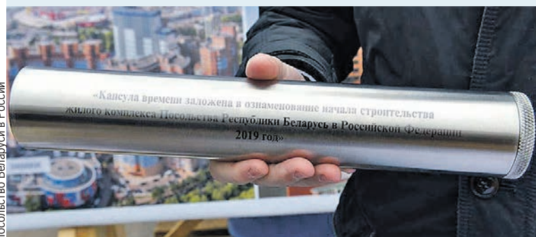
Посольство Беларуси в России Фундамент «укрепили» капсулой с обращением к потомкам.

Жилье возводится в одном из самых экологически чистых районов Москвы – на границе с Национальным парком «Лосиный остров», где во время прогулки запросто можно встретить живого сохатого. И это – в Москве! Будущим жильцам можно только позавидовать. Проект предусматривает строительство 21-этажного дома с физкультурно-оздоровительным комплексом, подземным и наземным паркингом. Стройку планируют закончить к концу 2020 года.