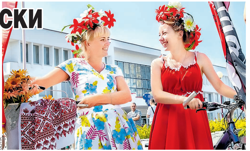
В венках и на шпильках – девчонки-красотки, возможно, вновь прокатятся по улицам во время традиционного велопарада.

Основательно подготовился к празднику Брестский областной краеведческий музей. Там придумали проект «12 артефактов». Каждый месяц целый год будут выставлять экспонат,