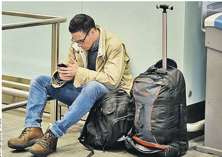
Теперь перед отпуском нужно проверять не только билеты и документы, но и информацию на сайте приставов.

Таким образом, ни один из 2,7 миллиона россиян-долж-