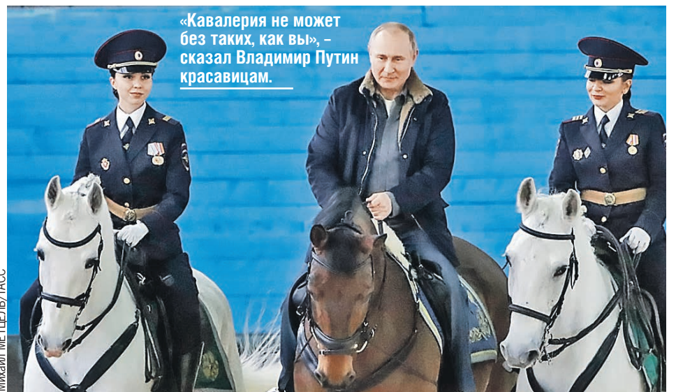
«Кавалерия не может быть без таких, как вы», – сказал Владимир Путин красавицам.

В прошлом году в стране появилось более двух тысяч километров трубопроводов, газифицировано 272 населенных пункта и более 49 тысяч домов, построено 210 котельных.