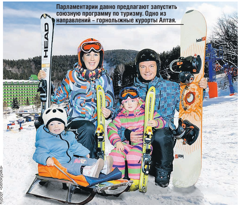
Парламентарии давно предлагают запустить союзную программу по туризму. Одно из направлений – горнолыжные курорты Алтая.

– Аграрии края тратят более 5,5 миллиарда российских рублей в год на техническое перевооружение отрасли. Сегодня агропарк насчитывает порядка 23 тысяч тракторов, 9 тысяч зерноуборочных комбайнов, 800 са-