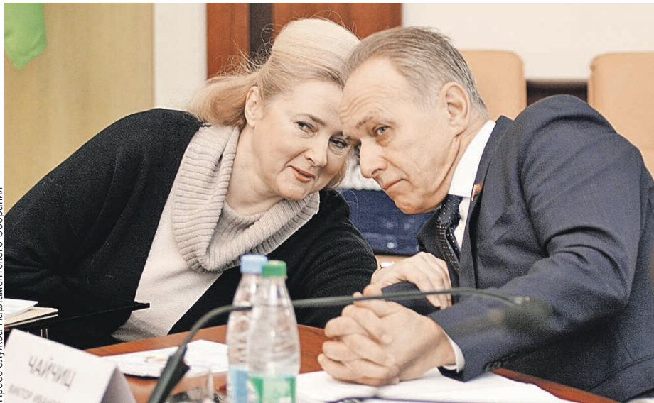
Пресс-служба Парламентского Собрания

Дискуссии на заседаниях бывают эмоциональными. Но именно это помогает депутатам формировать общий взгляд на проблему.