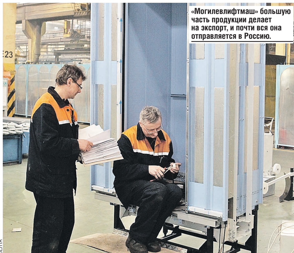
«Могилевлифтмаш» большую часть продукции делает на экспорт, и почти вся она отправляется в Россию.