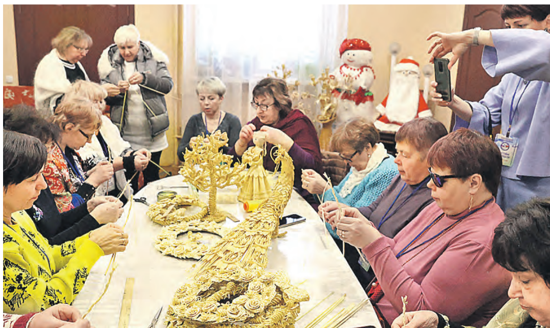
Мастера с особенностями здоровья создают необычные и оригинальные сувениры – хоть на выставку отправляй.

Фестиваль берет под свое крыло Комиссия Парламентского Собрании по труду, социальной политике и здравоохранению.