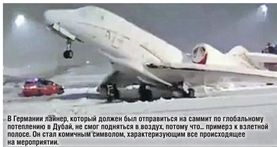
В Германии лайнер, который должен был отправиться на саммит по глобальному потеплению в Дубай, не смог подняться в воздух, потому что... примерз к взлетной полосе. Он стал комичным символом, характеризующим все происходящее на мероприятии.

Под конец выступления белорусский лидер внес конкретные предложения: