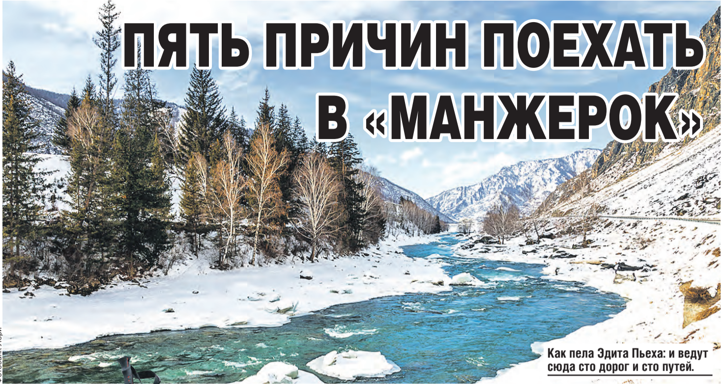
Как пела Эдита Пьеха: и ведут сюда сто дорог и сто путей.