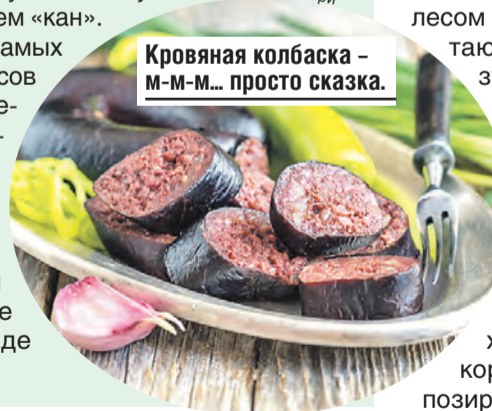
Кровяная колбаска – м-м-м... просто сказка.

Есть и варианты размещения попроще – трехзвездочный отель и небольшие гостевые дома. Везде очень атмосферно!