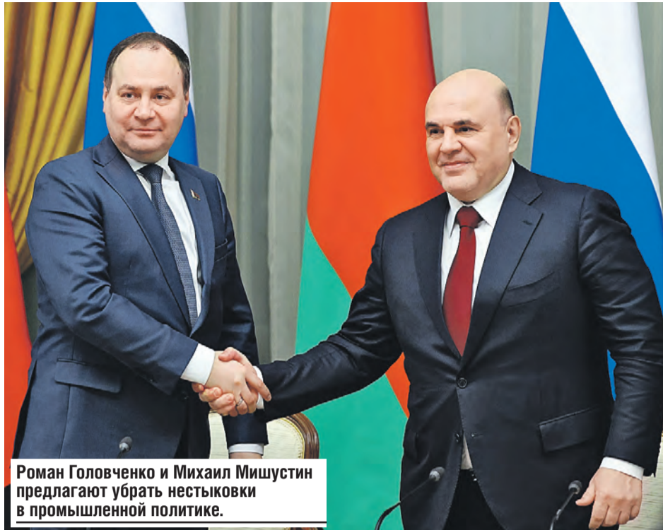
Роман Головченко и Михаил Мишустин предлагают убрать нестыковки в промышленной политике.

– Очень содержательно прописаны не только экономика, не только