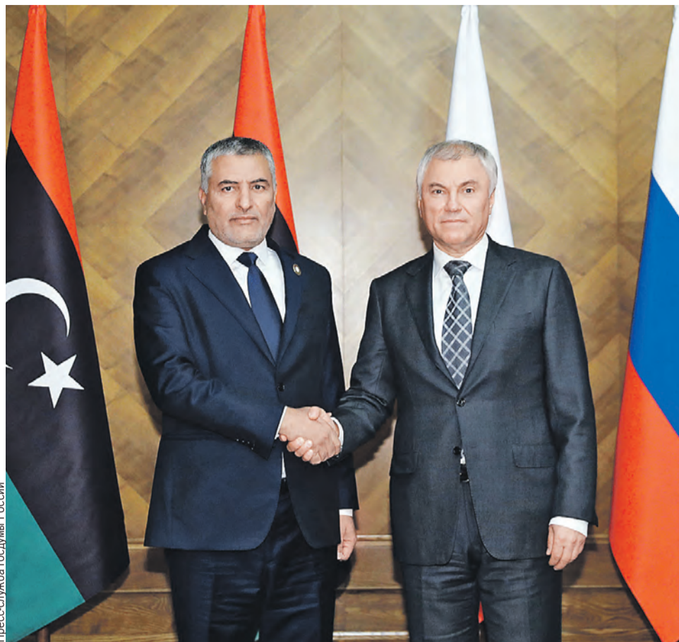
У России и Ливии – большой потенциал. Вячеслав Володин и Мухаммед Такала договорились выстраивать конструктивные отношения между законодателями стран.

✓ 7,3 миллиона домохозяйств остались без продуктов питания и других предметов первой необходимости в последние шесть месяцев.