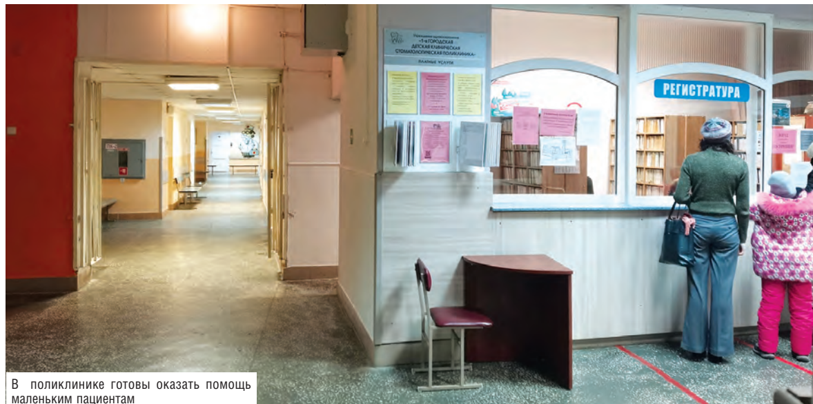
В поликлинике готовы оказать помощь маленьким пациентам

Беседовала Диана ВОЛЬСКАЯ