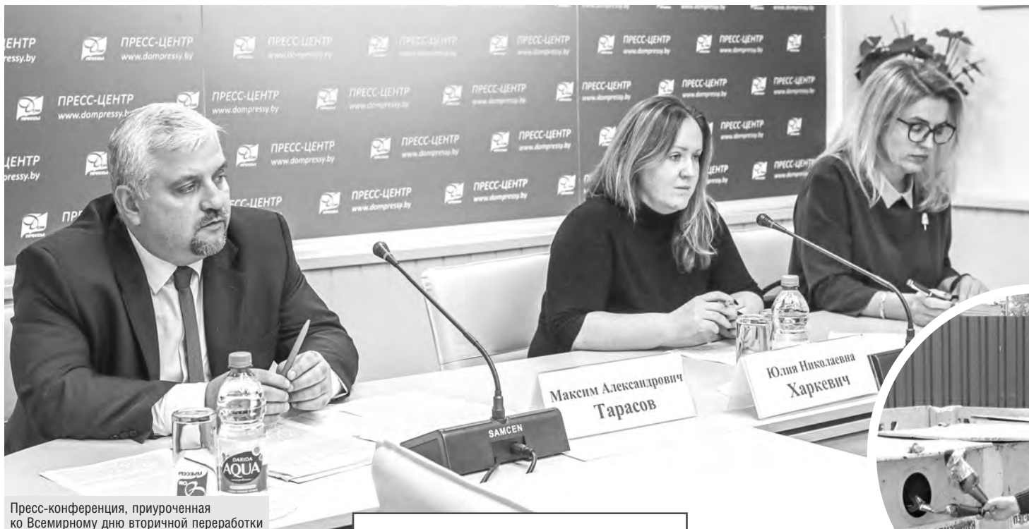
Пресс-конференция, приуроченная ко Всемирному дню вторичной переработки

Кооператоры увеличивают заготовку сырья, пригодного для переработки