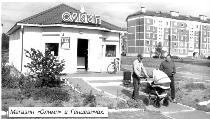
Магазин «Олимп» в Ганцевичах.

сложившейся реальности. Во всяком случае, на примере Ганцевичского района можно достоверно убедиться в том, что местное потребиооперационное общество не уступает своим конкурентам и обеспечивает высокие стандарты торгового обслуживания населения. Причем стандарты эти действуют как в самом райцентре, так и в сельских населенных пунктах.