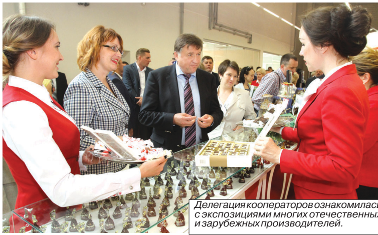
Делегация кооператоров ознакомилась с экспозициями многих отечественных и зарубежных производителей.