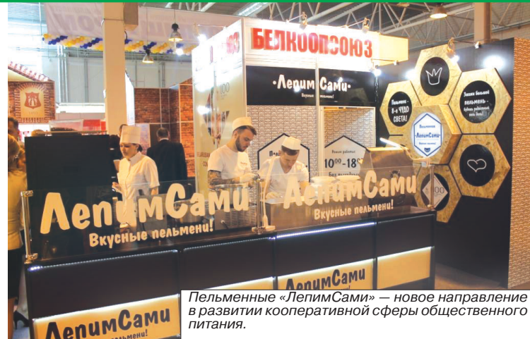
Пельменные «ЛепимСами» — новое направление в развитии кооперативной сферы общественного питания.

Интерес этот вполне оправдан: дизайн-центр УП «Белкоопвнешторг Белкоопсоюза» — ведущий производитель меховых изделий в Беларуси, его коллекции под брендом GNL регулярно получают высокие оценки на