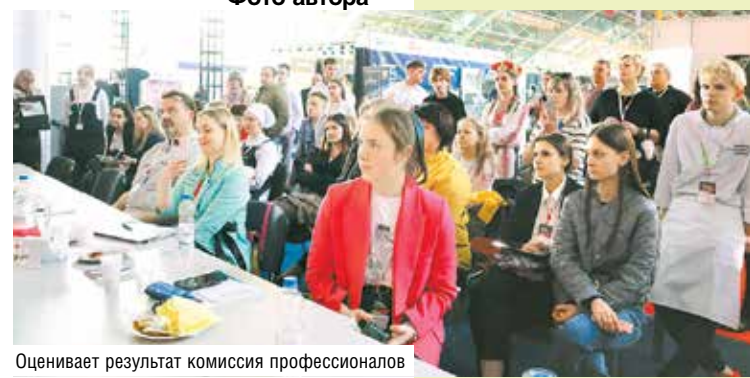
Оценивает результат комиссия профессионалов

Международная выставка HoReCa. RetailTech – важнейший инструмент развития и продвижения ретейла, индустрии общественного питания, отельного и туристического бизнеса в Беларуси. Лидеры рынка демонстрируют новейшее оборудование, продукцию, решения и услуги, презентуют новые концепты и предложения, обсуждают перспективы и тенденции в ресторанно-гостиничной индустрии.