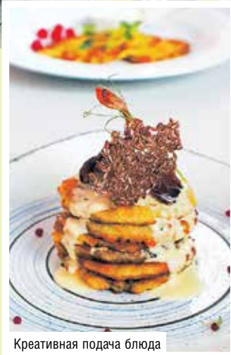
Креативная подача блюда

Международная выставка HoReCa. RetailTech – важнейший инструмент развития и продвижения ретейла, индустрии общественного питания, отельного и туристического бизнеса в Беларуси. Лидеры рынка демонстрируют новейшее оборудование, продукцию, решения и услуги, презентуют новые концепты и предложения, обсуждают перспективы и тенденции в ресторанно-гостиничной индустрии.