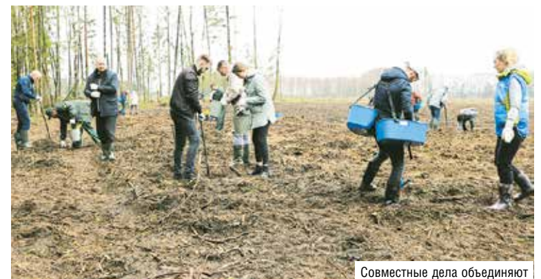
Совместные дела объединяют

Почаствовать в акции по посадке леса на Минщине могут все желающие. Для этого необходимо обратиться в ближайший лесхоз или лесничество, где определят место приложения труда, выдадут необходимый инвентарь и посадочный материал. Помощники также могут внести посильный вклад в наведение порядка в местах захоронения воинов, погибших в годы Великой Отечественной войны, благоустроить мемориальные комплексы.