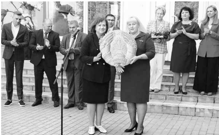
Подарок от областной профсоюзной организации Гродненскому колледжу экономики и управления Белкоопсоюза к 1 сентября

Дали 136 консультаций по правовым вопросам, провели семь встреч в коллективах.