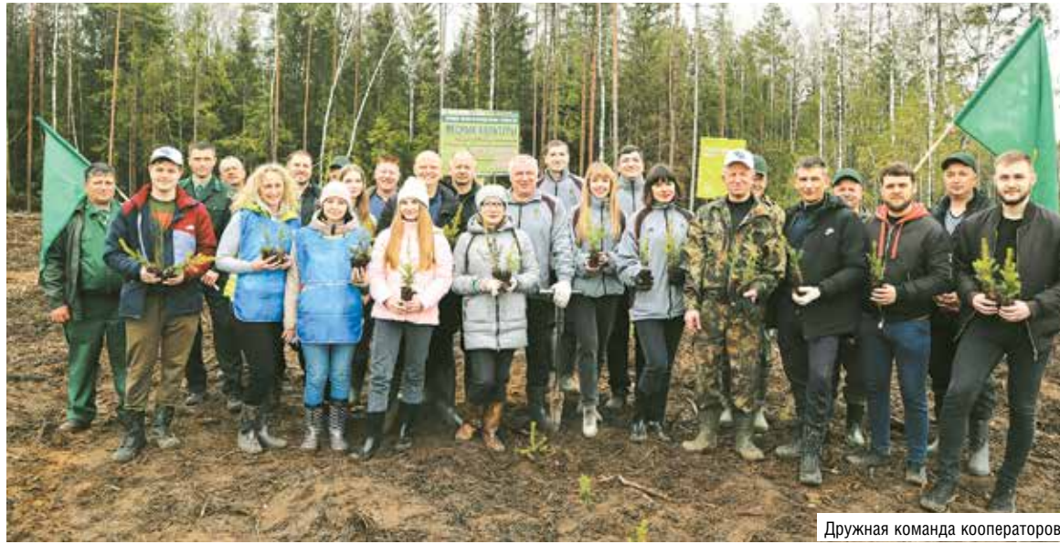
Дружная команда кооператоров

Республиканская акция «Неделя леса» будет длиться весь апрель. Кампания проходит в 16-й раз во всех регионах и посвящена Году мира и созидания. За время акции в стране появится не менее 2,8 тысячи гектаров новых лесов.