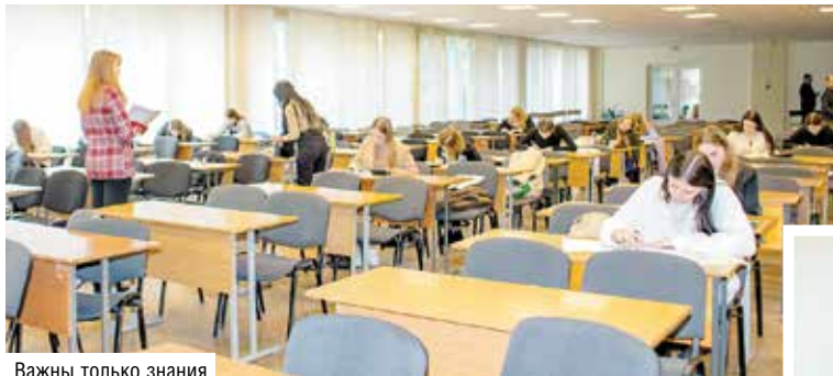
Важны только знания

БТЭУ ПК ПРОВЕЛ РЕСПУБЛИКАНСКУЮ ОЛИМПИАДУ ПО АНАЛИЗУ ХОЗЯЙСТВЕННОЙ ДЕЯТЕЛЬНОСТИ