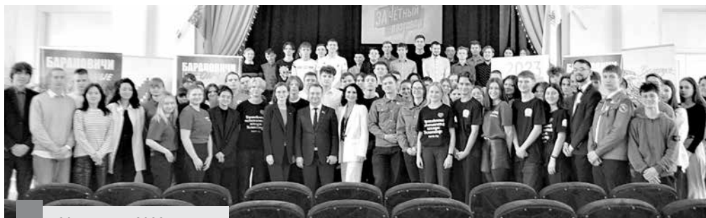
30 января 2023 года в Беларуси стартовал информационно-просветительский проект для студенческой и учащейся молодежи «Зачетный разговор».

— Полученная информация поможет нам аргументировать позицию по поддержке своей страны, ее политики в разговоре с друзьями, родителями, — считает учащийся 3-го курса колледжа, член Молодежного парламента при Барановичском городском