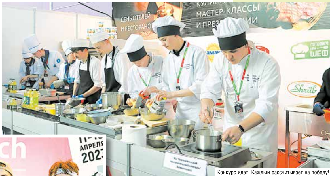
Конкурс идет. Каждый рассчитывает на победу!

Битва мастеров проходит по двум номинациям: классический и креативный драник. Пока ребя-