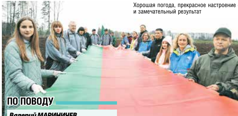
Хорошая погода, прекрасное настроение – и замечательный результат