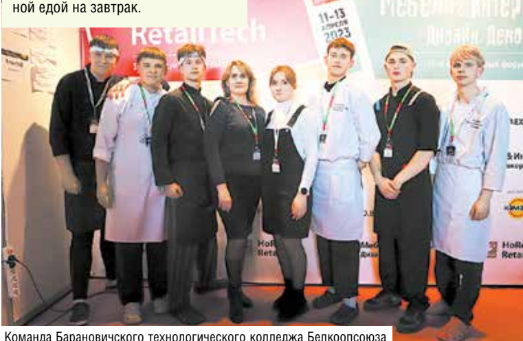
Команда Барановичского технологического колледжа Белкоопсоюза