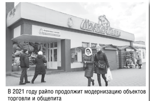
В 2021 году райпо продолжит модернизацию объектов торговли и общепита