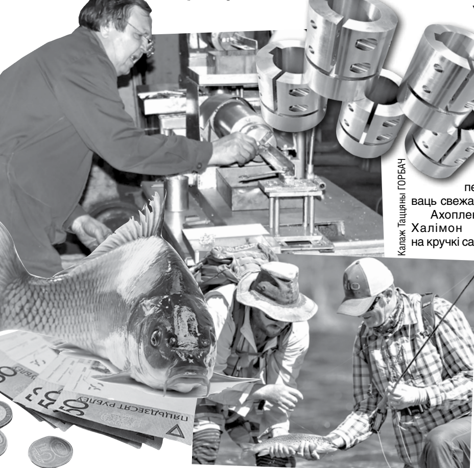
Калаж Таццяны ГОРБАЧ

Але тут увішняя фартуна, якую Халімон ужо, здавалася, надзейна ўхапіў за хвост, у самы ўрачысты момант здачы прадукцыі развітальна вільнула хвостом. Сымонава горка бесперашкодна адправілася адразу ж