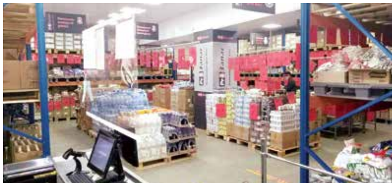
В январе в Вороново открылся магазин «ПРОЗапас» с минимальными торговыми надбавками

гируем на рыночные изменения и работаем напрямую с поставщиками по предоставлению серьезных скидок. В итоге можем предложить потребителю привлекательную цену. Также с октября 2020 года проводим автоматизацию розничной торговой сети – десять объектов филиала уже работают по программе LSFusion. Автоматизация позволила сделать магазин удобным и простым