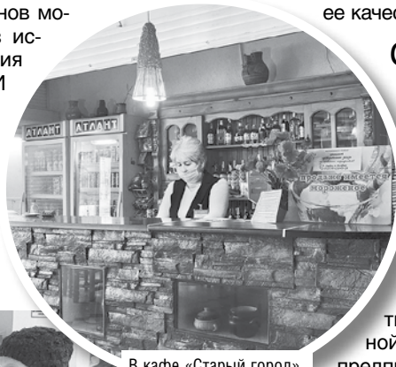
В кафе «Старый город»

В райпо уверены: перепрофилирование магазинов может стать одним из источников увеличения объемов продаж. И развивают это направление: в 2020 году магазин № 5 «Родны кут» в Березе перепрофилирован в «МЕГАопт», модернизирован также мага-