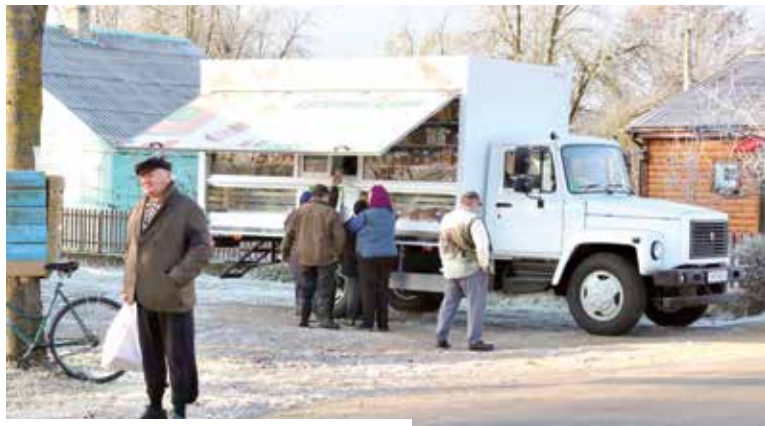
Сельчан обслуживает обновленный автомагистин