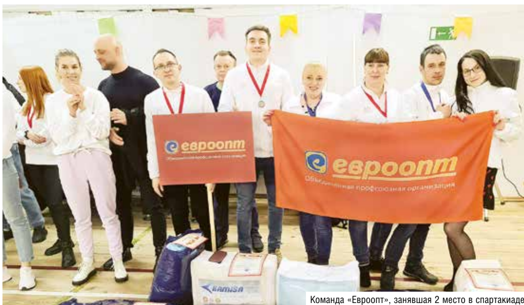
Команда «Евроопт», занявшая 2 место в спартакиаде