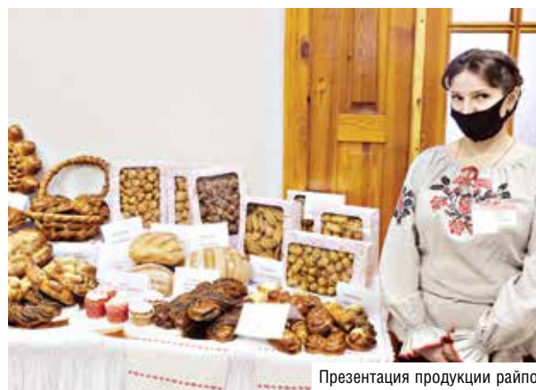
Презентация продукции райпо