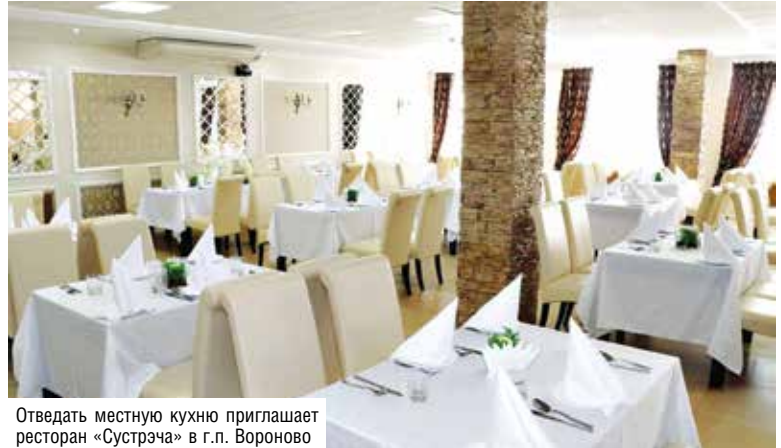
Отведать местную кухню приглашает ресторан «Сустрэча» в г.п. Вороново

позиции на конкурсе. В минувшем году на Республиканском смотре качества хлебобулочных и кондитерских изделий «Смаката» результаты конкурсной оценки продукции наших хлебопечков более чем достойные. Из 280 представленных образцов батон «Сдобный столичный», багет «Белорусский», кекс «Домашний» получили высшую награду – Гран-при I степени. Сухари ржаные «Веселушка», витушка сдобная, хлебец «Для женщин новый» и рекордсмен по наградам – хлеб «Хатні» – удостоены золотой медали. Вся продукция конкурса хорошо известна покупателям и почти ежедневно попадает на прилавок.