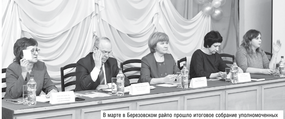
В марте в Березовском райпо прошло итоговое собрание уполномоченных