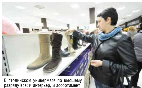
В столинском универсаме по высшему разряду все: и интерьер, и ассортимент

основополагающее значение, так же, как и материальная заинтересованность работников. И тут тоже есть к чему стремиться.