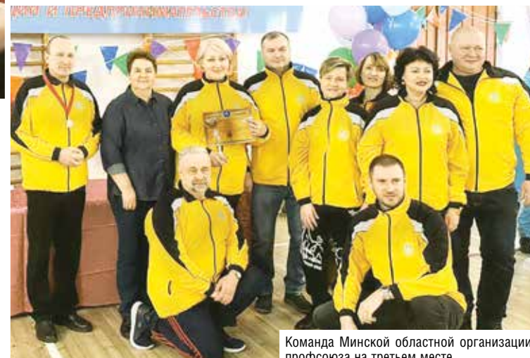
Команда Минской областной организации профсоюза на третьем месте