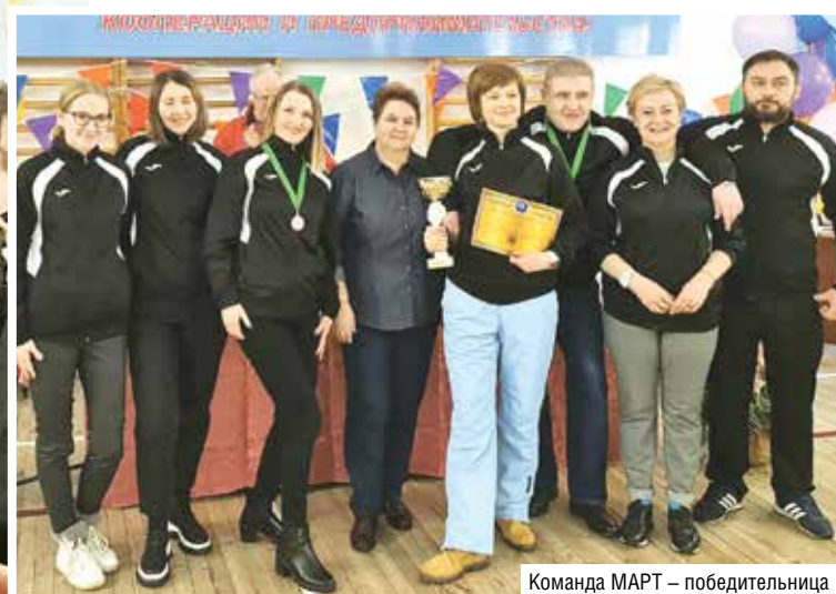
Команда МАРТ – победительница