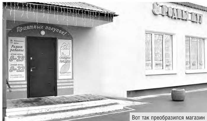
Вот так преобразился магазин

Березовское райпо активно обновляет торговые объекты