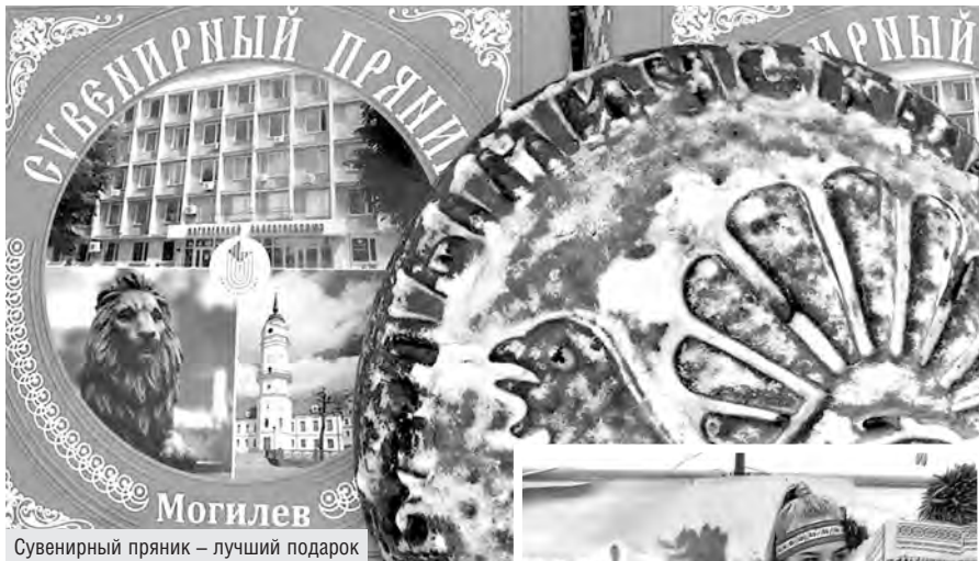
Сувенирный пряник – лучший подарок

выми блюдами и выпечкой. Это и время сэкономит, и радость доставит.