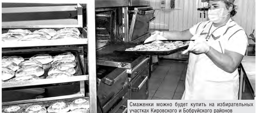
Смаженки можно будет купить на избирательных участках Кировского и Бобруйского районов