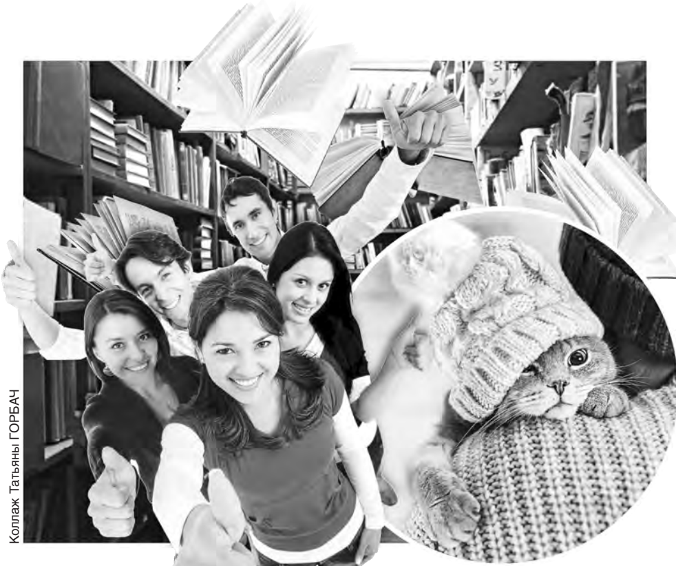
Коллаж Татьяна ГОРБАЧ

Этот день объединяет миллионы любителей животных. 8 августа – Всемирный