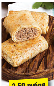
Голубцы (полуфабрикат, кг)