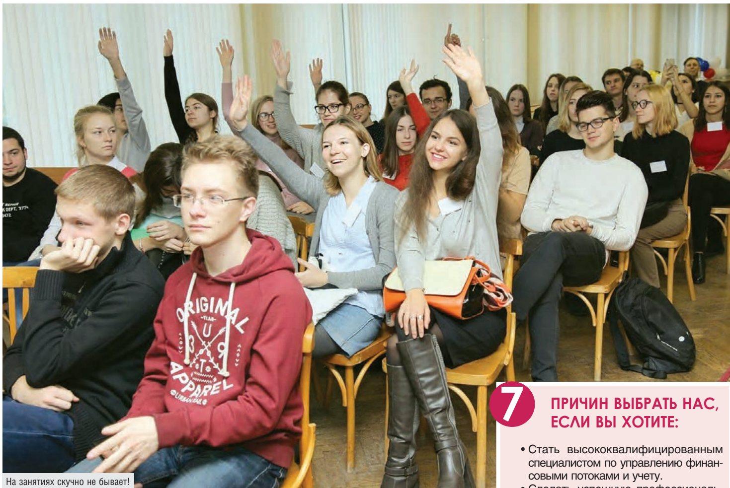
На занятиях скучно не бывает!