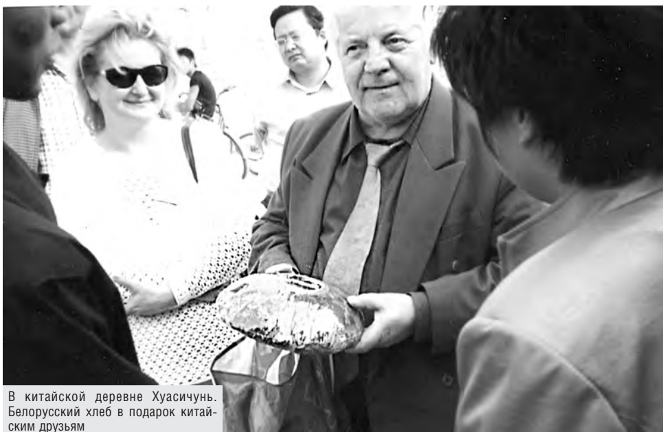
В китайской деревне Хуасичунь. Белорусский хлеб в подарок китайским друзьям