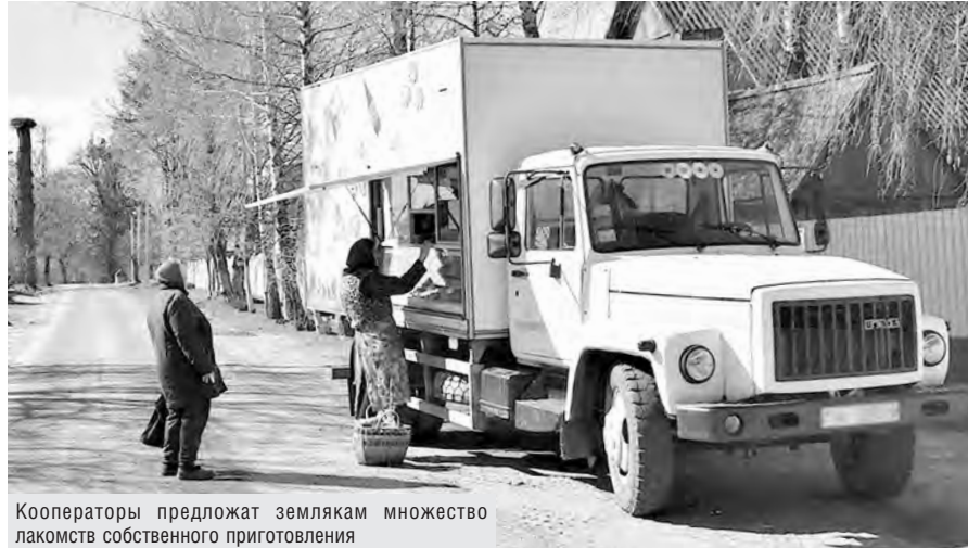
Кооператоры предложат землякам множество лакомств собственного приготовления

Подобная форма выездной торговли получила популярность еще в советские времена. Старались привезти все самое лучшее в этот торжественный и важный для страны день. У потребкооперации и сейчас всегда в наличии кулинарные изыски по очень доступной цене.