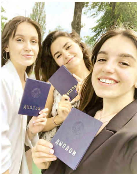
Выпускники-2020 — счастливые обладательницы дипломов университета по специальности «Бухгалтерский учет, анализ и аудит»

Нередко можно встретить в СМИ рассуждения футуристов о профессиях будущего. Некоторые горячие головы и о специальности «Бухгалтерский учет, анализ и аудит» начинают поговаривать, как о вымирающей, мол, цифровые технологии заменят в перучетах человека. На самом деле это одна из самых востребованных национальной экономикой и системой потребительской кооперации специальностей. Цифры успешного трудоустройства выпускников многих лет куда убедительнее домыслов.