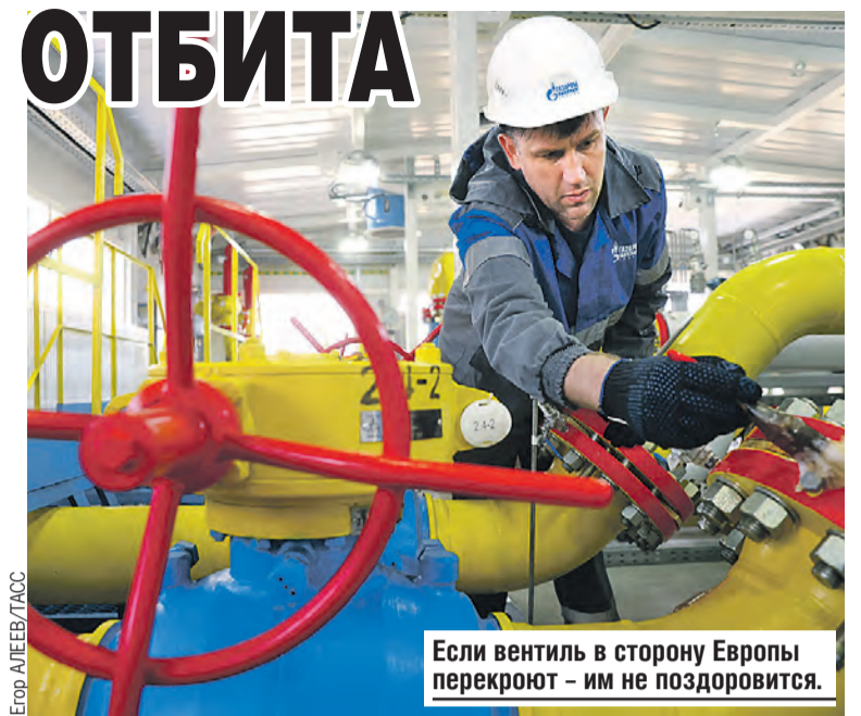
Если вентиль в сторону Европы перекроют — им не поздоровится.

22 апреля Еврокомиссия скрипя зубами приняла условия России, разрешив газовым компаниям торговать на ее условиях. Теперь можно подвести итог. К началу июня только шесть компаний отказались принять новые правила игры. Это польский концерн PGNiG, болгарский «Булгаргаз», финская компания Gasum, нидерландская GasTerra, датская Orsted Salg & Service и британо-голландская Shell Energy Europe. При чем не по своему желанию — им приказали это сделать местные политики. За строптивость придется платить.