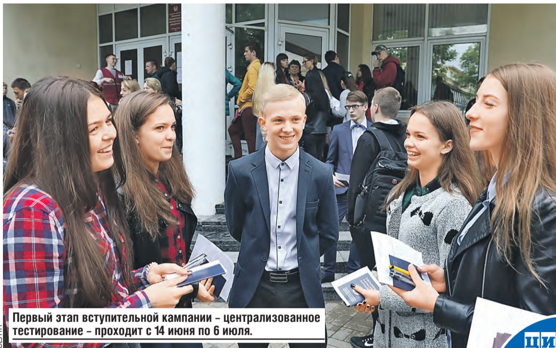
Первый этап вступительной кампании – централизованное тестирование – проходит с 14 июня по 6 июля.

между универсальностью знаний, их фундаментальным характером и ориентированностью на потребности реального сектора экономики. Что поможет достичь поставленной цели?