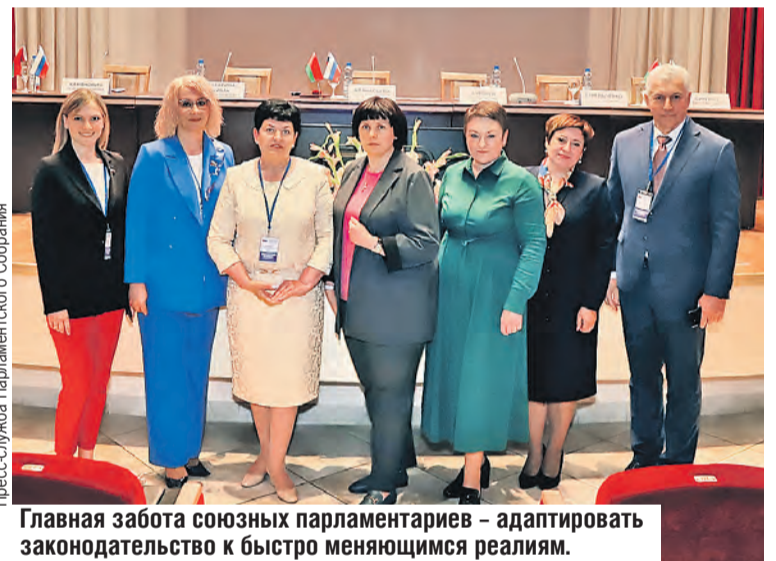
Главная забота союзных парламентариев – адаптировать законодательство к быстро меняющимся реалиям.

– Помимо программы семейного капитала, у нас эффективно работает система государственной поддержки многодетных семей в сфере жилищного строительства. Начали активно внедрять практику арендного жилья. Говорим российским коллегам: готовы поделиться опытом и сотрудничать, – привела пример парламентарий.