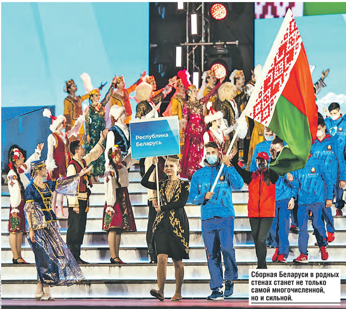
Сборная Беларуси в родных стенах станет не только самой многочисленной, но и сильной.

– Мы расширили географию Игр, чтобы, во-первых, дать возможность болельщикам на местах увидеть состязания вживую. К сожалению, мы, как и россияне, оказались под санкционными запретами. Но сила действия, как известно, равна силе противодействия. Санкции должны нас двигать в развитии. Игры непременно станут хорошим стимулом для развития спорта в регионах, – рассказал министр спорта Беларуси Сергей Ковальчук.