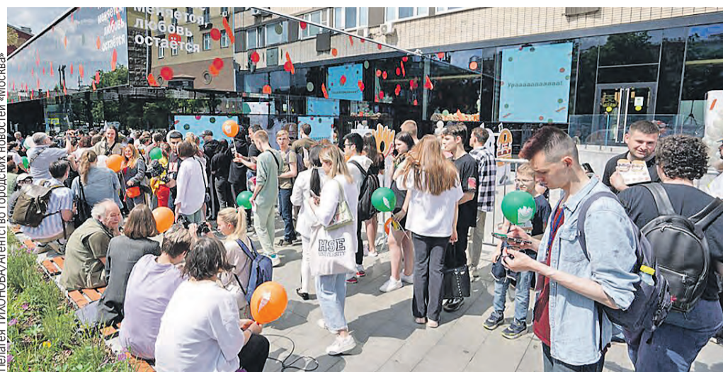
Ажиотаж на открытии сменщика McDonald's под названием «Вкусно – и точка» напоминал очереди в американскую закусочную 32 года назад.