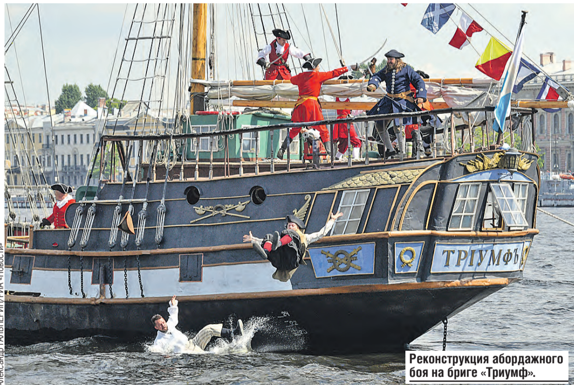
Реконструкция абордажного боя на бриге «Триумф».

Он не раз говорил соратникам: «Когда мы научимся всему, что Европа знает, мы сможем развиваться самостоятельно». Но в процессе этого перехода образовалась социальная группа, которую сейчас называют интеллигенцией. Она, по сути, возникла как служба перевода западных достижений на русский язык. Ее наследники до сих пор остаются в роли таких переводчиков и оценивают все, что в России происходит, только с одной точки зрения – насколько это близко к западным образцам. Именно из-за них слово «западник» в России воспринимается как нечто ругательное. А Петр исходил из того, что нужно пользоваться Западом сугубо в утилитарных целях. В этом его подлинное величие.