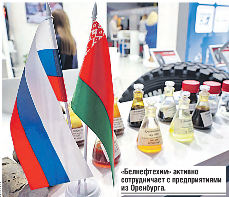
«Белнефтехим» активно сотрудничает с предприятиями из Оренбурга.

Следующим шагом ЕС решил сделать ограничения на поставку нефти и газа, но они снова подорожали, поскольку нашли новые покупатели. К примеру, Китай нарастил импорт больше чем на 50 процентов. Россия опять побеждает.