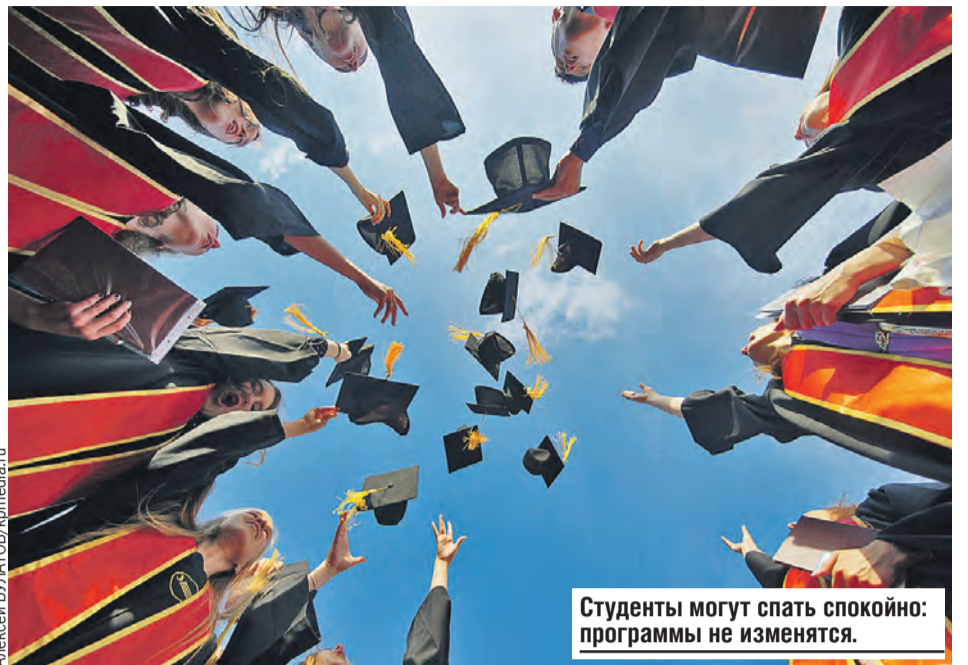
Студенты могут спать спокойно: программы не изменятся.

– Я думаю, это связано с качеством программ, мотивацией студентов. Расхлябанность, увы, есть везде, и на специалитете тоже. Нужно работать над мотивацией ребят, над тем, чтобы программы были хорошо оснащены, интересны, чтобы студенты могли получать практические навыки, иметь связь с работодателями. А бакалавриат это, специалитет или магистратура – не имеет значения.