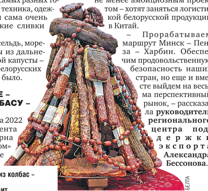
Торт из мяса, горы из колбас – голод Союзному государству не грозит.