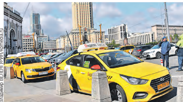
Теперь ездить наедине с незнакомцем станет безопаснее.

Запрещает закон бывшим уголовникам садиться и за руль автобусов, троллейбусов, трамваев. Но только тем, кто был осужден за тяжкие и особо тяжкие преступления, для средних сделали исключение.