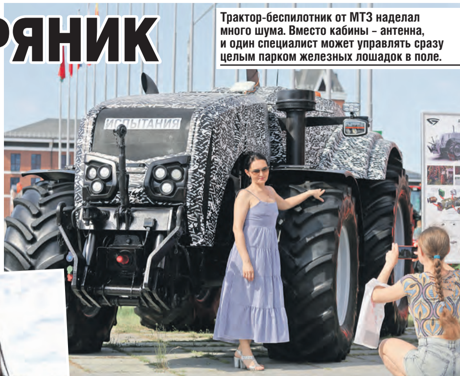
Трактор-беспилотник от МТЗ наделал много шума. Вместо кабины – антенна, и один специалист может управлять сразу целым парком железных лошадей в поле.

– Россияне прилетели к нам из Хабаровского края, Сахалина, Приморья – из самых отдаленных регионов. Больше 30 делегаций. Не просто посмотреть, а заключить контракты на поставку продуктов и техники. Ожидания оправдались. Форум превзошел прошлогодние по количеству участников и гостей, – сказал министр