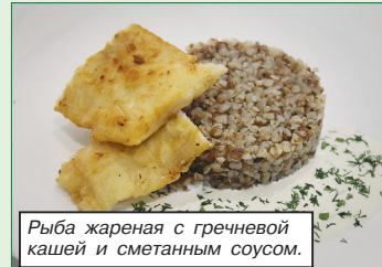
Рыба жареная с гречневой кашей и сметанным соусом.