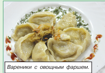
Вареники с овощным фаршем.