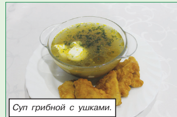
Суп грибной с ушками.

В целях популяризации белорусской национальной кухни не только в объектах придорожного сервиса, но и в общедоступной сети предприятий общественного питания Белкоопсоюза разработано и утверждено типовое меню из белорусских блюд, которое отражает колорит и самобытность нашей культуры. Блюда выделены в меню отдельным цветом.