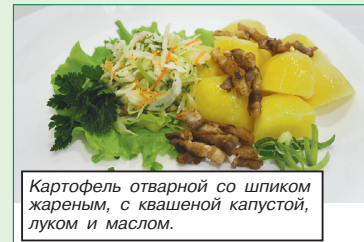
Картофель отварной со шпиком жареным, с квашеной капустой, луком и маслом.