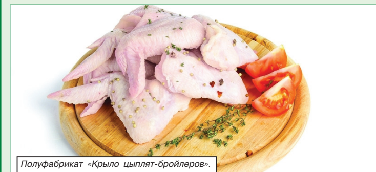
Полуфабрикат «Крыло цыплят-бройлеров».