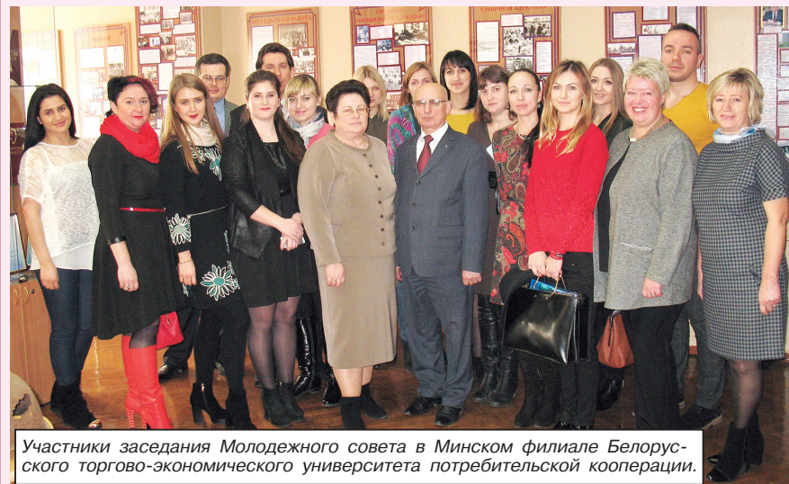
Участники заседания Молодежного совета в Минском филиале Белорусского торгово-экономического университета потребиооперации.

туален. Здесь для членов совета широчайшее поле деятельности, прежде всего в отстаивании интересов молодых работников.