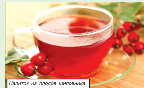
Напиток из плодов шиповника.

Еженедельно Белкоопсоюз проводит акцию «Блюдо недели» белорусской кухни в сети ресторанов потребиооперации.