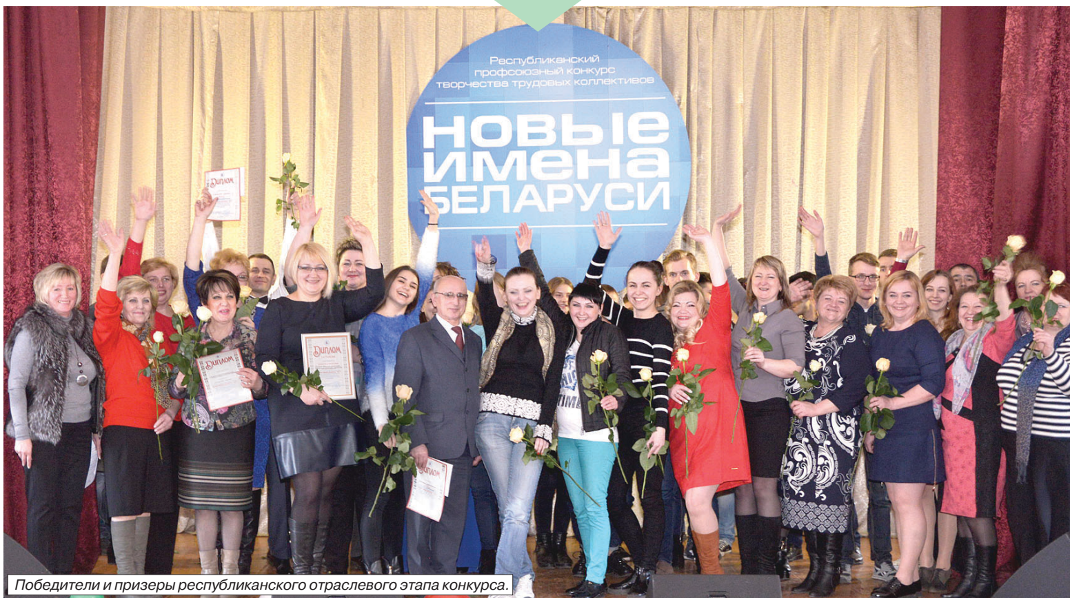
Победители и призеры республиканского отраслевого этапа конкурса.

В Минском филиале Белорусского торгово-экономического университета потребительской кооперации состоялся заключительный отборочный этап творческого конкурса трудовых коллективов Белкоопсоюза, инициатором проведения которого выступила Федерация профсоюзов Беларуси