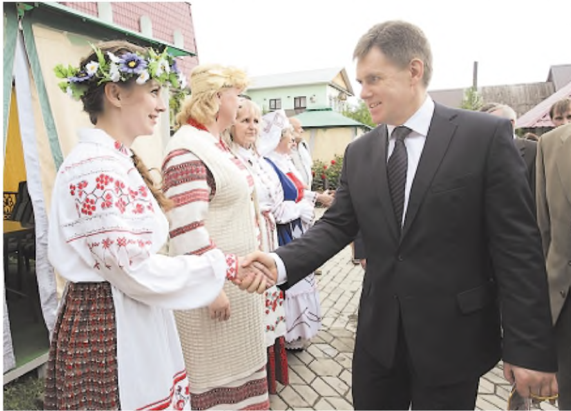
В каждой поездке посла в регионы в обязательном порядке значится встреча с местной белорусской диаспорой.

«Народная дипломатия» — это и побратимские связи. Десятки, сотни больших и малых городов... Завтра в День Независимости Республики Беларусь в одном только Могилеве соберутся друзья и однополчане из более чем десятка российских городов-побратимов: Смоленска, Пензы,