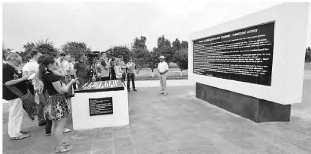
■ Всего через донорский концлагерь прошли 1990 детей в возрасте от 8 до 14 лет, в большинстве своем девочки с первой группой крови.

Ходатайство оформляется в течение дня. Обращаться по данному вопросу необходимо в приемные дни по вопросам гражданства. Адрес консульского отдела посольства и график работы указаны на сайте посольства в разделе «Консульские вопросы и визы».