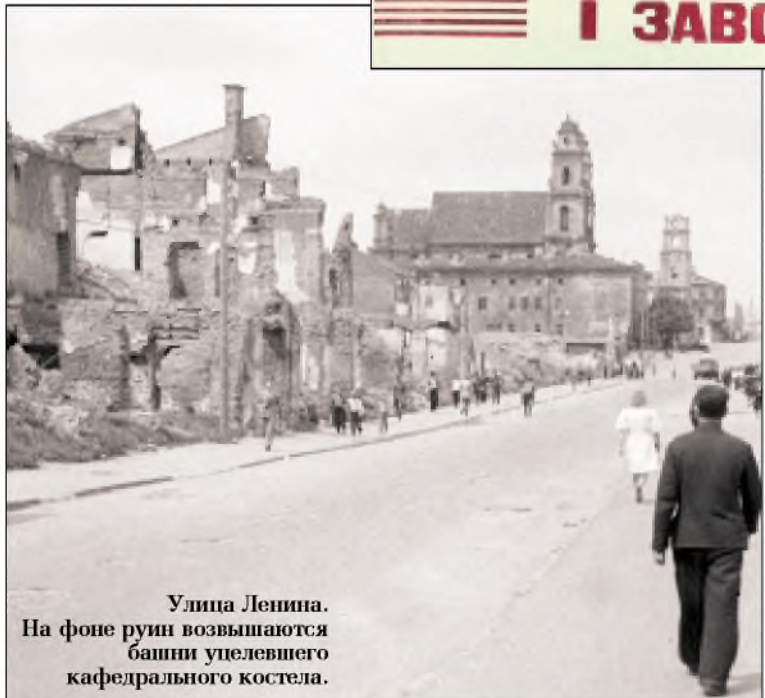
Улица Ленина. На фоне руин возвышаются башни упавшего кафедрального костела.

ватора, Могилевской — Заслонова, Брилевской — Партизан.