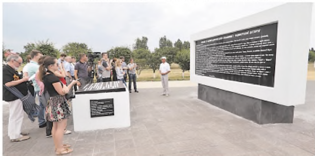
Всего через донорский концлагерь прошли 1990 детей в возрасте от 8 до 14 лет, в большинстве своем девочки с первой группой крови.

Ходатайство оформляется в течение дня. Обращаться по данному вопросу необходимо в приемные дни по вопросам гражданства. Адрес консульского отдела посольства и график работы указаны на сайте посольства в разделе «Консульские вопросы и визы».