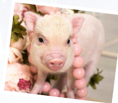
Подготовила Людмила КРАСНОПОЛЬСКАЯ Оформление Ольги ПАРХОМЕНКО

Желательно, чтобы наряд был по-настоящему праздничным. Идеальным выбором станет одежда в золотистых, бежевых, горчичных тонах. Особое внимание уделите причёске. Непременно надевайте самые любимые свои украшения из золота или серебра.