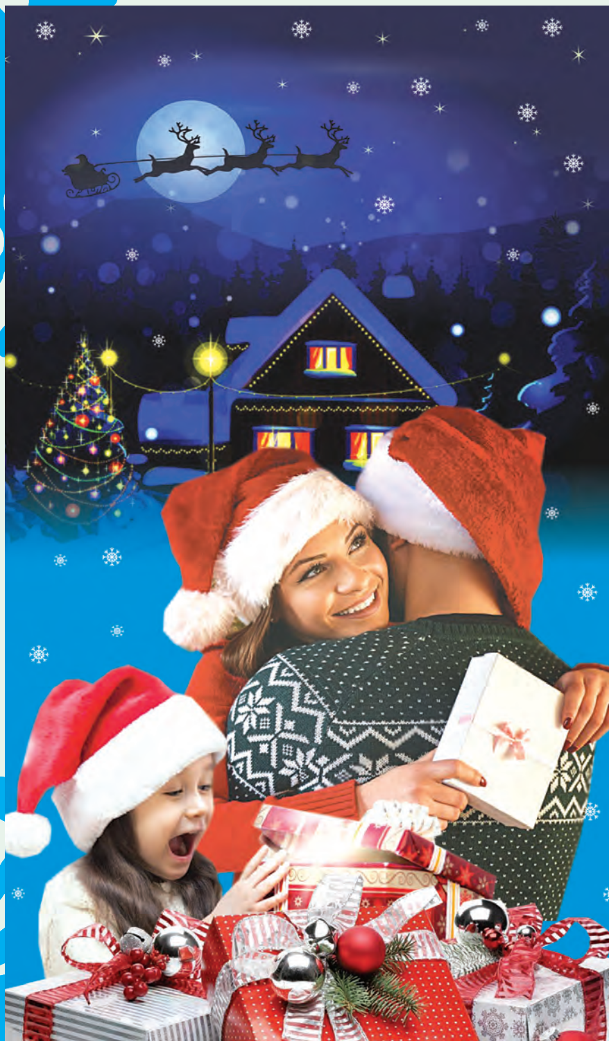
Коллаж: Елена ПОПОВА

В Гренландии одними из самых неожиданных подарков на планете можно считать вырезанные из льда фигурки моржей и белых медведей, которые дарят друг другу эскимосы. Поскольку в Гренландии даже летом холодно, как у нас на Новый год, ледяные подарки достаточно долговечны.