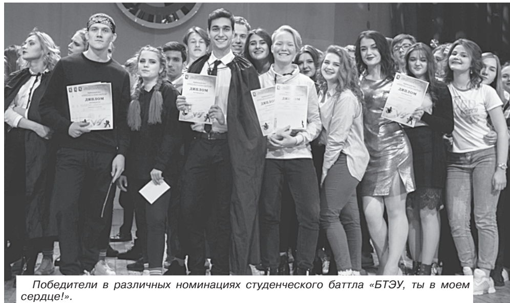
Победители в различных номинациях студенческого баттла «БТЭУ, ты в моем сердце!».