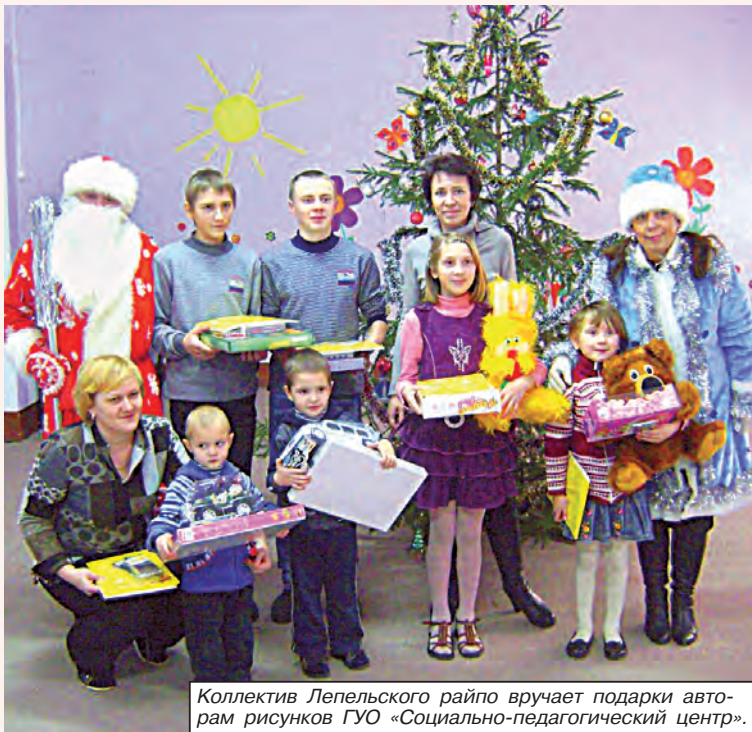
Коллектив Лепельского райпо вручает подарки авторам рисунков ГУО «Социально-педагогический центр».

Принято считать, что Новый год — это семейный праздник, и именно в этот период каждому из нас важно ощущать внимание и заботу. Особенно это важно для деток, которых лишены такой воз-