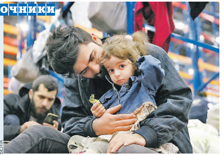
Беженцы рвутся в «сытую» Европу, но в Старом Свете их встречают слезоточивым газом и водометами.

неурегулированности конфликтов в Азии и на Африканском континенте. По сути, отовсюду, куда вместо заявленных демократических ценностей коллективный Запад привнес хаос. Это первопричина миграции. Раньше западные соседи пытались бороться с нелегальным наплывом беженцев нашими руками, используя инструменты международной технической поддержки, когда затраты частично компенсировали с помощью такой помощи и совместных действий пограничных и миграционных служб. После 2020 года в угоду политической конъюнктуры соседи остановили программы, прекратили контакты между правоохранительными структурами, что и привело к сегодняшней ситуации. С другой стороны,