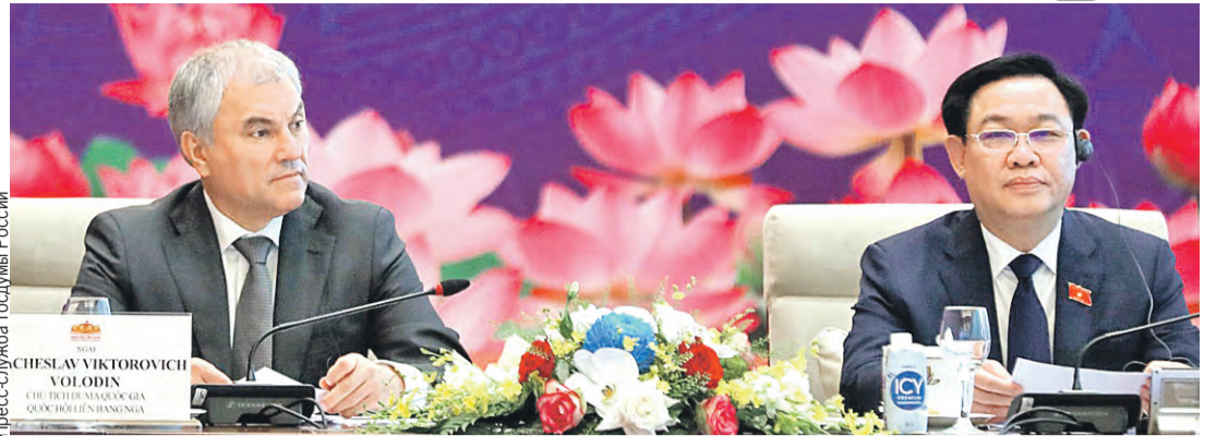
Спикер Госдумы побывал с официальным визитом в Ханое. Там он провел переговоры с президентом республики Во Ван Тхьонгом. Также состоялось заседание Межпарламентской комиссии по сотрудничеству Госдумы и Национального собрания Вьетнама. Главные темы – взаимодействие стран в сферах энергетики и транспорта, информационных технологий и сельского хозяйства, науки, высшего образования, финансов.