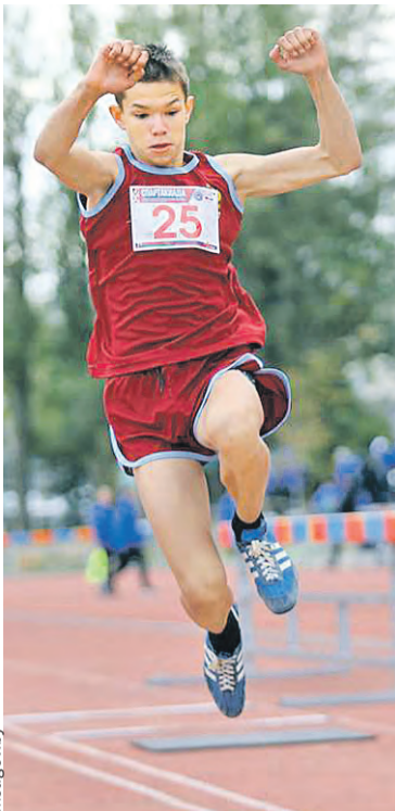
В соревнованиях по легкой атлетике лучше всех выступила команда из Челябинской области...