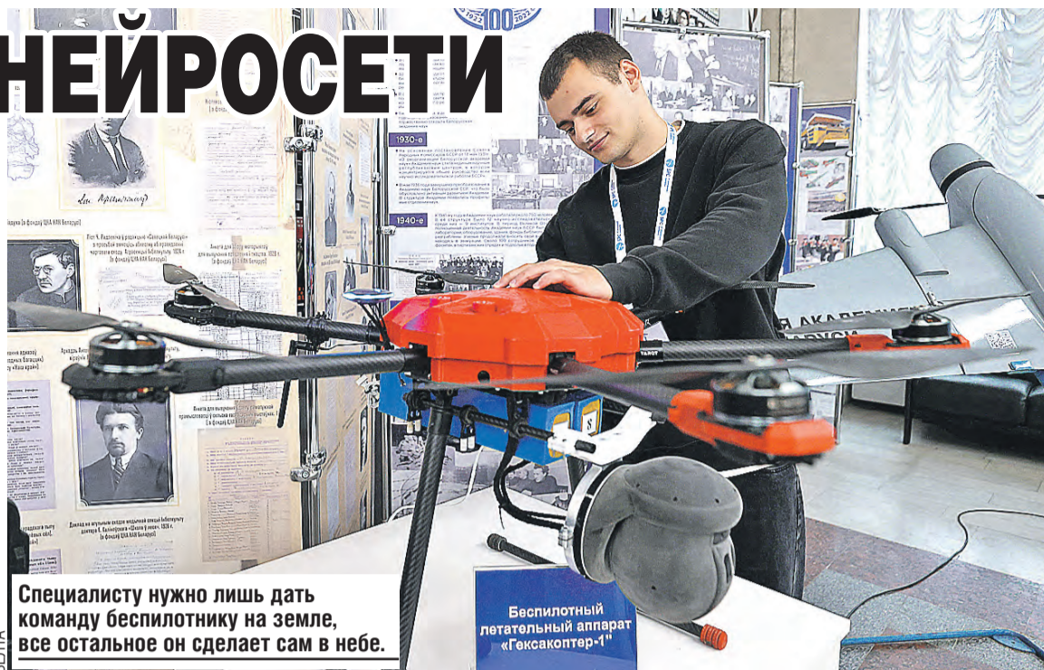
Специалисту нужно лишь дать команду беспилотнику на земле, все остальное он сделает сам в небе.

Одни из самых «фотогеничных» работ на выставке – беспилотники «Бусел МКР» и «Гексакоптер-1». Начинка – аппаратно-программный комплекс – на злобу западным «доброжелателям», наша, отечественная. Возможности этих «птичек» впечатляют: автоматическое сопровождение движущихся объектов и определение их координат, обна-