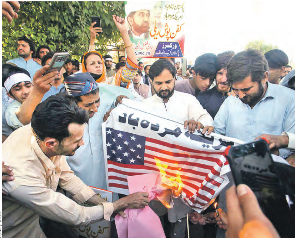
Тысячи людей остались без крыши над головой – дома превратились в руины. Их довели до отчаяния. Но Америке, видимо, только на руку такое положение дел.

– Цель Вашингтона – выдавить Иран с Ближнего Востока и максимально уменьшить его влияние в этом регионе. Повышение градуса напряженности между палестинцами и израильтянами им только на руку. Посмотрите, без каких-либо доказательств и реальных фактов в происходящем Штаты обвиняют Иран и... Россию. Просто потому, что им так выгодно. Сейчас руками израильтян уничтожают сектор Газа вместе с мирными жителями под прикрытием борьбы с ХАМАС, при