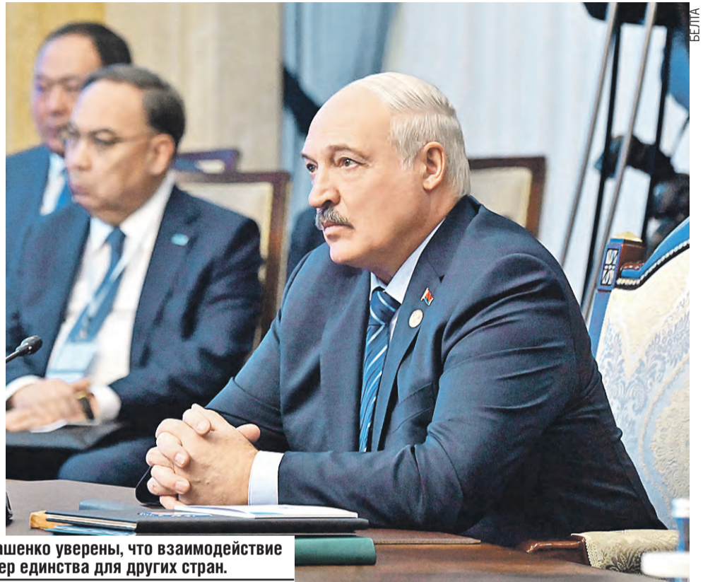
Владимир Путин и Александр Лукашенко уверены, что взаимодействие России и Беларуси – лучший пример единства для других стран.