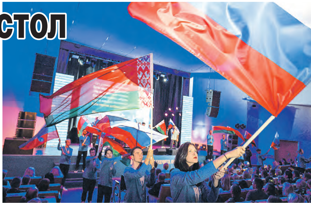
Известных спикеров на форуме слушала молодежь – именно ей строить будущее.

Еще один важный проект – «Библиотека Союзного государства». Уже изданы