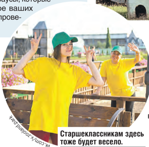
Старшеклассникам здесь тоже будет весело.

Тут же и нутрии, которые деловито выбираются из воды и непрозрачно намекают, что они тоже не прочь получить от вас внимание и угощение из специальной корзиночки – не все же оленей тискать и кормить. И любопытные страусы, которые готовы изучить содержимое ваших сумок и рюкзаков. Пока не проверят – не отпустят.