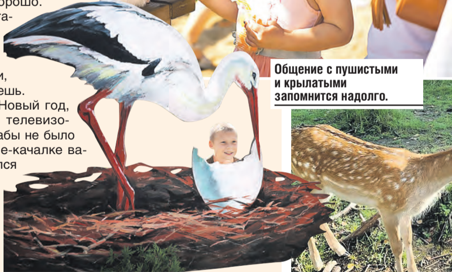
Общение с пушистыми и крылатыми запомнится надолго.

Внутри – всегда Новый год, наряжена елка, по телевизору крутят песню «Кабы не было зимы...», а в кресле-качалке вальяжно расположился почтальон Печкин. Фигуры от Шарика, кстати, тоже присутствуют – эффект полного погружения.