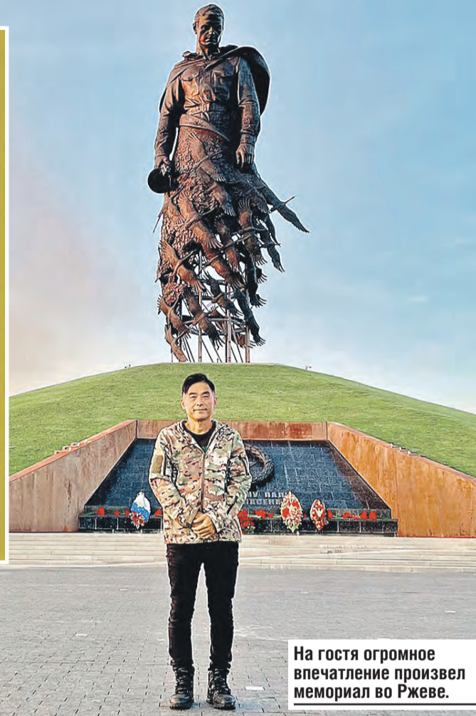
На гостя огромное впечатление произвел мемориал во Ржеве.

– Это был такой юношеский максимализм. Я думал, весь мир мне по зубам, море по колено. При этом по-русски знал только три слова: «туалет», «спасибо», «гостиница». Но меня вдохновлял мой любимый Чехов.