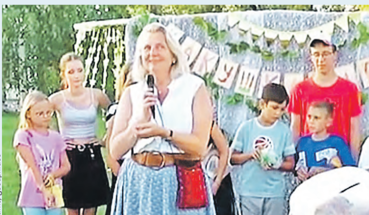
Опальная дама чувствует себя в России как дома.

стукнуло 53 – возраст для замужества, скажем так, солидный.