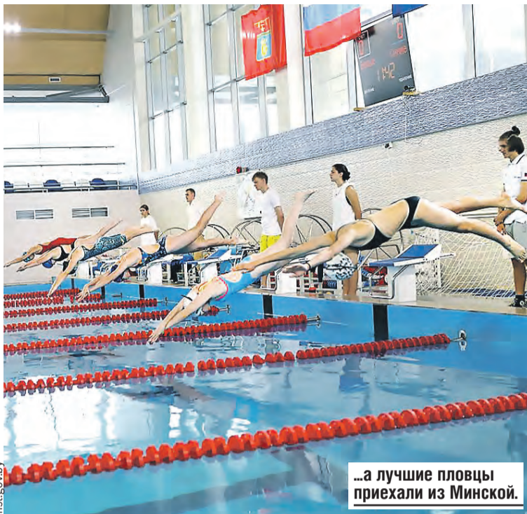
...а лучшие пловцы приехали из Минской.