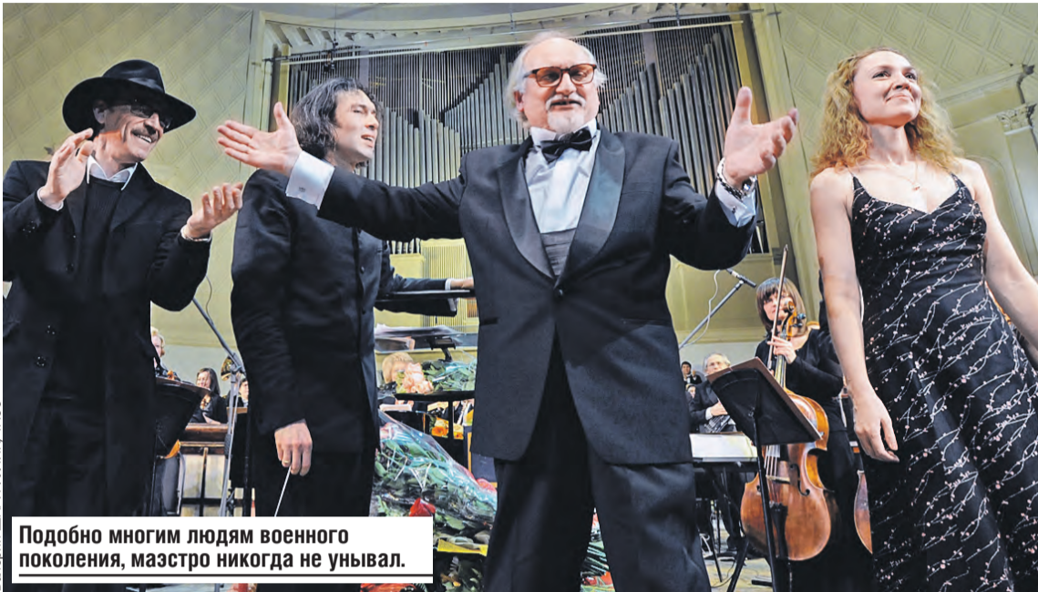
Подобно многим людям военного поколения, маэстро никогда не унывал.

Маэстро жил и трудился в основном на даче. За закрытой дверью и занавешенным окном. В тишине. За двумя столами. На одном стоял инструмент с маленькими клавишами, на другом – ноты и тексты. И композитор ездил между ними на кресле. У него всегда было несколько вариантов музыки на один текст, и нужно было выбрать лучший.