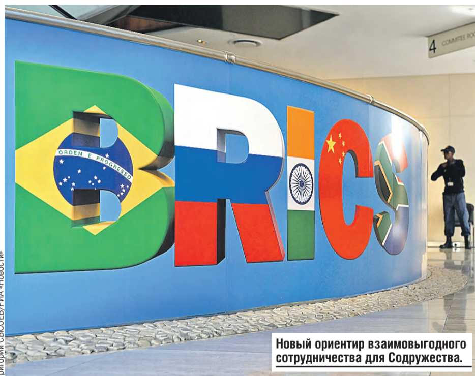
Новый ориентир взаимовыгодного сотрудничества для Содружества.