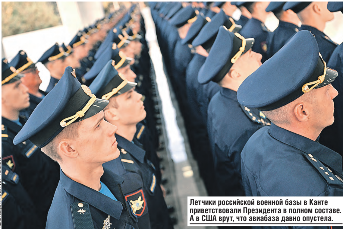
Летчики российской военной базы в Канте приветствовали Президента в полном составе. А в США врут, что авиабаза давно опустела.

● По поводу Грузии: все это произошло после провокации бывшего грузинского руководства в отношении Южной Осетии. За этим последовали события, которые привели к ухудшению взаимоотношений с СНГ. Они, на мой взгляд, сами виноваты. Хотя и с Грузией отношения у нас сейчас ровные. У них большой интерес к сотрудничеству