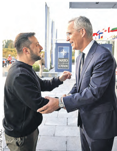
Генсек НАТО Йенс Столтенберг тянет горе-президента, а с ним Украину, к катастрофе.

– Поэтому власти ЕС не решатся передать Украине непосредственно сами замороженные активы, о чем просил Зеленский. В международном праве нет сроков давности. Ситуация в Украине рано или поздно развеется, а неприятности останутся. Это никому там не нужно.