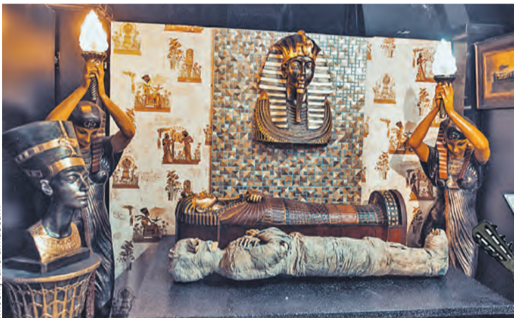
В музее одних только траурных платьев XIX века около 200. Само собой, есть и мумии.

Здесь около тридцати тысяч экспонатов, и почти к каждому нужен комментарий, поэтому лучше взять экскурсию.