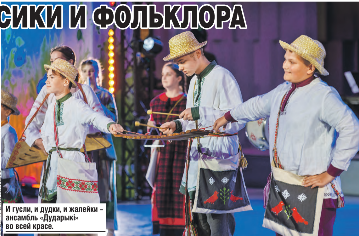
И гусли, и дудки, и жалейки — ансамбль «Дударыкі» во всей красе.

— Это третий фестиваль Союзного государства, в котором участвую. Я вообще часто бываю в Беларуси. Даже создал песню «На двоих одна судьба» — официальный гимн двух стран. Она часто звучала и на «Славянском базаре», и на мероприятиях Союзного государства. Да и папа родом из Беларуси.