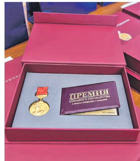
За двадцать с лишним лет награду получили около шестидесяти человек.