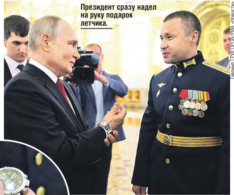
Президент сразу надел на руку подарок летчика.

– Из этого можно сделать вывод, что технику, конечно, можно поставить и дополнительно, а мобилизационный резерв безграничным не является, – резюмировал Владимир Путин. – И, похоже, западные союзники Украины действительно решили воевать с Россией до последнего украинца. Вместе с тем нужно исходить из того, что наступательный потенциал противника не исчерпан, ряд стратегических резервов пока не задействован, и прошу иметь это в виду при построении боевой работы. Исходить нужно из реалий.