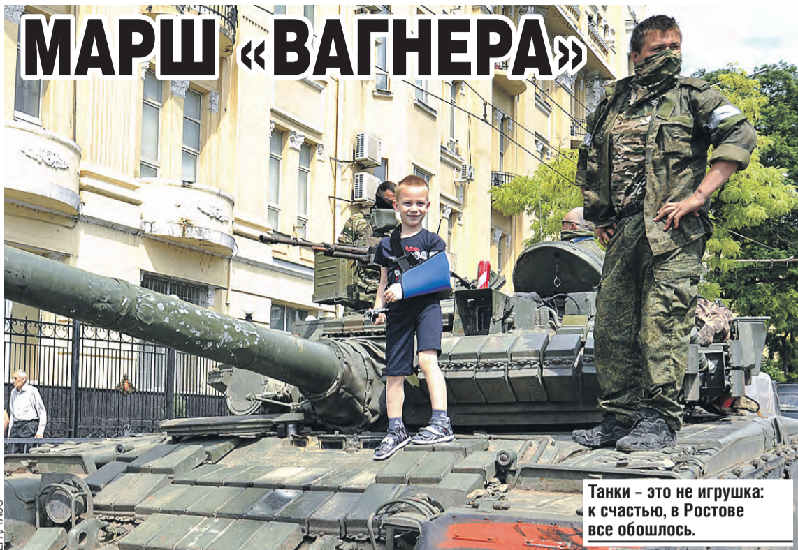
Танки – это не игрушка: к счастью, в Ростове все обошлось.