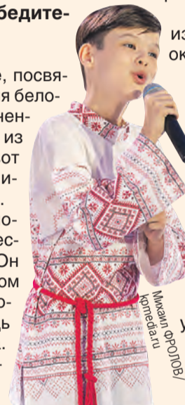
Башкирский соловушка покоряет женские сердца.