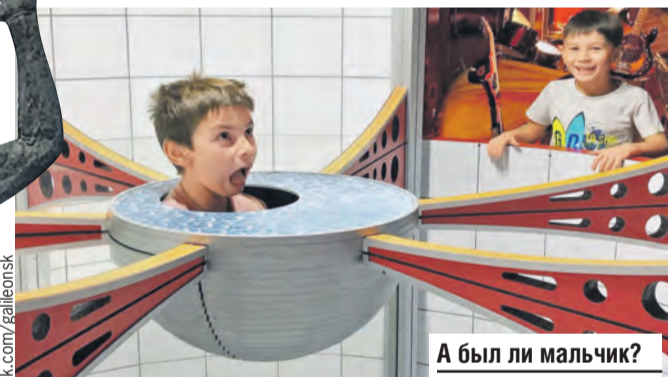
А был ли мальчик?

С самого открытия и до наших дней у театра хорошо укомплектованная труппа и невероятно мощные, поражающие воображение постановки. Выберите любую по душе – разочарованы не будете.