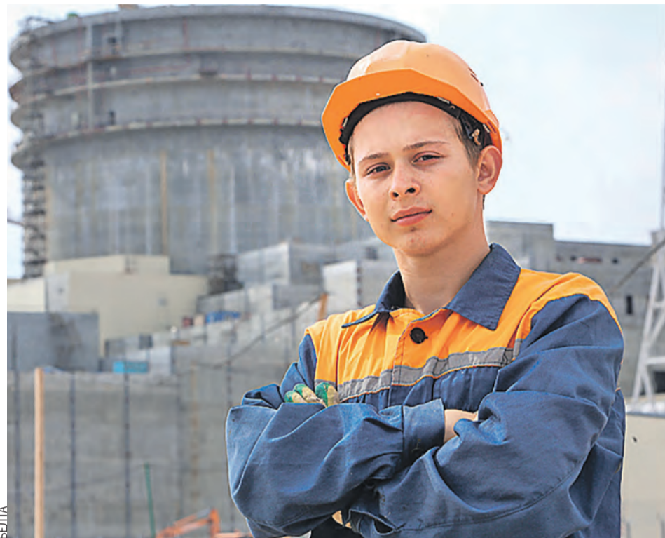
Для кого-то заработанные в стройотряде деньги могут стать «первым капиталом», а закалка поможет и на госслужбе, и в «своем деле».

– Главное, моделировать свое будущее не для картинке в соцсетях, а исходя из реальности. Стране