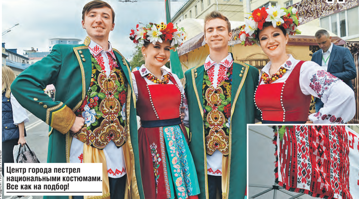
Центр города пестрел национальными костюмами. Все как на подбор!

В древней кибитке встречали айраном и кыстыбыями.