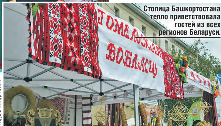
Столица Башкортостана тепло приветствовала гостей из всех регионов Беларуси.