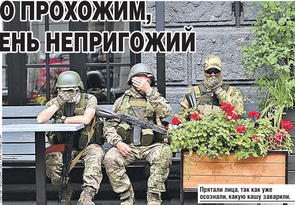
Прятали лица, так как уже осознали, какую кашу заварили.

– Мы вместе с вами воевали, шли на риски, мы вместе побеждали. Мы одной крови, мы воины. Я призываю остановиться. Противник только и ждет, когда у нас обострится внутривойсковая обстановка. Нельзя играть ему на руку в это тяжелое для страны время. Пока не поздно, нужно и необходимо подчиниться воле и приказу всенародно избранного Президента.