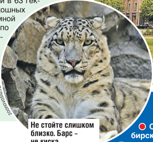
Не стойте слишком близко. Барс – не киска.

Здесь можно не только замечательно погулять, полюбовавшись на обитателей зоопарка, но и покататься на аттракционах и сфотографироваться у динозавров. Не живых, но все же.