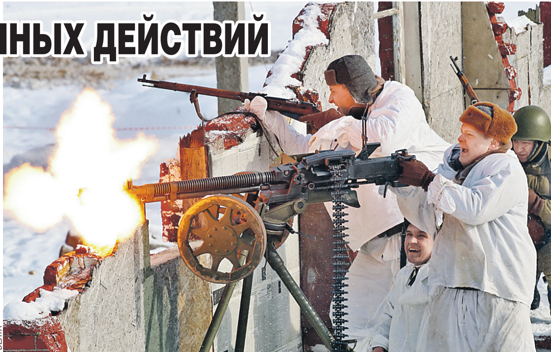
В исторических реконструкциях все точно до мельчайших деталей обмундирования, и оружие самое настоящее – прямо из той героической эпохи.

Реконструкция началась. Сотня лет пронеслась перед глазами за пару часов. Шоу разбили на пять эпизодов.