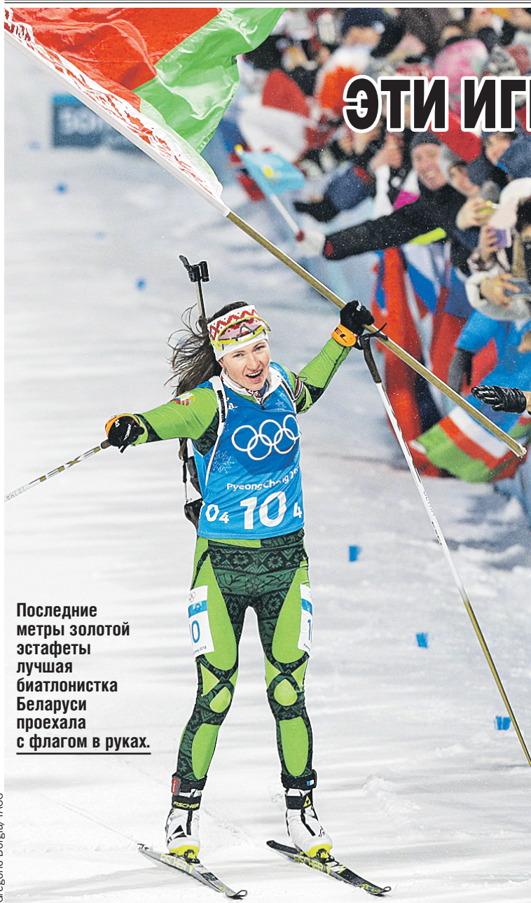
Последние метры золотой эстафеты лучшей биатлонистки Беларуси проехала с флагом в руках.