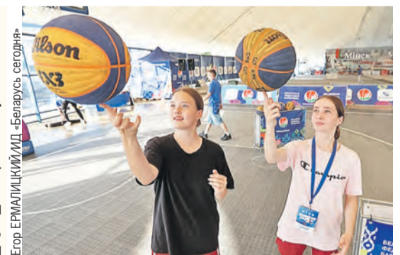
Девушки ловко крутили мяч на пальце, а потом технично закидывали его в кольцо, как настоящие баскетболистки.

– Встретил многих знакомых и увидел массу счастливых людей. Меня поздравляют до сих пор. Это очень приятно. Такие мероприятия развивают молодежь, ребята знакомятся с новыми видами спорта, – уверен двукратный олимпийский чемпион белорусский батутист Иван Литвинович.