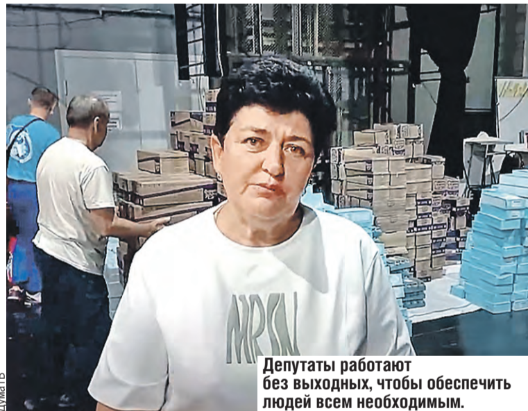
Депутаты работают без выходных, чтобы обеспечить людей всем необходимым.

– Куряне каждый день принимают очень много помощи буквально из всех уголков нашей необъятной Родины. Сегодня – от Российского детского фонда. Это продукция, которая пойдет детям в многодетные семьи. Будем поддерживать малышей.