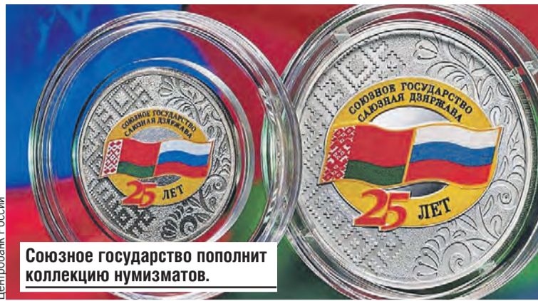
Союзное государство пополнит коллекцию нумизматов.

си «Союзное государство» и «Саюзная дзяржава», а с лицевой – номинал, проба и герб.