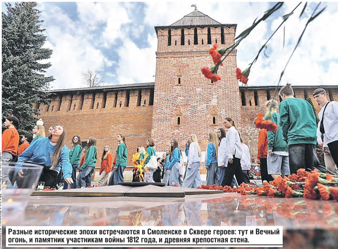
Разные исторические эпохи встречаются в Смоленске в Сквере героев: тут и Вечный огонь, и памятник участникам войны 1812 года, и древняя крепостная стена.

Госсекретарь Союзного государства Дмитрий Мезенцев напомнил, что в последнее время в два раза уве-