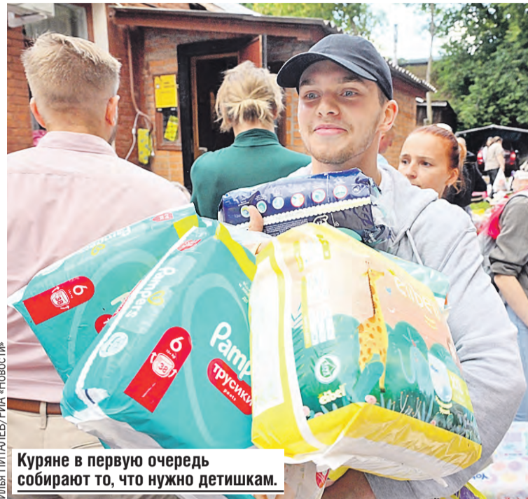
Куряне в первую очередь собирают то, что нужно детишкам.

– Конечно, это вызов. Он серьезный не только для Курского региона, но и для всей