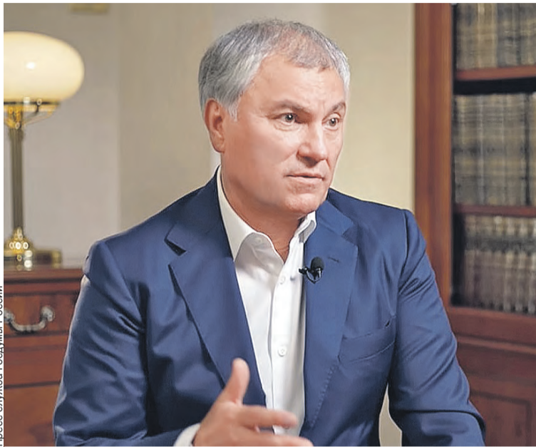
«Задачи, поставленные Владимиром Путиным и Александром Лукашенко, должны решаться оперативно», – подчеркнул Вячеслав Володин.

дружбы: обменивались делегациями, приезжали, высказывали заверения дружбы. На этом практически вся работа завершалась, – объяснил он. – Сейчас мы, предложив новые форматы, выстроили отношения, которые базируются