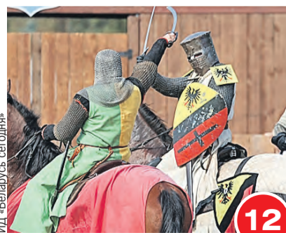
ИД «Беларусь сегодня»