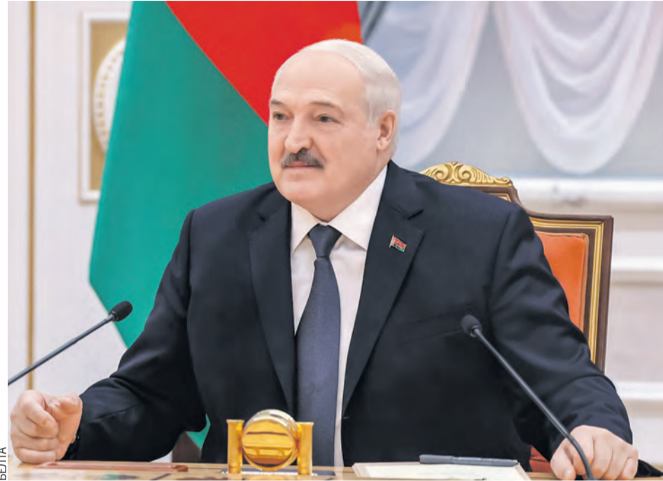
Александр Лукашенко убеждал и нынешнее, и прежнее руководство Украины хорошо подумать и не наломать дров.

ответил на претензии Александр Лукашенко. – А Украина что? Она же раньше Запада ввела против нас санкции. Зачем вы по надуманным причинам закрыли небо для нашей авиации? Вы арестовали несколько тысяч наших вагонов с минеральными удобрениями. До сих пор не вернули. Арестовали 75 наших фур, трех человек убили... Мы проводили операцию, чтобы тела достать.