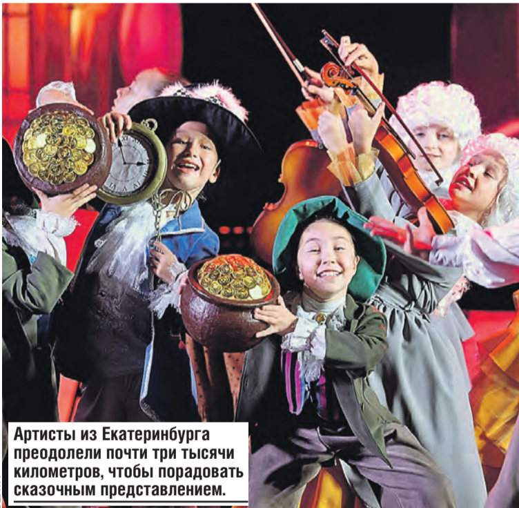
Артисты из Екатеринбурга преодолели почти три тысячи километров, чтобы порадовать сказочным представлением.