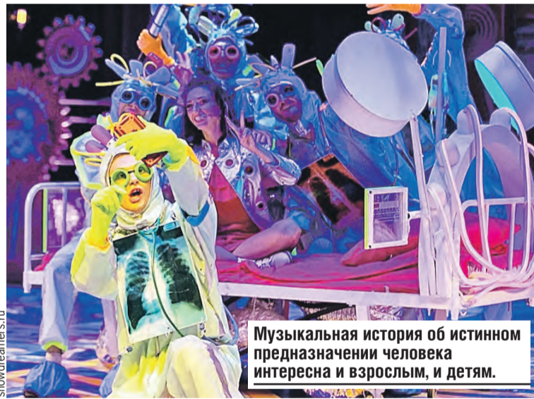
Музыкальная история об истинном предназначении человека интересна и взрослым, и детям.

– С Ларисой Долиной мы и сейчас поддерживаем отношения. А насчет того, чтобы повторить такой опыт, я только за и всегда готов рассмотреть такие предложения. Жизнь продолжается, все самое интересное впереди.