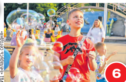
ИД «Беларусь сегодня»

Что противопоставим европейской повесточке