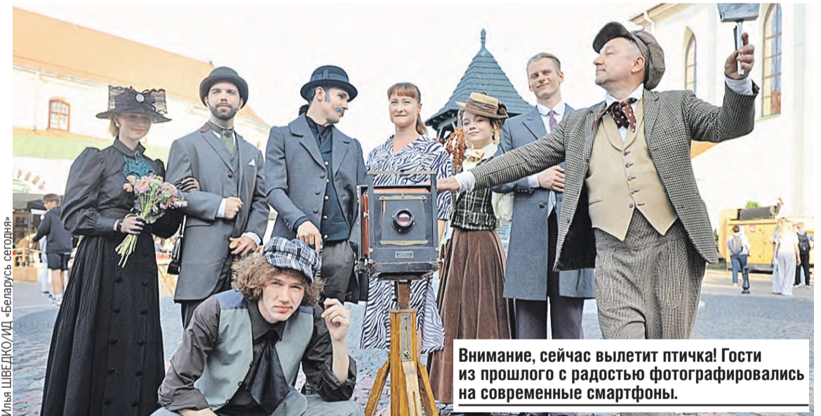
Внимание, сейчас вылетит птичка! Гости из прошлого с радостью фотографировались на современные смартфоны.