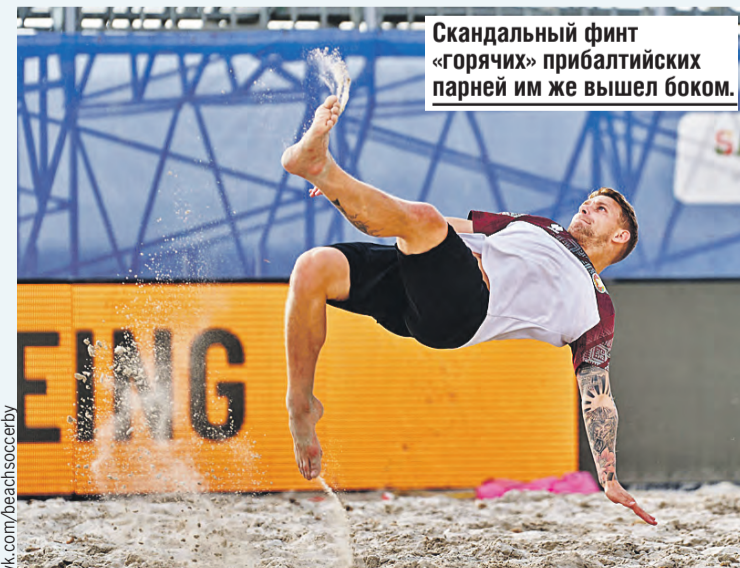
Скандальный финт «горячих» прибалтийских парней им же вышел боком.

Не хочется, чтобы история повторялась. Теперь уже с белорусами. А эстонский демарш для европейских футбольных чиновников останется капризным взбрыком прибалтов – дали пинка и забыли. Пусть так и будет.