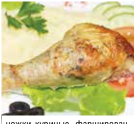
ножки куриные, фаршированные грибами, с картофельным пюре – 3,59 рубля