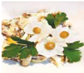
салат с говядиной «Белые росы» – 2,49 рубля