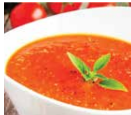
суп томатный классический – 1,79 рубля