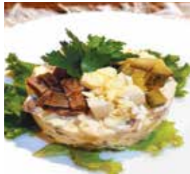
салат мясной с говяжьим языком – 1,99 рубля