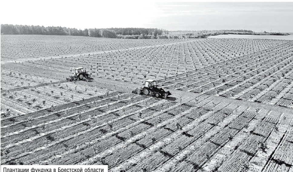
Плانتации фундука в Брестской области

– В частности, продажи картофеля увеличились на 16,4 процента, капусты белокочанной – на 5,7 процента, томатов – на 5,5 процента. В магазинах и гипермаркетах все больше продукции широкого круга белорусских производителей, в том числе крестьянско-фермерских хозяйств.