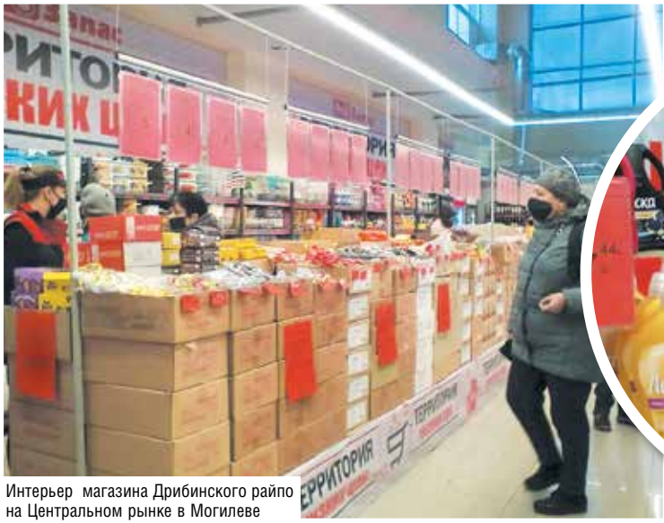
Интерьер магазина Дрибинского райпо на Центральном рынке в Могилеве

Светлана ЖИБУЛЬ