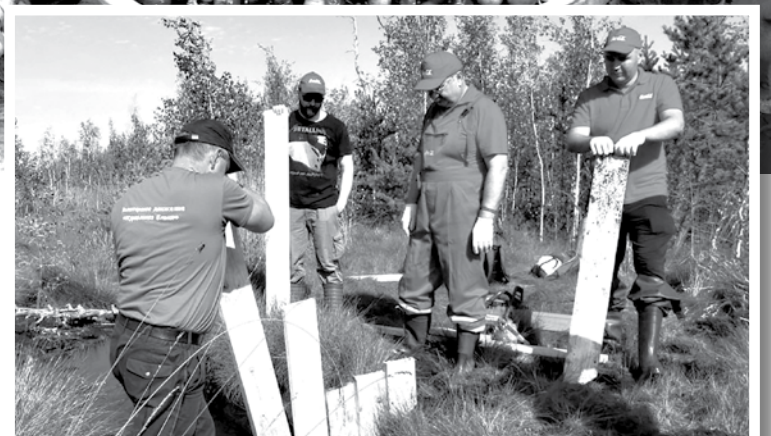
Летась грамадская арганізацыя «Ахова птушак Бацькаўшчыны» арганізавала валанцёрскі лагер у ландшафтным заказніку «Ельня». Кампанія «Кока-Кола» прафінансавала закупку неабходных матэрыялаў для рамонту плацін, якія будавалі ў 2007 годзе.

звычай актуальная праблема: Ельнію неабходна ратаваць. Не марудзячы. Аб'яднаць сілы і магчымасці навукі, прыродаахоўных органаў, мясцовых улад, грамадскасці. Як мага больш прыцягнуць інвестыцыі, у тым ліку і замежных. Нават папярэднія разлікі паказваюць, што мерапрыемствы па ахове прыроды – выгадныя інвестыцыі. Стварыць такую інфраструктуру, каб Ельня стала цікавай для экалагічнага і навуковага турызму, і многае, многае іншае.