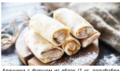
блинчики с фаршем из яблок (1 кг, полуфабрикат) – 5,99 рубля

Акция в кафе, ресторанах, объектах придорожного сервиса потребительской кооперации: