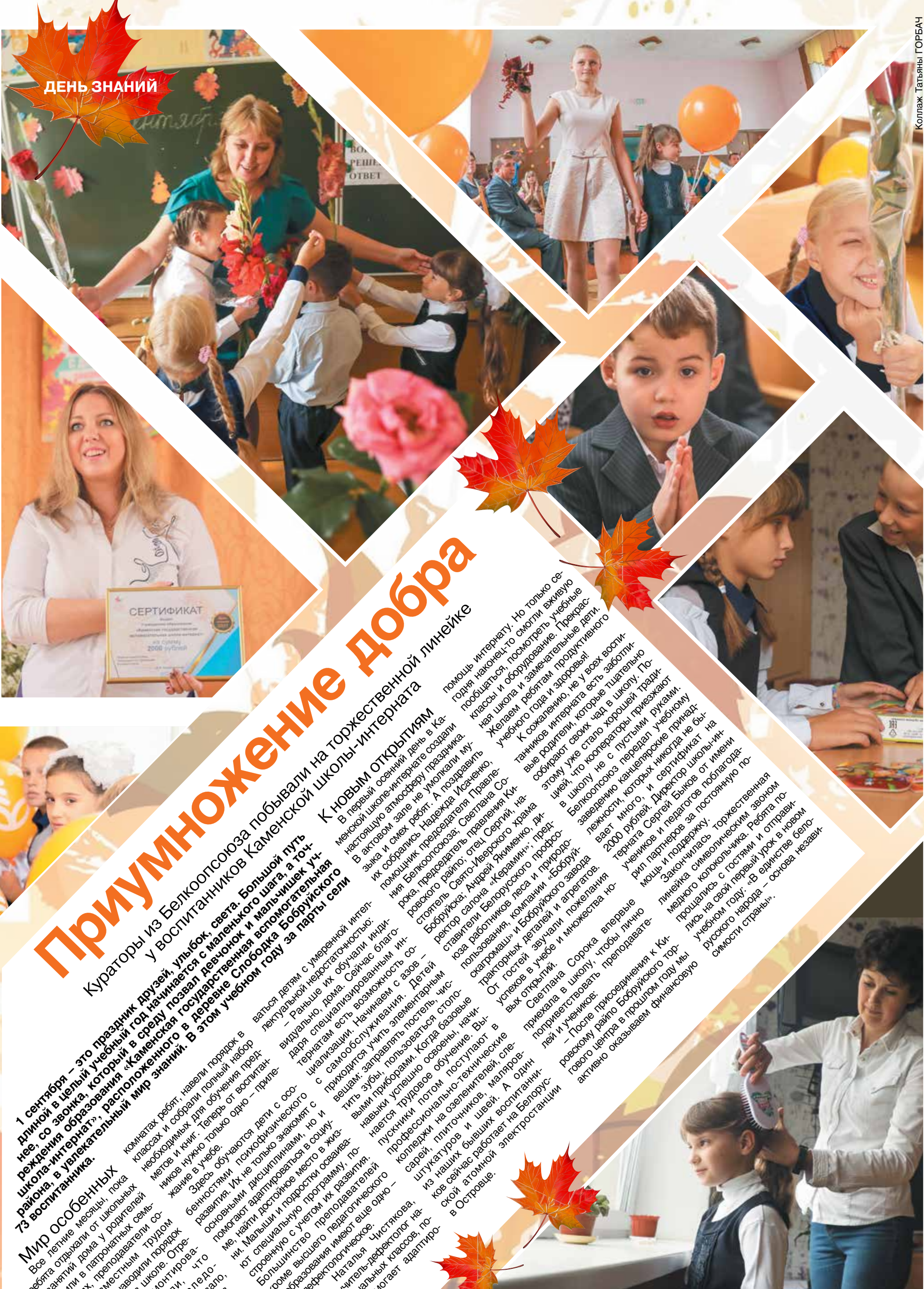
Коллаж Татьяны ГОРБАЧ