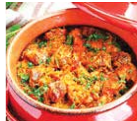
капуста тушеная по-домашнему в горшочках – 2,49 рубля