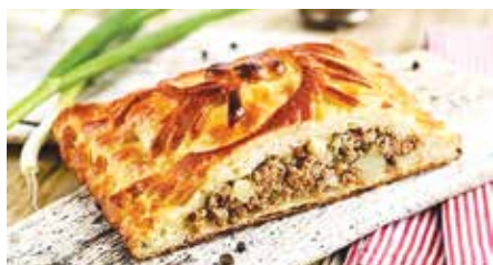
пирог с мясом и картофелем (1 кг) – 11,99 рубля