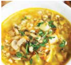
суп перловый с грибами – 1,49 рубля