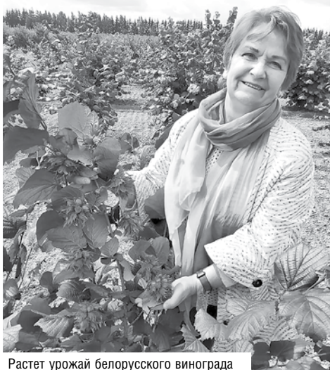
Растет урожай белорусского винограда

11 сентября в Гомеле пройдет республиканский фестиваль арбуза, где будут представлены 25–30 сортов и гибридов ягоды, а также крупные 25-килограммовые плоды. Свое мастерство продемонстрируют карвингисты (мастера художественной резки по овощам и фруктам).