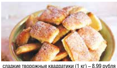
сладкие творожные квадратики (1 кг) – 8,99 рубля