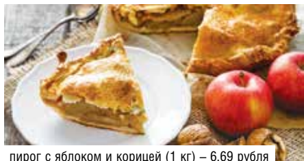
пирог с яблоком и корицей (1 кг) – 6,69 рубля

В магазинах, кулинариях, универсамах, кафе-ресторанах и буфетах пройдет акция по реализации кондитерских изделий и полуфабрикатов.