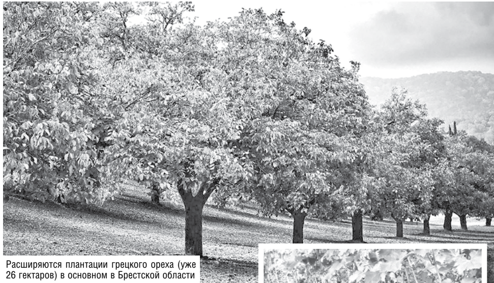
Расширяются плантации грецкого ореха (уже 26 гектаров) в основном в Брестской области