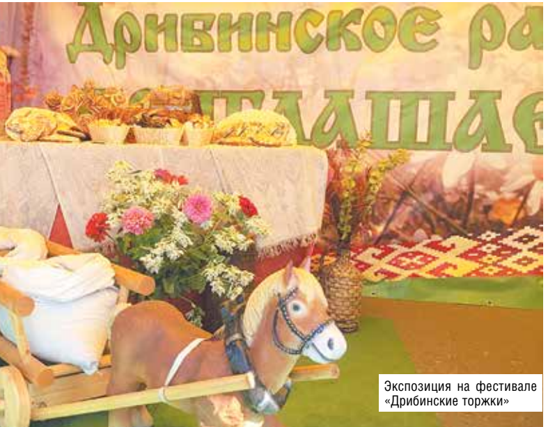
Экспозиция на фестивале «Дрибинские торжки»

Профессиональные династии всегда вызывают интерес. Поэтому никак нельзя было пройти мимо такого факта: в Дрибинском райпо Могилевского обл-