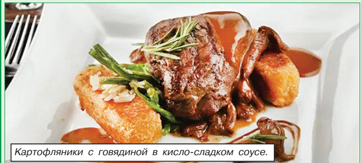
Картофляники с говядиной в кисло-сладком соусе.