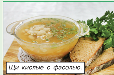
Щи кислые с фасолью.

В целях популяризации белорусской национальной кухни не только в объектах придорожного сервиса, но и в общедоступной сети предприятий общественного питания Белкоопсоюза разработано и утверждено типовое меню из белорусских блюд, которое отражает колорит и самобытность нашей культуры. Блюда выделены в меню отдельным цветом.