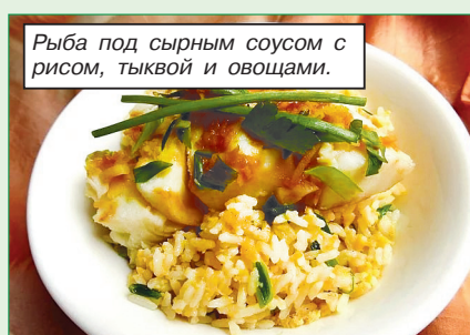
Рыба под сырным соусом с рисом, тыквой и овощами.

Еженедельно Белкоопсоюз проводит акцию «Блюдо недели» белорусской кухни в сети ресторанов потребительской кооперации.