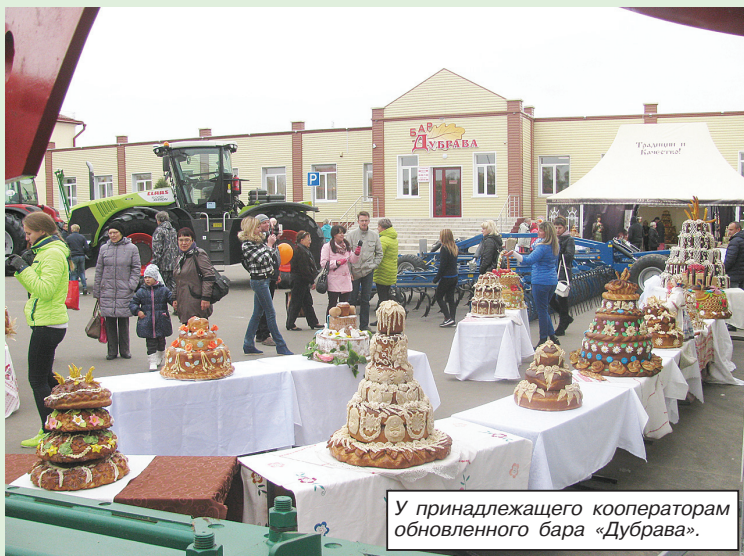
У принадлежащего кооператорам обновленного бара «Дубрава».

А какой же праздник урожая без щедрой ярмарки? Здесь ко-