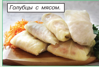
Голубцы с мясом.