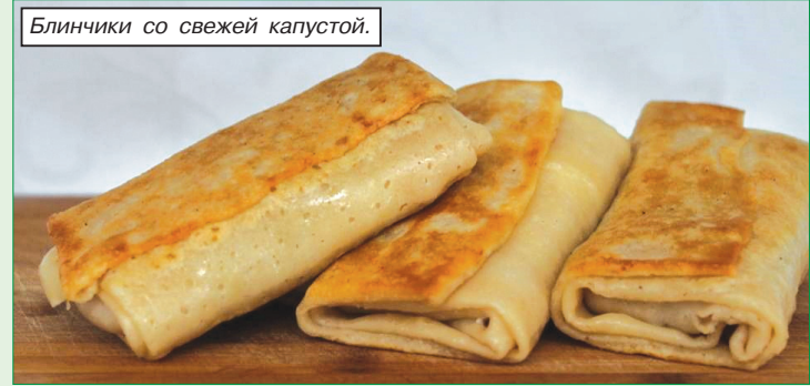
Блинчики со свежей капустой.