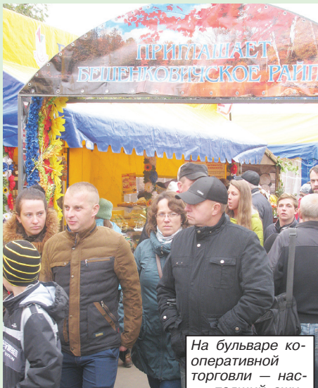
На бульваре кооперативной торговли — настоящей ажиотажа.

У каждого района, как в таких случаях и положено, оказались свои изюминки. На Поставском подворье хитом продаж стала грудинка — соленая и сырокопченая, а в соседней па-